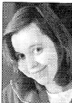
Nová třebaňská knihovnice L. Kirova.

Knihovna by chtěla rajit nové, mladší čtenáře. Pro děti by měly být nakoupeny knižní hity typu Tolkienova Pána prstenu či čtyři pokračování Harryho Pottera. Pro dospělé by neměly chybět romány Michala Viegweha či Ludvíka Vaculika. Pro ty, již si na knížku čas ne-