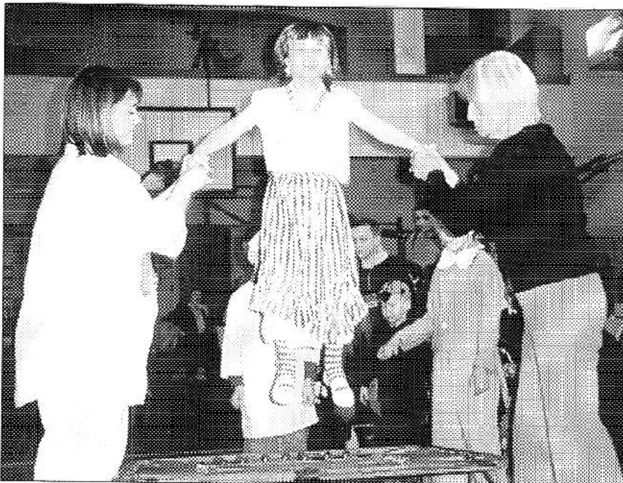
MASKY NA TRAMPOLINĚ. Ve dvou atrakcích dětského karnevalu, který v polovině duha pořádal řevnický sokolov, bylo skákání na trampolíně. (Viz strana 1)

Vítek přiznal, že situace v komunální politice příliš nesleduje. „Jsem rád, že konečně máme kanalizaci,“ řekl. Oznamovat karlštejnské zastupitelstvo za jeho činnost v končícím volebním období však odmítl s tím, že k tomu není kompetentní. Dodal, že pokud řeší nějaký problém, pak většinou osobně se starostou. (Viz strana 3) (pš)