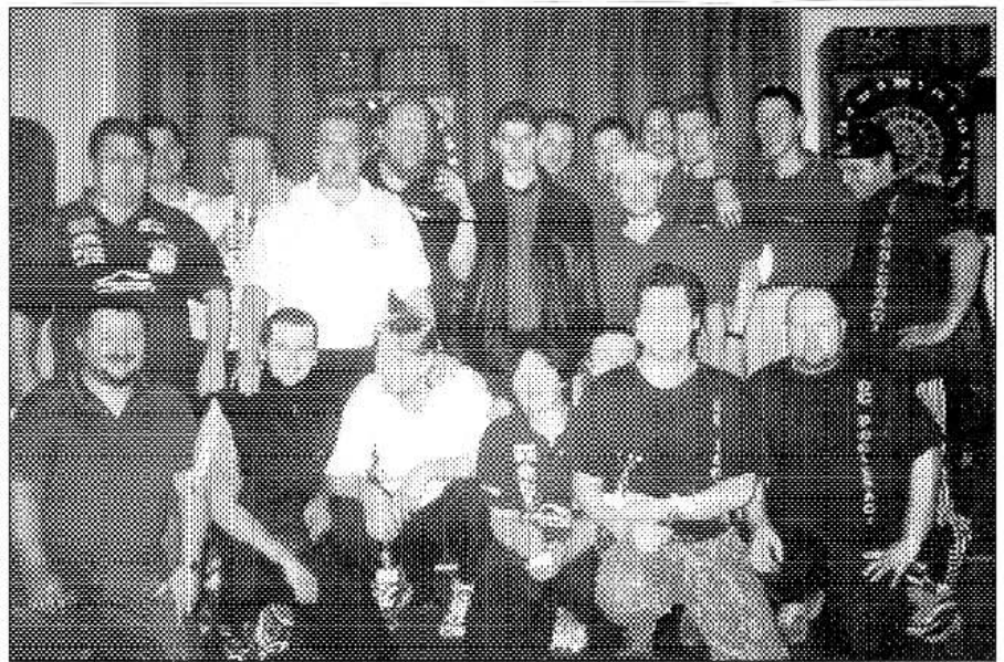
Zadní Třebaňští šipkaři po jednou z turnajů