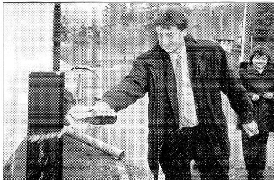
RADOST Z ČISTICKY. S velkou pompou a kampaňským zahajovali Karlštejnští loni na podzim provoz čistírny odpadních vod. Radost z ní má rychta i obyvatelé obce.