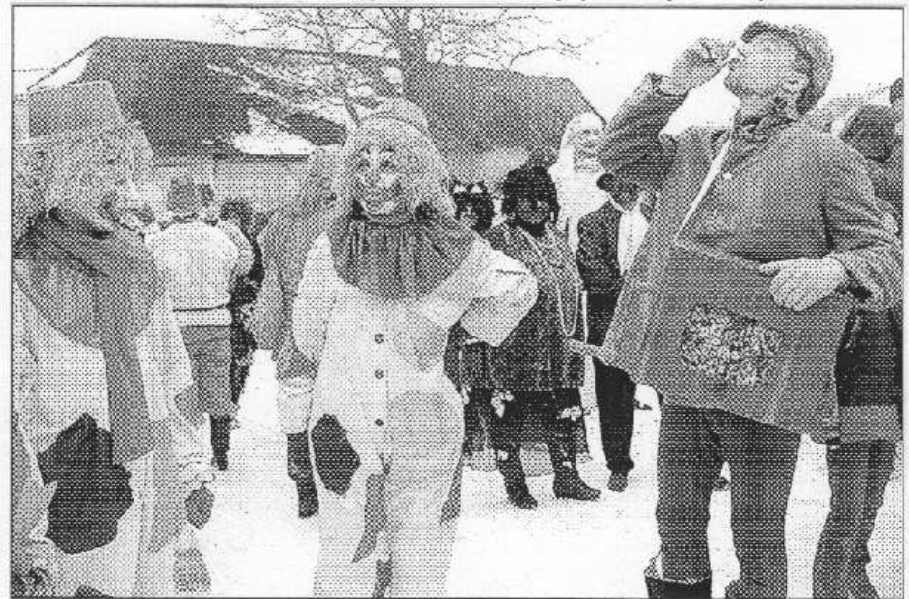
Maškary se posílují kofalkou při masopustním průvodu ve Svinařích.