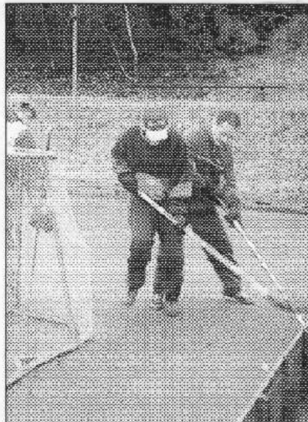
Jeden ze zápasů řevnického turnaje v pozemním hokeji.

Výsledky: Mamá snaha - Top Adrenalin 0:2