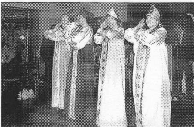
Volba miss na turistickém Candrbále.

Někdejší školní třídy ve Svinařích v těchto dnech předělává zdejší radnice na nové kanceláře úřadu. Budovu radnice se jí totiž podařilo po několika měsících prodat za tři miliony korun novému majiteli. „Stěhovat do nových kanceláří se budeme poslední týden v únoru,“ uvedl Roztočil. Dodal, že třídni hodiny zůstanou beze změn. (pš)