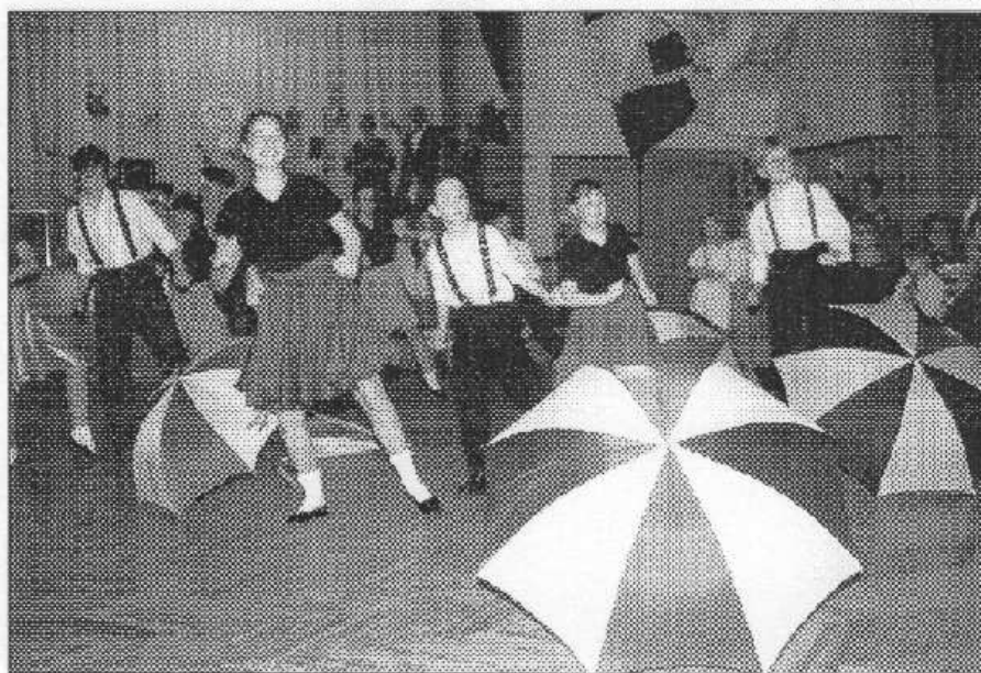
Rebelové na plesu Klíčku sklídili velký aplaus.

jejich výkon se vyrovná výkonu tanečnicků ze stejnojmenného muzikálu. Radost, hravost a rošťáctví, jež z nich vyzařovalo, dávalo najevo, co jsou zač: