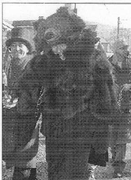
V čele letovskeho masopustního průvodu pochozoval medvěd.

I v březnu budou děti, které měly zájem, trávit páteční dopoledne v pířiranském bazénu. Navíc je čekají dvě divadla: 4. 3. od 9.00 Kašpárkovy pohádky a 17. 3. ve stejný čas hra O neposlušných kůzlátkách. V doprovodu rodičů mohou přijít i děti nenávštěvující mateřinku. (pš)