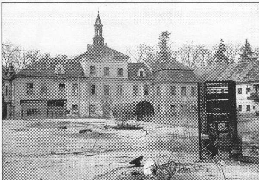
Svinařský zámek je v současnosti totálně zdevastovaný.

„Jediné, co máme, je fotografie z roku 1924,“ vysvětluje. Pomáhají mu tak místní, kteří na bývalé majitele arcádu rádi vzpomínají.