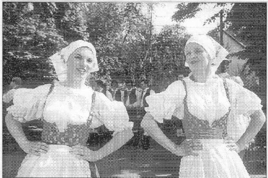
Na čtvrtém ročníku poberounského folklorního festivalu vystoupí patnácti souborů.

mem, v němž se postupně představí osm souborů, udělá posezení při cimbalu s muzikou Žandár. Festival podpořil mikroregion Dolní Berounka, o