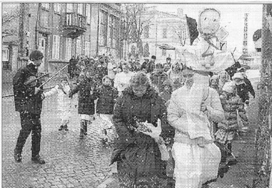
Mořenu symbolizující zimu pochovaly děti ze souboru Klíček.

vody všechny již zahřívá vykukující Slunce, které přemohlo těžká oblaka. Ještě pár tanečků a už se Mořena nese na most přes Berounku. „Ona se nám