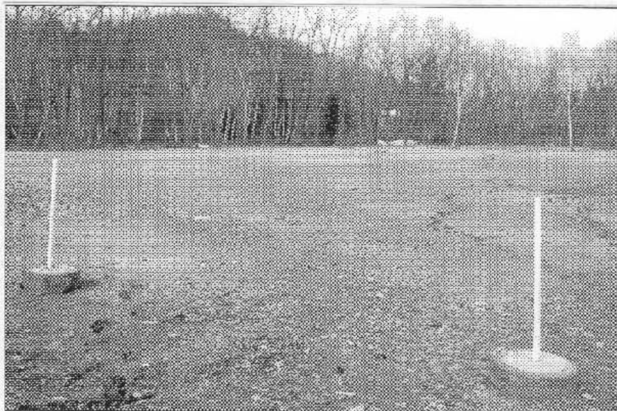
Takto vypadá zadotřebaňské hřiště Na Ostrově osm měsíců po povodni. Místní fotbalisté se sem už ale možná nevrátí.