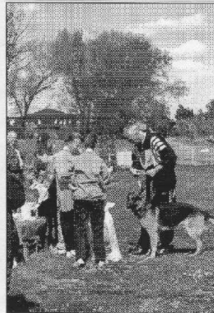
Sedmnácti borců změnilo síly v závodě jednotlivců, který kraje května připravil letovský Kynologický klub.