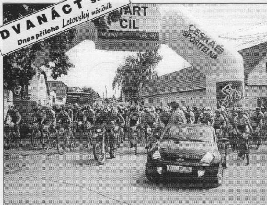
START. Třináct stovek sportovců se uplynulou sobotu sjelo do Letů na závod horských kol. V hlavní kategorii z místní návsi odstartovalo 1150 borců. (Viz strana 1)

Řevnice - Osobní vůz Audi 80 s francouzskou značkou kontrolovali řevničtí policisté 3. 5. v Janáčkově ulici. Vyšlo při tom najevo, že automobil byl ukraden v Praze 2. Řidič z Hofovic, který byl již devětkrát souzen a jedenáctkrát vyšetřován policií za majetkové delikty, tvrdil, že modré audi koupil od neznámé osoby. Vyšetřovatelé tomu však nevěří - zadrželi sedmačtyřicetiletý muž totiž auto používal bez spínací skříňky. Hodnota deset let starého vozu patřícího smíšenému francouzsko-českému manželskému páru žijícímu trvale v Čechách je 150 tisíc korun. Řidič zadržovaný v Řevnicích bude souzen ve zkráceném trestním řízení. (vš)