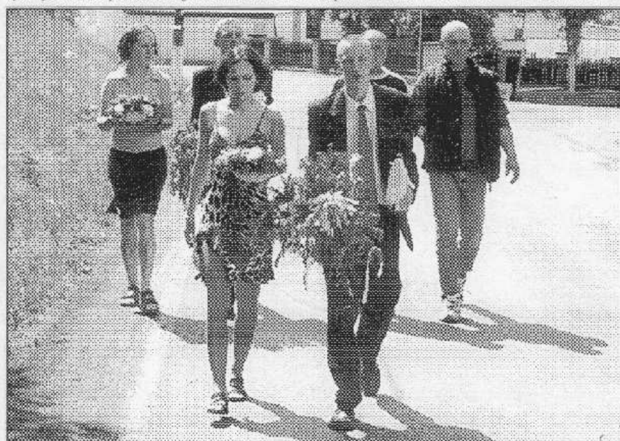
SVINAŘŠTÍ MÁJOVNÍCI. Svinařští mládí, kteří druhou květnovou sobotu vyrazili po vsi zvěst své spoluobčany na oslavu staročeských májů.

Ještě o hodinu dříve se při hudbě Třehusku tančilo v sokolovně v Dobřichovicích, kde si místo májů uspořádali zábavu fotbalisté. Pavla ŠVEDOVÁ