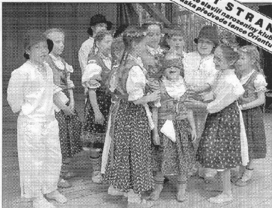
VALAŠI NA MÁJÍCH. Čtrnáct folklorních souborů vystoupilo na poberounském festivalu Staročeské máje, který v neděli skončil v řevnickém Lesním divadle. Jedním z nich byl i dětský valašský soubor Vonička. (Viz strany 5 a 6)

Když stařenka nesouhlasila, použil na ní násilí; k jeho vyvrcholení ale nakonec nedošlo. V parčíku ani v okolí v té době nikdo nebyl. Žena pak odjela na Smíchov, kde vše ohlásila železniční policii. Důchodkyně utrpěla drobné oděry na horním rtu a šok. Pachatel ve věku kolem 25 let byl urostlý, 180-185 cm vysoký. Na sobě měl bílé tričko s krátkým rukávem a světlemodré džíny, na pásku měl připevněný mobilní telefon. Podle policistů se mladík dopustil znásilnění, za což může být potrestán odnětím svobody na 2 až 8 let. (vš)