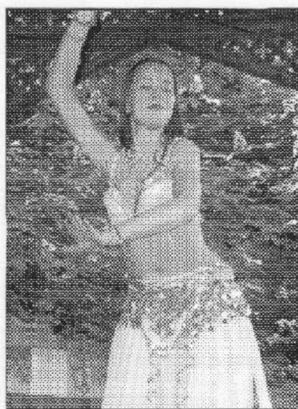
Jednou z atrakcí odpočinkového odpoledne ve Lhotce bude orientální tanečnice.

Vše se koná od 13.00 ve stáji Bílý kámen na Lhotce mezi Zadní Třebaní a Litní. Doporučené vstupné je 70 Kč. Středější nás potěší. Irena STÁNKOVÁ