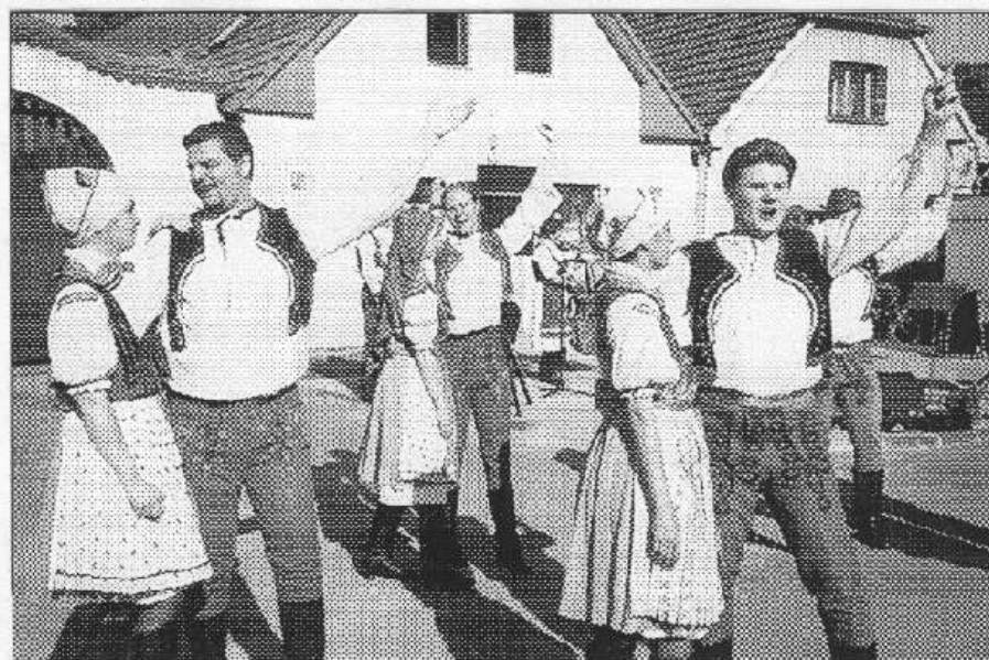
Velký potlesk si na letovské návsi vysloužil Slovácký krůžek.

ých středočeských krojích na závěr své produkce jako překvapení pro své vedoucí předvedli tanec indiánů, který se naučili na zájezdu ve Spojených