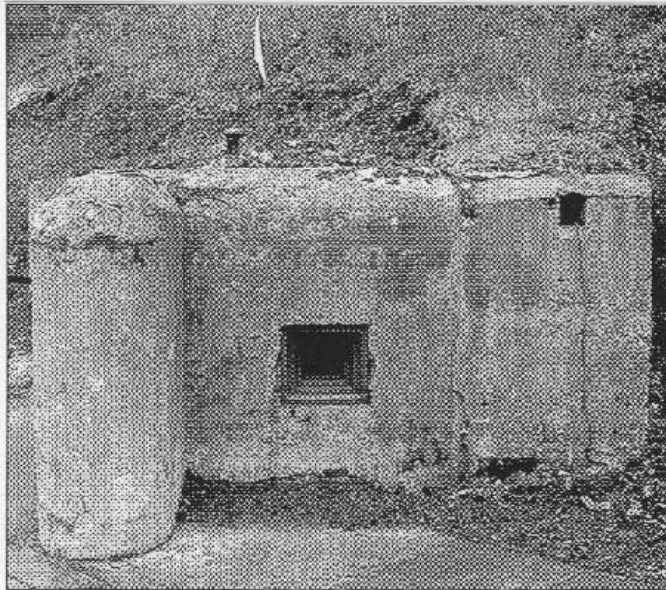
Karlštejnský bunkr bude veřejnosti přístupný 19. července.

byl navržen na prohlášení za kulturní památku České republiky. Veřejnost si jej opět měla mít možností prohlédnout 21. 6. Protože ale majitel objektu odstranil přístupové schody, bude bunkr přístupný až v sobotu 19. července. Zájemci si jej budou moci prohlédnout od 10.30 do 18.00. Aleš CRHA