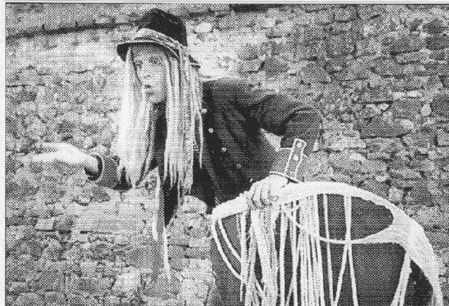
UKÁZAL SE I VODNÍK. Akce pro děti se v uplynulých dnech konaly v několika poborounských obcích. Na Medardovském festivalu v Dobříčovicích byl k vidění i vodník.

Hned tři organizace se podílely na přípravě dětského dne v Řevnicích, který se konal 1. června. Kromě tradičního pořadatele - sdružení Čas dětem - pomáhali s přípravou akce také řevnickí hasiči a členové oddílu Bobří.