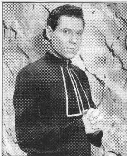
Známy zpěvák Pavel Vítek v jedné z muzikálových rolí.

Odpověď zašlete na adresu redakce (Naše novi-