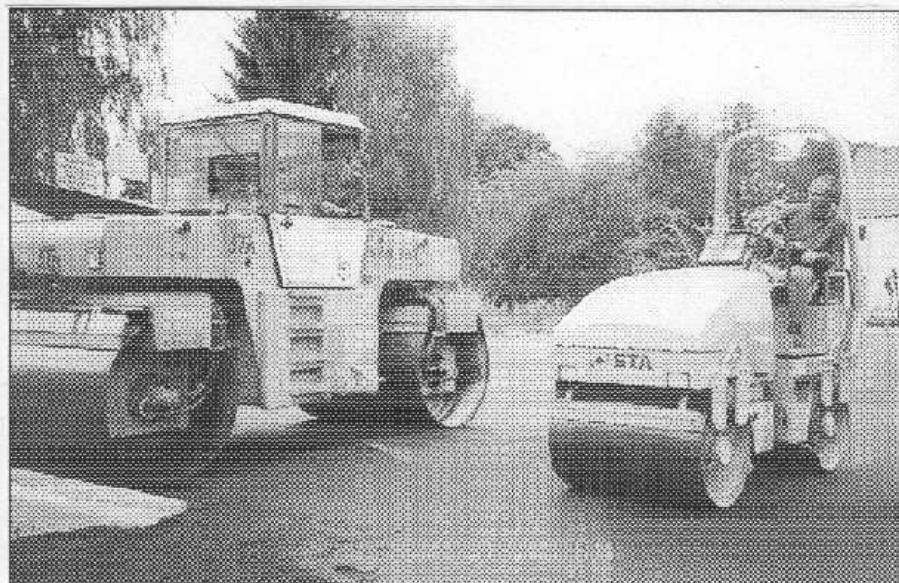
Plochu budoucího tréninkového hřiště asfaltovávají dělníci minulý týden.

okolí žadný klub,“ pochválil se trenér A mužstva. V září - 6. a 7. 9. - Letovští uspořádají oslavu fotba-