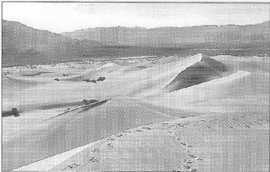
Na Čechy můžete narazit i v Údolí smrti.