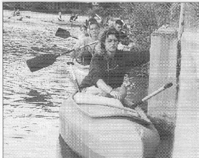
SKAUTI U JEZU. Tři desítky belgických skautů splavovaly upířímý rybník řeku Berounku. Přes třebeňský jez vodáci lodě přenášejí.

slední místo a 21 bodů (5 vítězství, 6 remíz, 15 porážek) k záchraně nestačilo. Tým se zejména na jaře potýkal s problémy se sestavou. Nezdicka museli nastupovat hráči B-celku, což k úspěchu vést nemohlo. S tak úzkým kádrem, jaký měl OZT, se krajská soutěž hrát nedá. Mužstvo v klíčových zápasech o záchranu nebodovalo, sítěcky se dařilo pouze Prašínovskému, což bylo málo. Jiří PETŘÍŠ