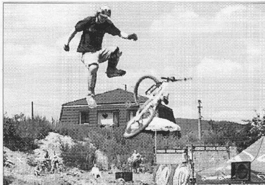
Hodně krkolomné skoky byly k vidění na závodech v Letech.

než příjemná. Doufám, že diváci odcházeli domů spokojeni. Skoda jen menšího počtu jezdce. Dirt jump je sport, při němž se nelze vyhnout občasným zraněním. V Letech tak bylo možné, bohužel jen