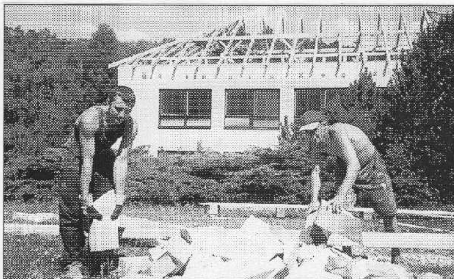
Nová střecha zadnotřebaňské školy má být hotova do konce prázdnin.