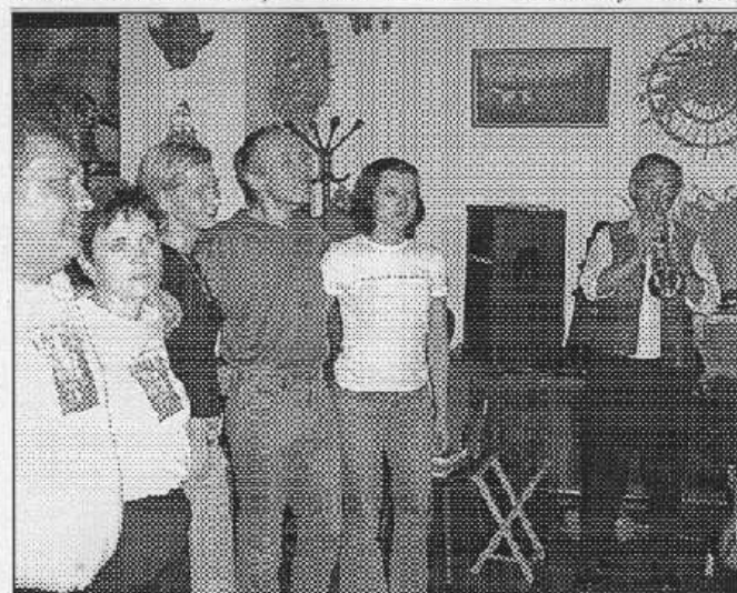
Členové Klubu příznivců Třehusku si na valné hromadě s kapelou také zpívali.

odpovědi projevila opravdu VELKOU aktivitu. Mimochodem, autorem názvu je syn trumpetisty Třehusku Jaroslav Němeček mladší.