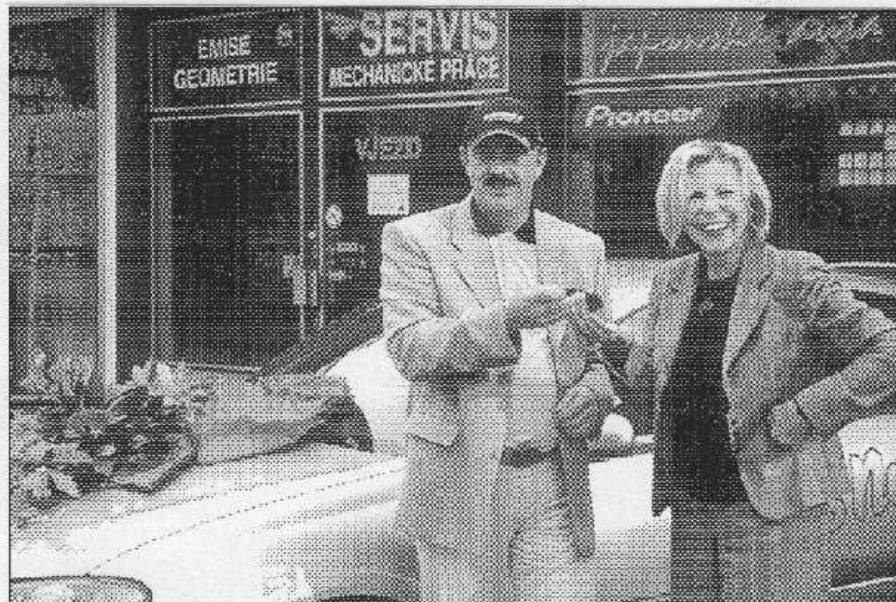
ZAGOROVÁ V ŘEVNICÍCH. „Zhruba nového stříbrného nissana si před několika dny z Řevnic odvezla známá zpěvačka Hana Zagorová.“

kontakt: IBS-ROKAL s.r.o. tel.: 251643453, 251643530 e-mail: info@ibs-rokal.cz http://www.ibs-rokal.cz