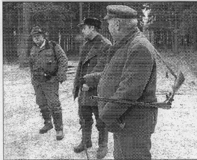
Řevničtí myslivci na jednom ze svých honů.