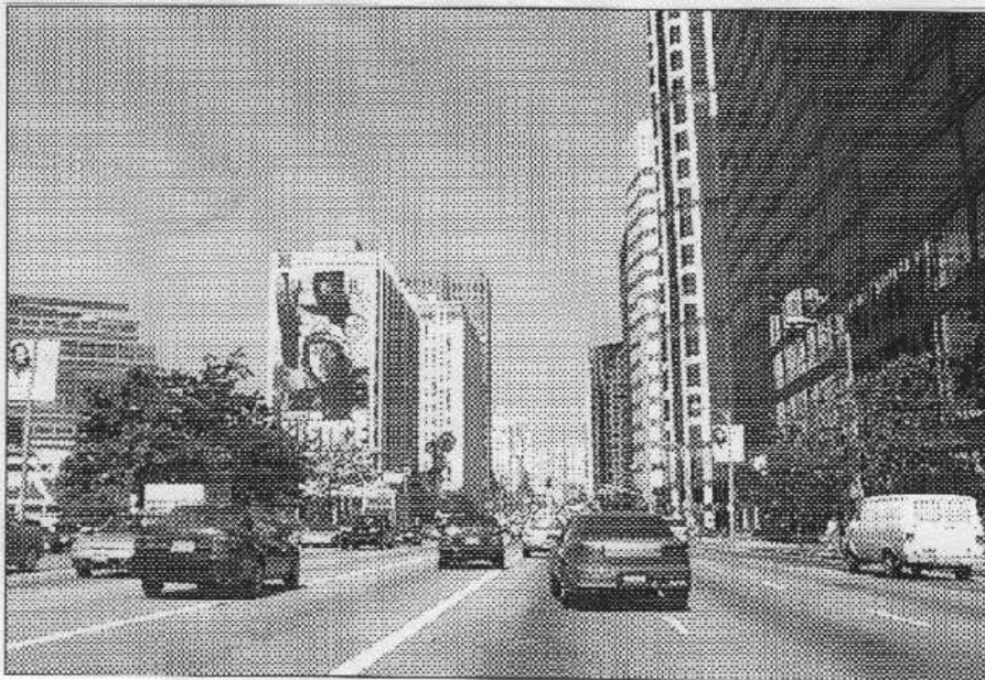
BEZ AUTA ANI RÁNU. Doprava v Los Angeles je bez auta nemožná.

Začíná se stmívat. Slunce jakoby se chtělo schovat v moři kdesi za obzorem. Vracíme se zpět k autu a jedeme do Agoury na večeři v čínské restauraci.