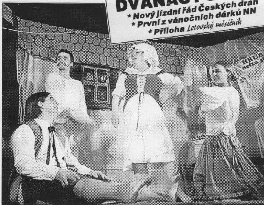
TVRDOHLAVÁ ŽENA. Součástí slavnostního odpoledne Našich novin bylo i také divadelní představení Tvrdohlavá žena v nastalavské souboji Klouby z Mníšku a okolí.