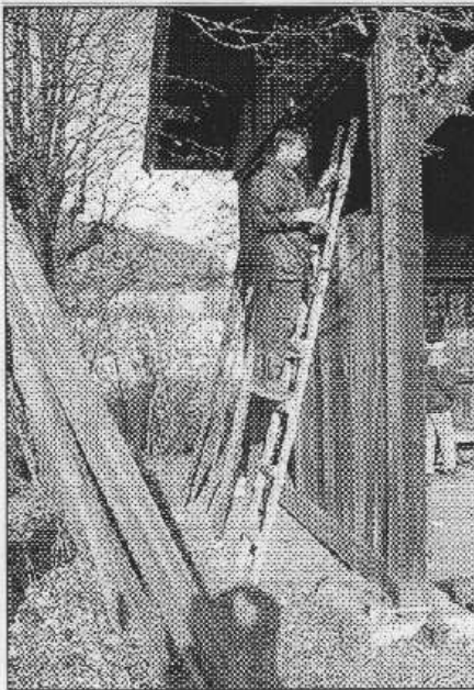
Železniční zastávku Skuhrov pod Brdy opravili před pár dny obyvatelé obce Leč.

Prkna na opravu dřevěné stavby organizátorům akce obstaral výpravčí Komzák z Lochovic, kde byla v létě likvidována stará kolna. „Hned bylo pr-