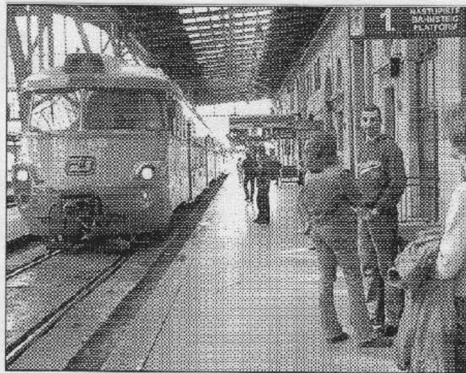
Většina pantografů bude podle nového jízdního řádu končit na pražském Hlavním nádraží.

že vlak v Berouně nečeká na přípoje. Osobní vlaky od Plzně přijíždějí do Berouna někdy i jen 3 minuty před