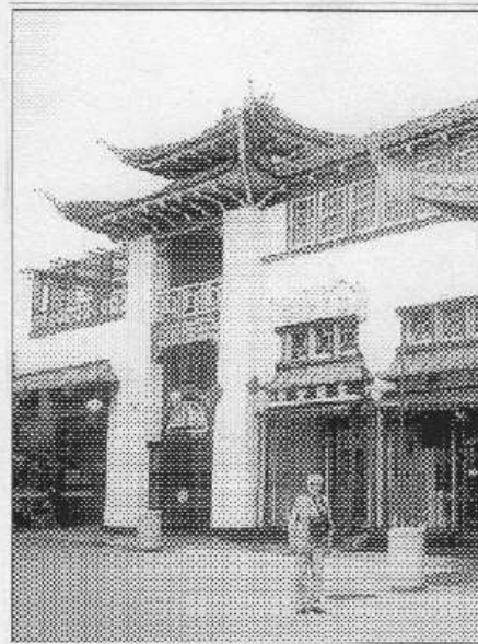
Autor článku před jedním z domů čínské čtvrti v Los Angeles.

Sjíždíme dolů. Pro mne je přichystáno ještě jedno překvapení: návštěva saloону. Typická cowbojská hospoda, celá dřevěná. Na balkónech jsou figury děvčát v dobových oblecích, dole muži dýcháivé