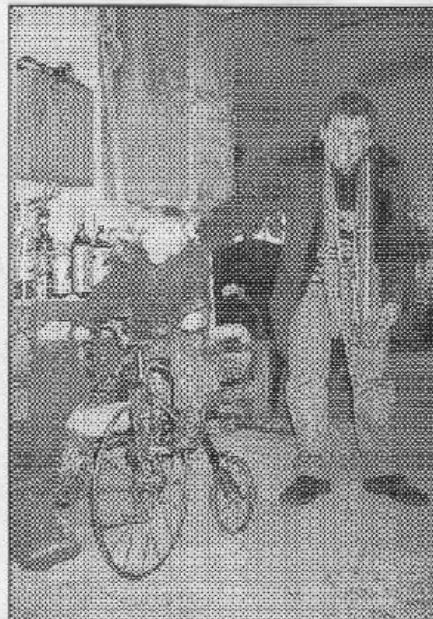
Na staré dobré časy si o Šiščím dne v řevnické dlně Tomáše Svobody vzpomínal také Spolek stároničů Zadní Třebaň.

Začátek války tomu všemu učinil konec. Lidé se stáhli do malých domácích společností, kde mohli o všem spolehlivě a beze strachu hovořit. Sehnalo se i nějaké víno, většinou ne šampaňské. Společnosti se však pomalu rozpadávaly, tak, jak lidé pozvolna mizeli ve vřavě válečných událostí. Jediným místem, kde se lidé sešli na veřejnosti, byl biograf. Na Silvestra mival dvojitý program, a to tak, že konec se protáhl do půlnoci. Pak se všichni odebrali domů. Nezapomenutelný byl Silvestr 1939-40. Zi-