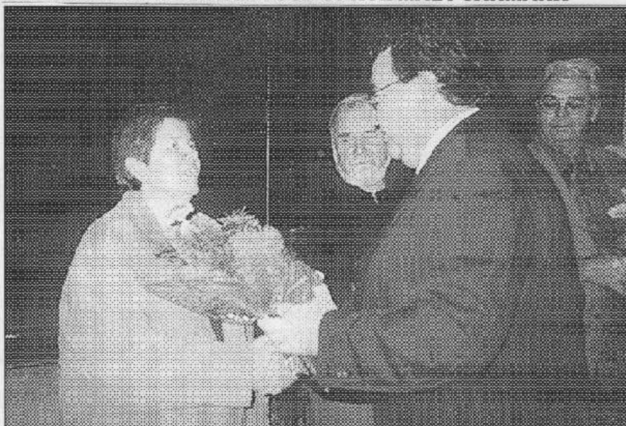
KVĚTY PRO TŘEBANĚ. Několik obyvatel Zadní Třebeň, kteří letos dosáhli důchodového věku, dostalo na předvánočním posezení od starosty obce květiny a malý dárek.

Tečku za předvánočním posezením obstarala domácí hudební skupina Třehusk. Ta jednak zahrála několik písniček ze svého nedávno pokřtěného e-