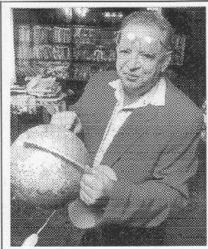
Cestovatel Miloslav Stingl

V posledních čtyřiceti letech jsem většinu dovolených trávil na chatech v Černošicích. Kraj kolem Berounky patří mezi nejkrásnější v Česku. Víím, o čem mluvím, protože jsem procestoval svět do slova křížem krážem. Ale kdykoliv jsem se vrátil z toulky po exotičtějších krajinách zeměkoule a přijížděl od západních hranic vlakem, už od Berouna jsem stál u okna, aby mi neušlo nic z přírodních krás podél Berounky. K mým nejoblíbenějším patří místa spojená se jménem sester slavné kněžny Libuše. Kazín, místo opředené legendami, doslova oplývá půvabem a krásou. Tetín je jedním z nejstarších historicky doložitelných hradišť. Sídliť tu samotná kněžna Ludmila. Neměl bych taky zapomenout na lom Amerika, kde se