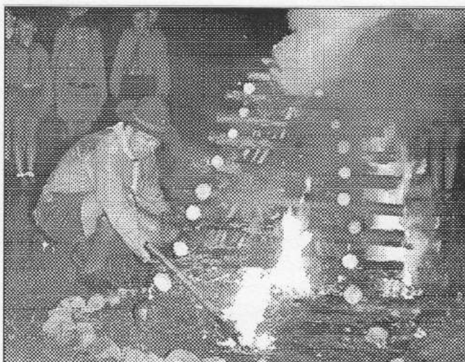
U trampských a skautských ohňů se odjakživa zpívalo.

S rozvojem českého trampského hnutí ve 20. letech minulého století úzce souvisí i vznik trampských písní. Romantické okolí hlavního města přímo svádělo k představám Divokého západu a mládež se snažila jej napodobovat se vším všudy. Nebylo to jen kovbojské ustrojení a zálesácké sruby, ale i indiánské ohně. Milčet se sice u ohně