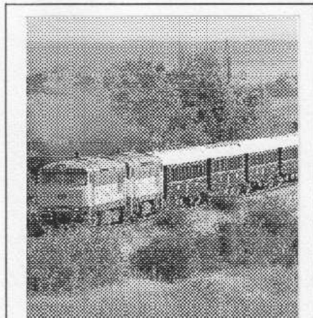
SLAVNÝ VLAK. Proslavený Orient Express projíždí před pár dny Poberounim. V září ho můžete spatřit opět. (Viz str. 3)

„Vosu se nedařilo z ušního otvoru vyndat, protože se dostala příliš hluboko a nebezpečí, že by ženu v těch místech píchla bylo tak velké, že jsme ji odvezli do nemocnice v Motole,“ řekl NN šef řevnických záchrannářů Bořek Bulíček. „Vosa byla tak rozběsněná, že triatřicetileté ženě doslova rozkousala ušní bubínek, takže neslyší. Bude zřejmě muset podstoupit plastiku bubínku, která jí sluch opět navrátí,“ dodal Bulíček s tím, že lidi poštipané hmyzem teď ošetřuje záchranka velmi často. (šm)