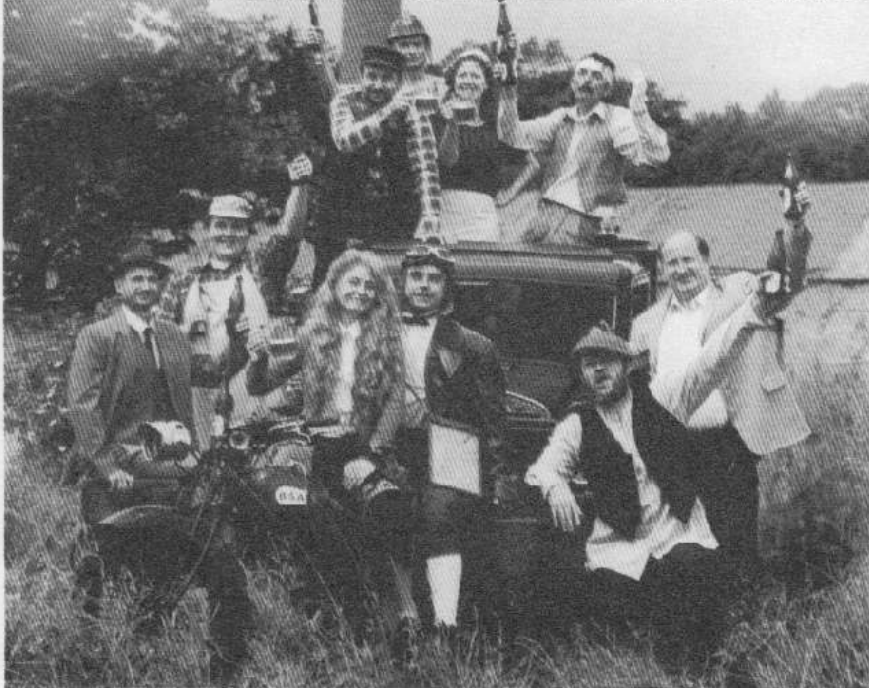
Hlavní představitelé muzikálu Posířiziny u svinařského zámku.

Původní muzikál na motivy Bohumila Hrabala