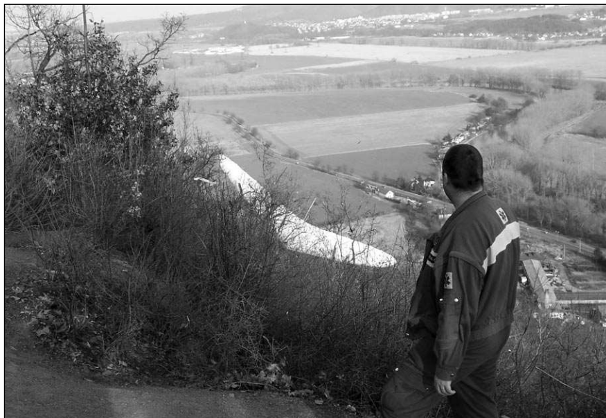
Hned poté, co mladý rogalista 22. 3. vzlétl se svým strojem u Černošic, spadol do větví stromů. Mladík utrpěl jen drobné oděrky, takže byl ošetřen a ponechán na místě. (šm)

čena na poli u silnice směrem na Líteň, si slibuje nárůst počtu dětí. Pavla ŠVĚDOVÁ