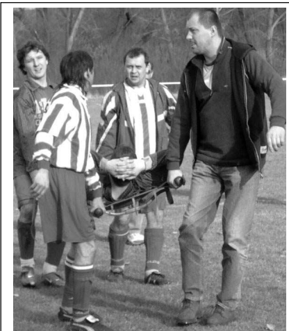
K prvním mistrákům po zimě nastoupili fotbalisté obcí našeho kraje. Osovského Procházka odnesli z liteňského hřiště se zlomenou nohou. (Viz str. 12)

Hostomice – Neuvěřitelně drzým způsobem si počínal dosud nezjištěný chmaták, který v Hostomických řádil v noci z 21. na 22. března. Vůz Škoda Felicia zaparkoval jeho majitel na dvoře svého domu a odešel domů. Zatímco spokojeně trávil večer, drzý zloděj vnikl na dvůr a pokusil se vypáčit zámky dveří. Když neuspěl, uřízl část těsnící gumy a odnesl čelní sklo. K němu si »přibalil« i páte dveře. Při zpáteční cestě ukradl ještě čelní sklo Škody Pick-up parkující u silnice. (pš)