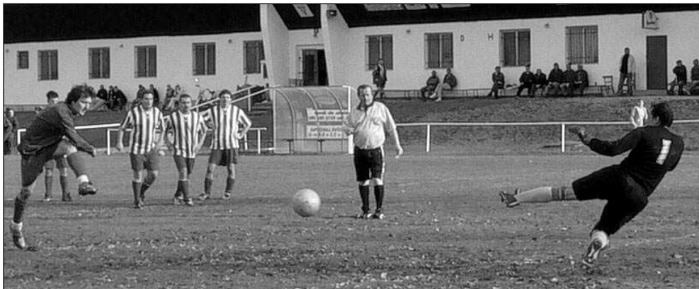
Dvě penalty kopali na hřišti Litně borci hostujícího Osova. Přesto odjeli poražení 1:2.

Branka OZT: Kozák V prvním jarním utkání 1. B třídy skupiny E přivítal Ostrovan Zadní Třeňbaň na svém hřišti vedoucí celek tabulky Hradištko. Hosté měli od začátku převahu. Ostrovanu se nedařila kombinace. Když se OZT dostával do hry, přišla rychlá akce Hradištká a jeho vedoucí branka. Vzápětí mohl