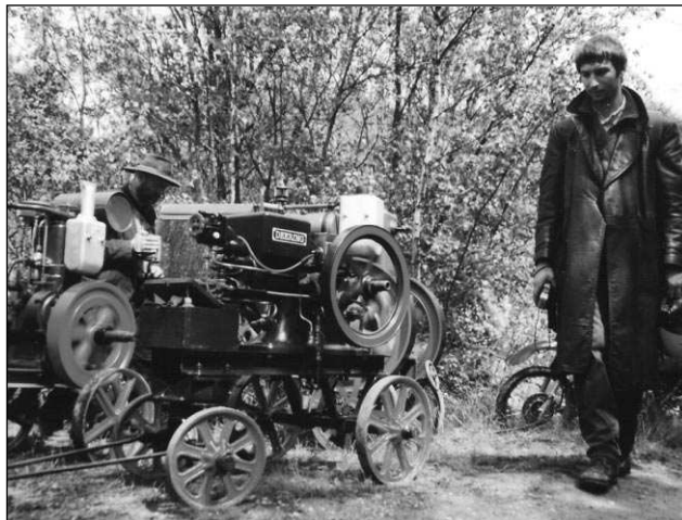
Skansen Solvayovy lomy u Bubovic zahajuje sezonu 30. 4. V červnu se tu sejdou citelové veteránů a »rotujících setrvačníků«.

Také Točnick láká turisty na mnoho programů - od 30. 4. do 1. 5. jsou to pravěké dny Mamuti na Točnicku. Od 10 do 17.00 uvidíte dílny, obydlí, kuchyně i ukázky řemesel z neolitu. V dubnu je otevřen hrad jen o sobotách a nedělích (10-16), v dalších dvou měsících denně kromě pondělí od 10 do 17.00. Základní vstupné je 30, zlevněné 15 Kč. Sousední Žebrák je otevřen o víkendech až do začátku prázdnin, v květnu od 10 do 16.00, v červnu o hodinu déle. Vstupné je 10 a 5 Kč. Jedinečnou podívanou slibuje návštěva skanzenu Solvayovy lomy u Bubovic, jež slavnostně zahájí sezonu 30. dubna. V květnu a červnu je areál otevřen jen o víkendech, v sobotu 10-17, v neděli 10-16. Pro dospělé je vstup 50, pro děti 40 Kč. Od 11. do 12. 6. se uskuteční 2. setkání »Rotujících setrvačníků«, neboli setkání sběratelů stabilních motorů. Pavla ŠVĚDOVÁ