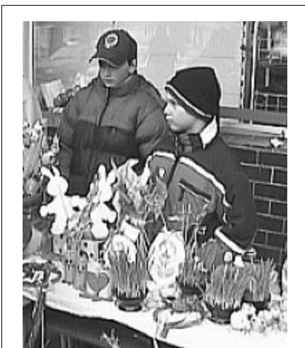
VELIKONOČNÍ JARMARK. Pomlázky, perníčky a věci z proutí nabízelí žáci hostomické školy Pavla Lisého na velikonočním jarmarku ve středu 23. března.

Učitel a učitelka, učí žáky od pondělka. Kdyby mohli učit déle, učili by do neděle.