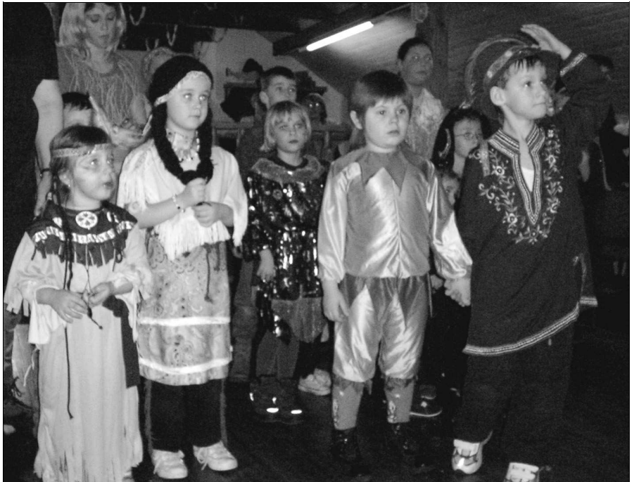
MÍRNÁ NERVOZITA NA STARTU. Malí účastníci dětského karnevalu ve Vižině naslouchají pokynům organizátorek soutěží. Vyhrál každý, kdo se zúčastnil.