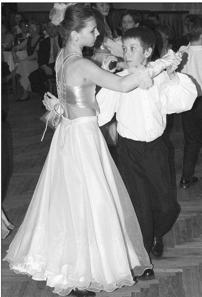
Taneční kreace na plesu Klíčku a řevnické školy.

O půl deváté přichází na řadu první překvapení večera. Diváci očekávají tradičně malé tanečnický z Klíčku, ale na parket nastupují místo dětí jejich rodiče a sálem zaznívají tóny honosné polonézy. Oni jsou celí v černém, jak se na gentlemany sluší, smokinky jsou doplněny elegantním bleděmodrým motýlkem. Ony přicházejí v modrých róbach s dlouhými, hedvábnými, bleděmodrými šálami. Bohužel vám nemohu popsat dojmy z předtančení, jelikož s prvním tónem skladby začínám poctivě odpočítávat raz, dva, tři, raz, dva, tři a takto pokračují plných pět minut. Podle ohlasu obecnosti snad ale