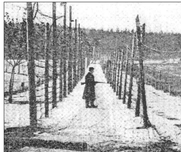
Osmaté dráty kolem bytízského lágru.

ků od našeho baráku a zase se vrací. Na úrovni vedlejšího baráku přestalo nástupiště existovat - zela tu obří jáma, z níž stoupal prach a pára. Přední část dalšího baráku visela nad okrajem kráteru.