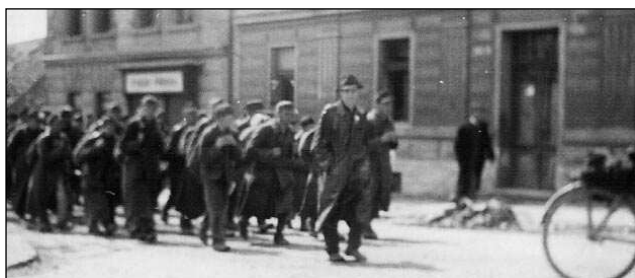
Němce utkající 8. května 1945 z Berouna fofografoval Stanislav Novák ze Zadní Třebaně. Týž den jej jiní němečtí vojáci prchající z Prahy zastřelili v Hájkou mezi Třebaně a Svinařemi.

jak snažili protektorátní dobu profláknout. Na berounském nádraží znovu znělo Už mě koně vyvádějí a jiné písně, jimiž mladí lidé vyjadřovali smutek, když byli násilím odváděni hájit cizí zájmy. Tito hoši odjízděli do neznámých poměrů. Někteří přecházeli z lágrů válečné důležitých tovarů. Ti neměli co ztratit, kromě vlastního života. (Pokračování) FRANTIŠEK ŠEDIVÝ