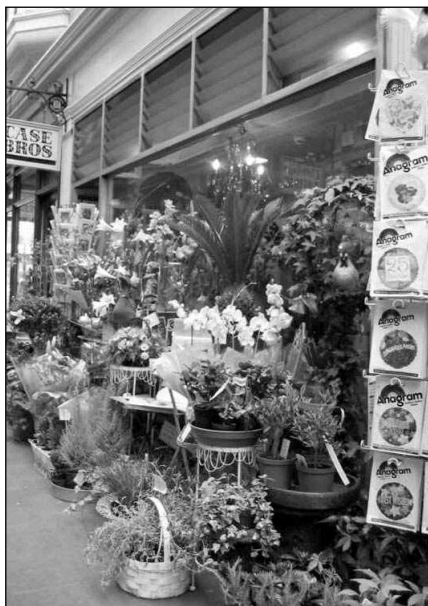
Nakoupit správné květiny či dřeviny není právě jednoduché.

+ Jde o prvovýrobce, proto jsou ceny nižší než u ostatních prodejců, odborný poradce je samozřejmě. I při úzké specializaci je v daném oboru