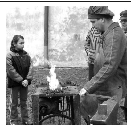
Historický jarmark, který se uplynulou sobotu konal v areálu dobřichovického zámku, přilákal i přes deštivé počasí mnoho lidí. Vyzkoušet si mohli středověké hry nebo obdivovat práci kováře.

Ve čtvrtek 31. března, v půl sedmé ráno se stala u obce Hostomice kuriozní dopravní nehoda. Tricetiletý řidič jel s autem Peugeot 406, na přímém úseku silnice mu ale náhle do cesty vběhlo divoké prase. Vůz se s divočákem srazil, náraz zvíře usmrtil. Majitel má škodu 60 000 korun. (pš)