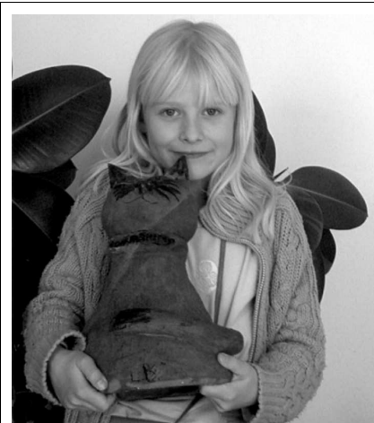
KERAMICKÁ KOČIČKA. V keramické peci osovské školy se momentálně vypékají kočky, pejsci a sovy.