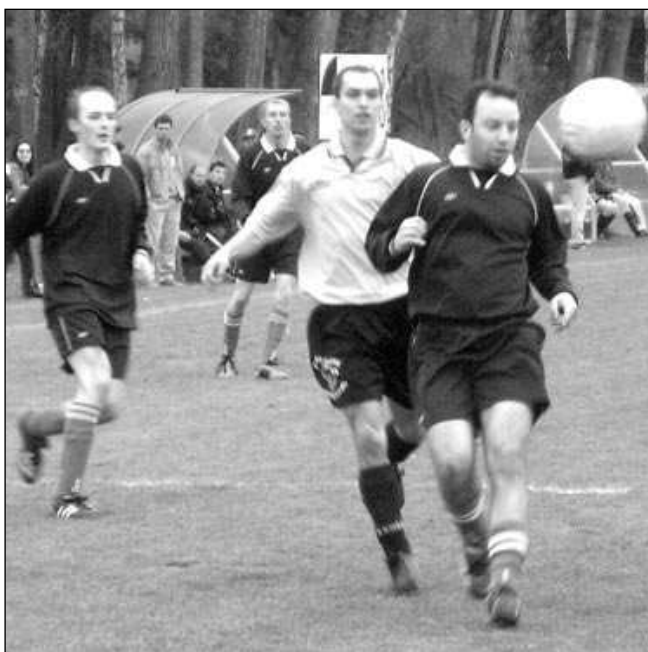
Uplynulou neděli Třebaň doma podlehla Hvozdnici 1:2.

Opět v neúplné sestavě zahajovali utkání Liteňští. V prvním poločase Šindler hlavou dostal domácí do vedení. Penalta se hostům sice nevydařila, přesto do konce půle vyrovnali. V druhé půli Antonín Franěk vsílil rozhodující branku. (pš)