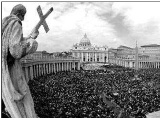
Při pohřbu papeže bylo vatikánské náměstí zcela plné.