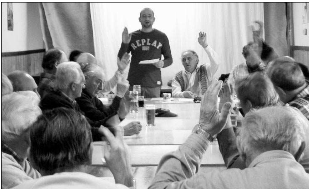
Před samým začátkem jarní sezony se řevničtí házenkáři sešli na výroční valné hromadě.

Soustředění řevnických házenkářů se odbyvalo koncem března v Tanvaldu v Jizerských horách. Pod vedením trenéra Rudolfa Zusky se ho zúčastnilo 14 hráčů A-celku mužů. Jedno auto vyrazilo za lyžováním na Tanvaldském Špičáku už ve středu 23. března ráno, ostatní jeli po práci. Ubytování jsme byli přímo v místní hale, kterou jsme hojně využívali. Tělo zlenivělé zimním spánkem dostávalo zabrat dvakrát denně, vždy 2,5 hodiny dopoledne a stejnou dobu odpoledne. Pro většinu z nás, kteří jsme neměli v zimní pauze balon v ruce a udržovali jsme se alespoň fotbálem v řevnické tělocvičně, to bylo nepříjemné procitnutí. Rozhýbat rozlámaného člověka bylo den ode dne těžší a těžší. Přesto všichni makali naplno celé čtyři dny. Chtěl bych tímto poděkovat Frantovi Zavadilovi a Ctíradu Leinweberovi za