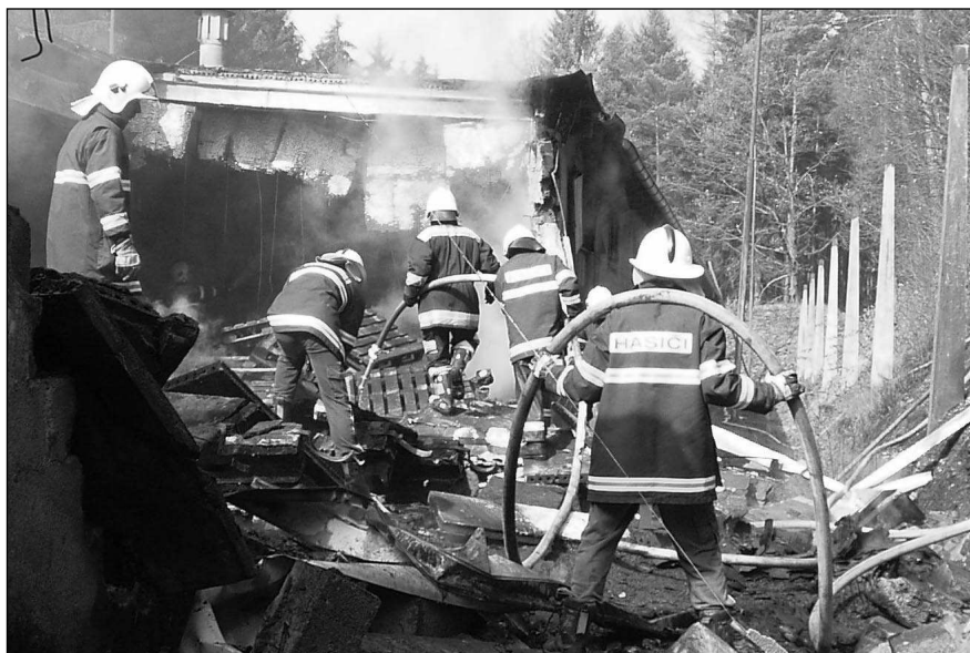
Požár výrobní výbušnin a munice u Psár likvidovali řevničtí hasiči.

Psáry, Řevnice - Požár skladu a výrobní výbušnin u Jílového hasili 24. března kromě pěti dobrovolných sborů i profesionálové z Řevnic. Oheň vznikl v 9.45 při výrobě na strojích pro drcení a mísení směsi, potom se rozšířil do expedice a balírny, kde byly i hotové výrobky. Tam několik balení explodovalo - zničeny byly střecha a stěna směrem k lesu. Největší ohrožení by způsobilo rozšíření na sklad hotových průmyslových trhavin, který se nachází za další příčkou budovy. Okolí skladu nechali hasiči evakuovat; příčka nakonec požáru i zborcení odolala. Škoda byla vyčíslena na 800 000 korun, uchráněné hodnoty se odhadují na 2 500 000 korun. Provoz se nacházel v objektu bývalých kasáren za obcí Psáry v lese. Při požáru utrpěl popáleniny