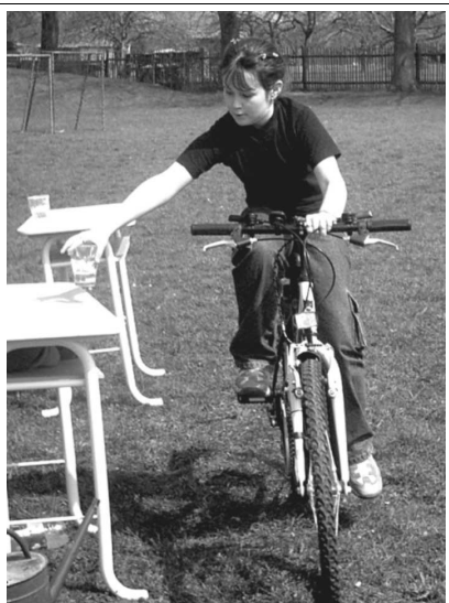
OSOVSŤÍ ŠKOLÁCI PEČLIVĚ TRÉNOVALI. Žáci 4. třídy se zúčastnili dopravní soutěže mladých cyklistů v Hořovicích, kde obsadili 4. místo (více na straně 6).