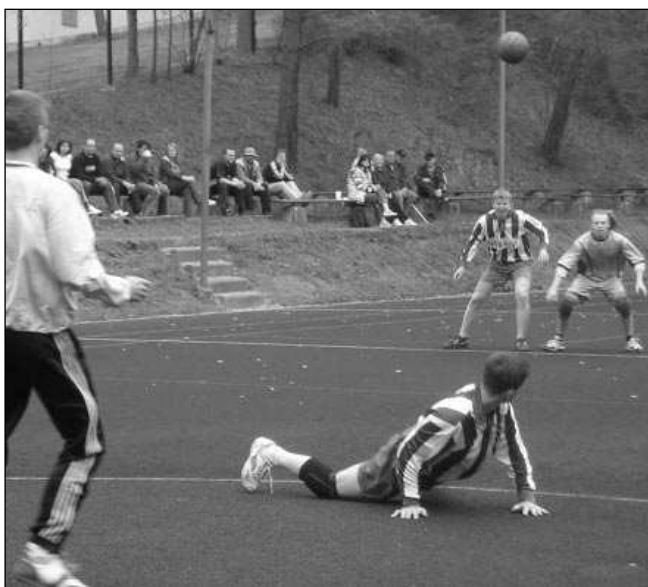
Řevničtí druholigoví házenkáři v prvním jarním mistráku rozstříleli Bakov. A to měli »v nohách« dvě svatby.