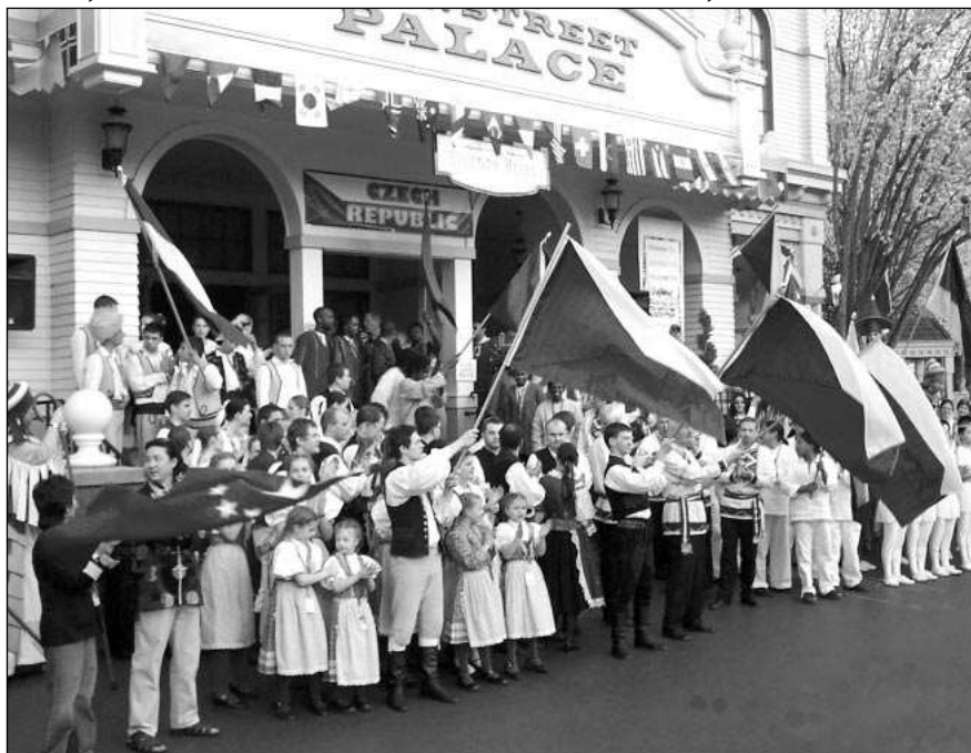
Soubor Notičky při ceremoniálu v americkém parku Dollywood.