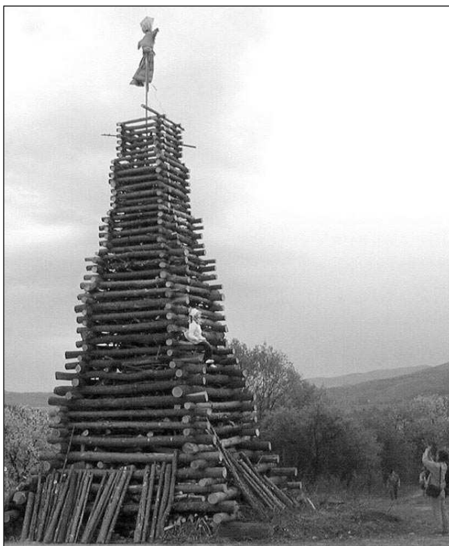
V Řevnicích před několika lety vystavěli čarodějnickou hranici, která se díky své výšce dostala i do české knihy rekordů.

V roce 1487 vyšla ve Štrasburku »inkvizitorská bible«, známé Kladivo na čarodějnice. Pro autory - dominikánské mnichy a inkvizitory Iacoba Sprengera a Henrica Institoris - bylo vše jednoduché. Čarodějnice je třeba fyzicky likvidovat, neboť to přikazuje Bible. Teoretické odůvodnění spočívalo v jednoduchém scholastickém výkladu. Čarodějnice se spolčuje s nejhorším nepřitelem lidského rodu, ďáblem, a škodí lidem. Společně chtějí zničit nejdokonalejší Boží dílo, člověka. O tom, že díky ďáblu mají čarodějnice mimořádnou moc, v době napsání Kladiva na čarodějnice nikdo