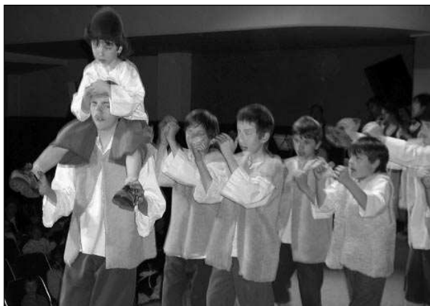
Přehlídka dětských folklorních souborů Prahy a Středočeského kraje se zúčastnil i řevnický Klíček.

ky ve strhujícím tempu a ještě je bylo slyšet přes hlasité povzbuzování dívek. Po vyhlášení výsledků, kde Klíček dostal nabídku zastupo-