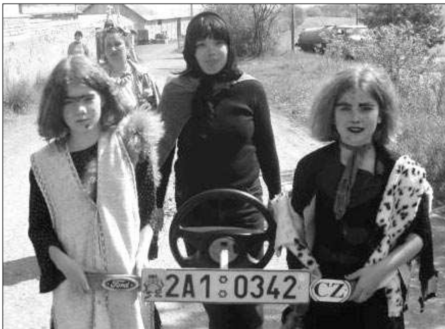
ORIGINÁLNÍ ČARODĚJNICE. Tradiční slet čarodějnic se konal v liteňské škole. Některé z účastnic přiletěly na originálních koštětech se státními poznávacími značkami.

Týž den vyjžděli řevnickí profesionální záchranáři i k domnělému lesnímu požáru mezi Karlštejnem a Srbskem. Hasiči však na místě žádný oheň neobjevili, výjezd skončil jako planý poplach. Jednotka oheň »hledala« od 22.03 do 23.35. (vš)