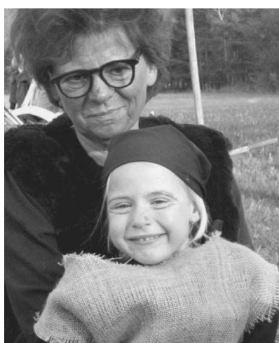
Druhý ročník pochodu čarodějnic uspořádali v Osově. Akce skončila společným opékáním buřtů. (Čarodějnice viz strana 2 a 5)

Tragická dopravní nehoda se ve Všeradicích odehrála v sobotu 7. května večer. Dvaatřicetiletý muž na křižovatce odbočil vlevo, poté ale vjel do protisměru a spadl do příkopu. Při pádu narazil hlavou do betonové patky telefonního sloupu. Na místě byl mrtev. Podle policistů muže mohla při pádu ochránit cyklistická přilba. (pš, Jok)