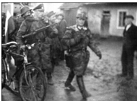
Vlasovci procházejí v prvních květnových dnech Zadní Třebaně na pomoc Praze.

V jednom z posledních dnů přejížděl vojenský vlak z karlíštejnského nádraží do Řevnic. Transportu si všimli ostřelovači, kterým se říkalo kotláři a začali vlak ze všech stran oblétávat. Němci spustili palbu z protiletadlového kulometu. Nikoho nezajímalo, že vedle vlaku po silnici jedou vojenské treny tažené koňmi. Ti se po prvních výstřelech začali plašit. Vojáci se snažili je udržet, ale marně. Výsledek akce: rozstřílená lokomotiva, několik vozů v příkopě a jeden kůň se zlomenou nohou. Letadla ještě párkrát zakroužila a zmizela. Ve velkou tragédii vyústil čin partyzánů, kteří podmiňovali jednokolejovou trať mezi Třebaně a Bělčí asi 200 metrů nad třebským hřbitovem. Lokomotiva táhnoucí převážně osobní vagony byla výbuchem vyhozena z kolejí a padala z vysokého náspu k Bělečskému potoku. Vozy se