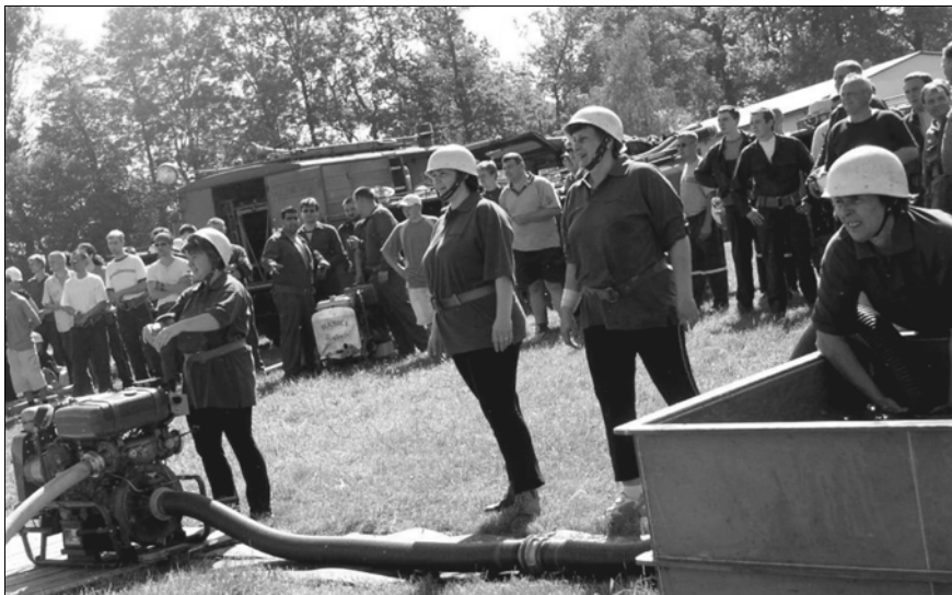
Soutěžní hasičské družstvo osovských žen.