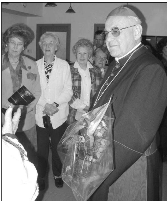
Kardinál Vlk zavítal před pár dny do Černošic.