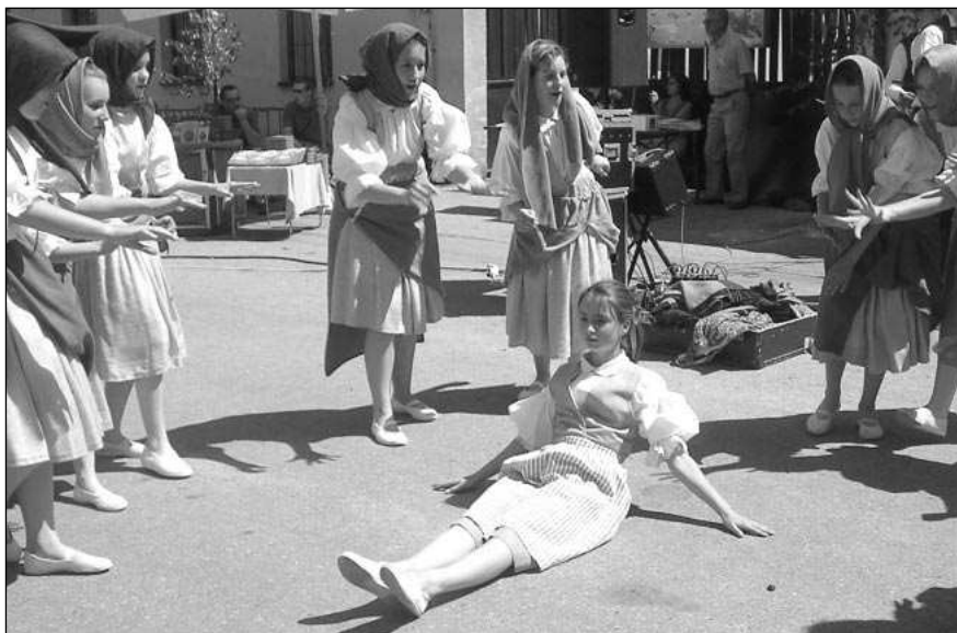
HOSTÉ Z MORAVY. Jediným »přespolním« souborem na májích v Zadní Třebani byl Hradištanek z Uherského Hradiště.