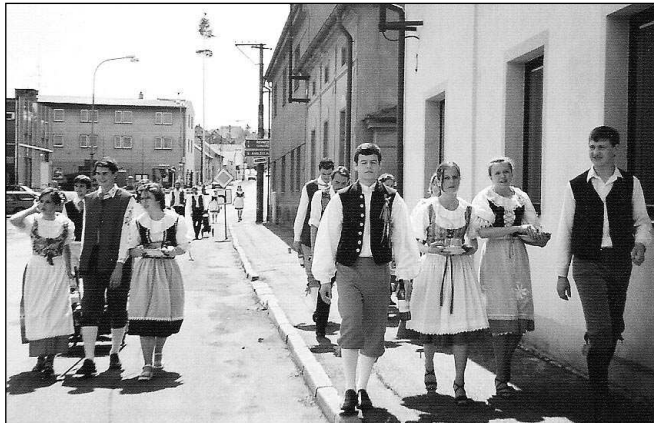
Liteňské máje byly letos v režii mladých.

Kluci se zato zdámě ujali jejího nočního strážení a s blízkým se sobotním ránem už v počtu silně vedli nad dívkami, které přemohla únava. Už od deseti hodin sobotního dopo-