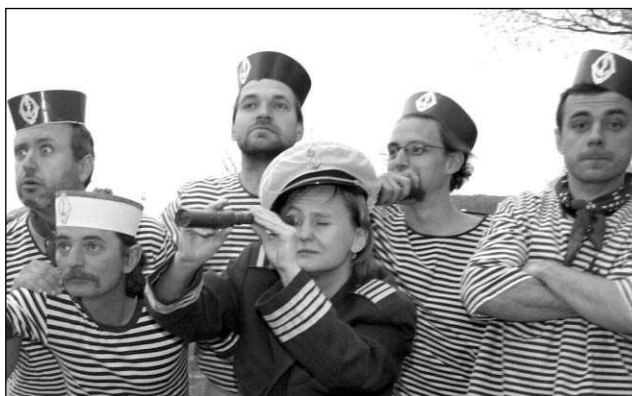
Fotky na obal svého nového CD Ten letovskej most Třehusk fotil přímo »na místě činu« - u letovského mostu.

Koncert se koná v sobotu 16. července odpoledne v areálu svinařského zámku. Již nyní si ale můžete zakoupit vstupenky, k nimž jako bonus získáte první kazetu Třehusku Na tý stráni nad Třebání. Vstup-