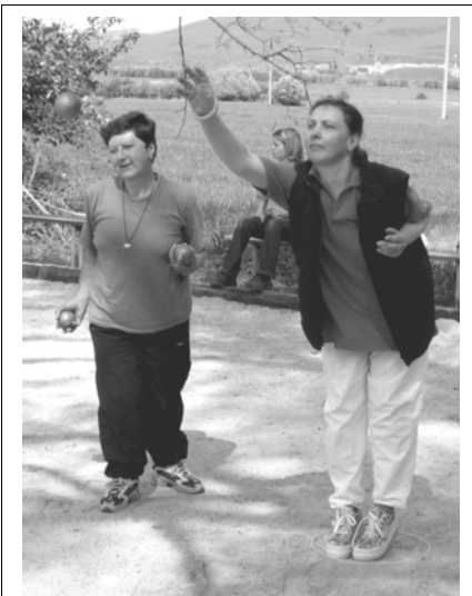
KOULE OPĚT LĚTAJÍ. Každé nedělní dopoledne se opět scházejí příznivci pétanque na svém novém bulodromu (hřiště pro pétanque) u osovské sokolovny.

18. 6. Osov – Vižina, Všeradice - Tetín, Podluhy - Chlumec, Všeradice B - Tetín B, Osov - Vižina