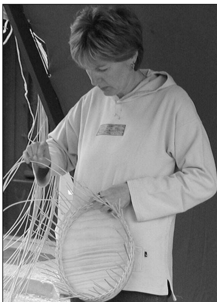
Košíkáři se na řevnické náměstí sjedou 18. června.

„Tentokrát ho doprovodí několik vystoupení sou-