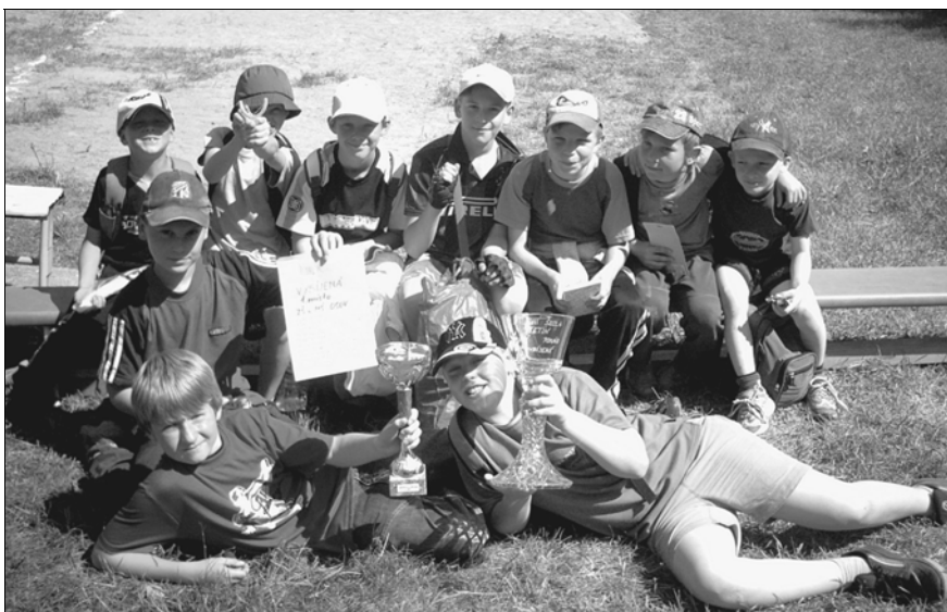
V soutěži ve vybjíjené získali žáci ze ZŠ Osov 1. místo a putovní pohár.