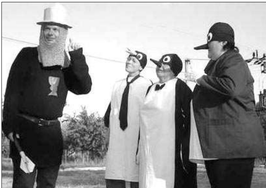
MAŠKARY V LEČI. Na Letních slavnostech v Leči si pokaždě dávají sraz i roztočivé maškary.

jeho okolí 5. a 6. července vždy ve 13 a 16 hodin. Pavla ŠVĚDOVÁ