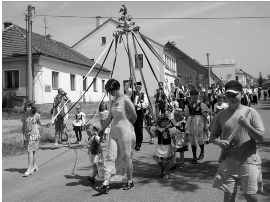
BARÁČNÍCI POCHODOVALI MĚSTEM. Malí i velcí, domácí i přespolní šlapali v průvodu Hostomicemi během oslav 80. let obce baráčnické.