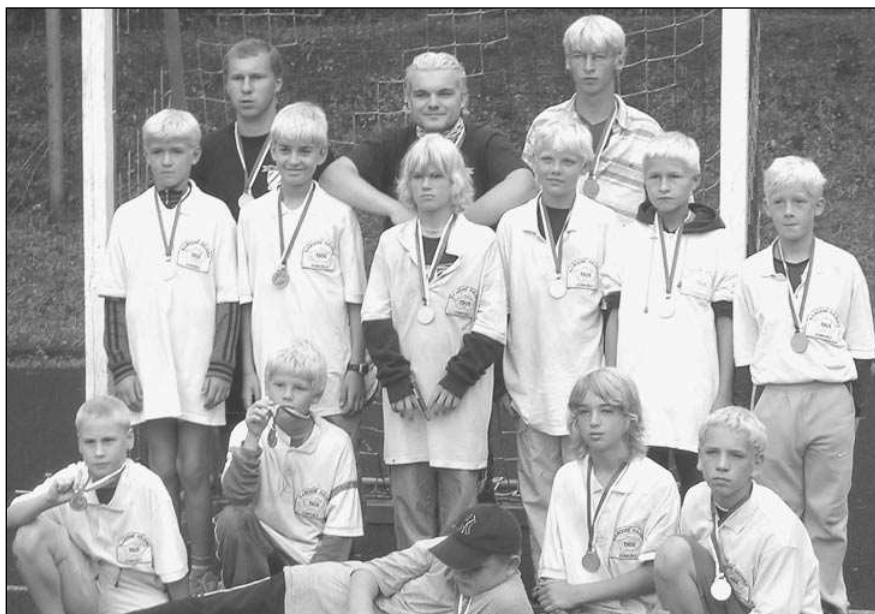
ŽLUTÍ MISTRŮ. Kluci z Dobrušky, vítězové mistrovství republiky mladších žáků v národní házené, které se konalo v Řevnicích, si pro medaile přišli s vlasy obarvenými nažluto.

B-družstvo složené vesměs ze starších hráčů uhrá-