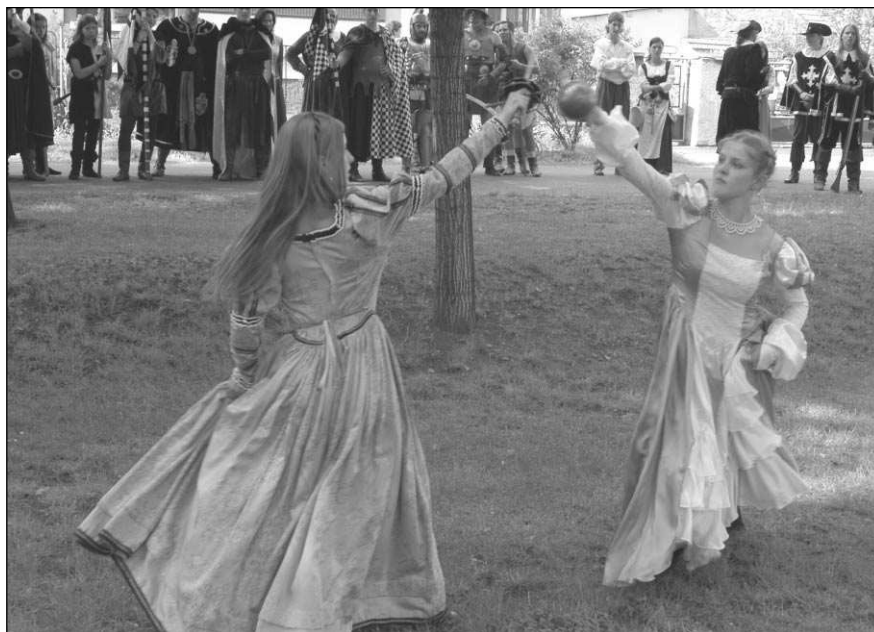
Dámská šermířská skupina Reginleif v akci.