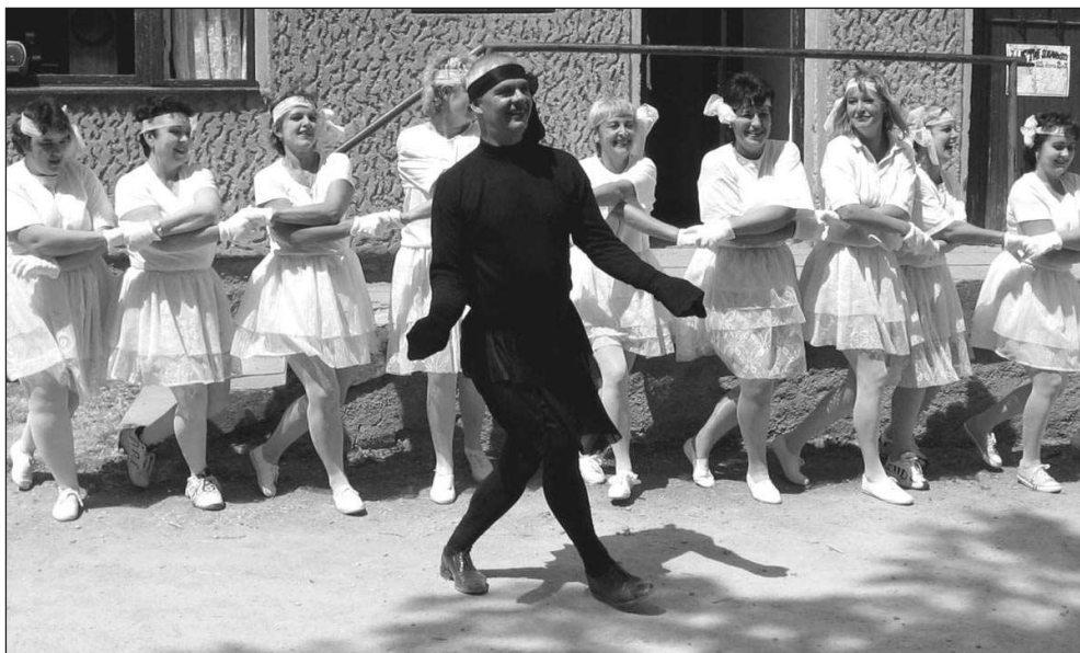
LABUTĚ NA NÁVSI. Letošní Letní slavnosti v Leči otevřel balet Labutí jezero v podání místních »uněličů«.