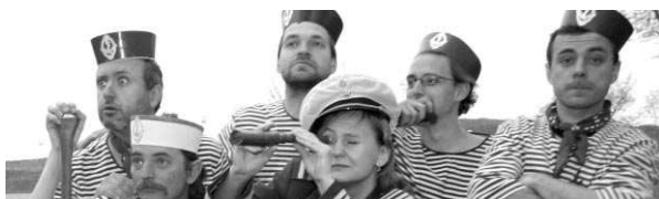
Naše noviny-nezávislý poberounský občasník Vám doporučuji novou, právě pokřtěnou desku poberounské hudební skupiny Třehusk

dle odborníků v zoufalém stavu. Oprava střechy bude komplikovaná, neboť se musí do krovu nejdříve vestavět podpůrný ocelový rám, aby během opravy krovu nebyla zatížena klenba nad lodí kostela. Rekonstrukce se tedy musí z větší části provést najednou, nelze ji rozdělit na více etap. Pavla ŠVĚDOVÁ