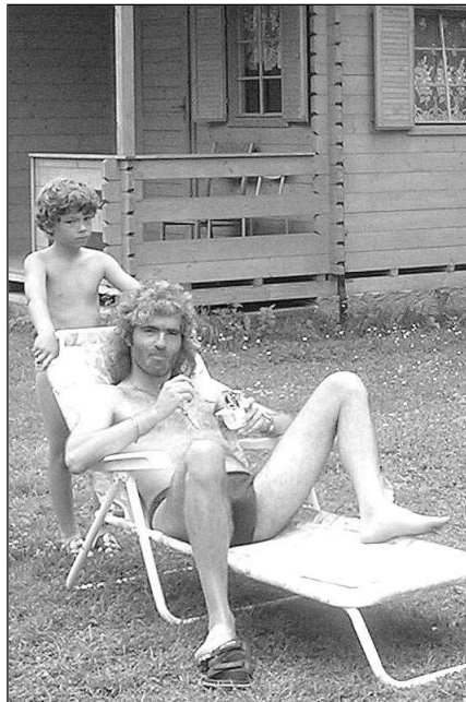
Zatímco starší lidi velká vedra ničí, rekreatanti na zadnotřeboňském Ostrově si sluníčka užívají jak- sepatří.

Ve stejné době přišla na policii mladá žena s tím, že pohřešuje svého třidvacetiletého přítele, který byl zaměstnancem pošty v Berouně. Po hlásnotřeboňském rekreatovi, který byl jedním z podezřelých, bylo vyhlášeno celostátní pátrá- ní. Dopaden byl až 26. 7. 2005 na hraničním přechodu Rozvadov. Muž, který cestoval linko- vým autobusem z Prahy do Paříže, se ke kráde- ži doznal. Uloupené peníze použil pro svoji potřebu, část půjčil. Za krádež mu hrozí trest odnětí svobody od dvou do osmi let. (pš)