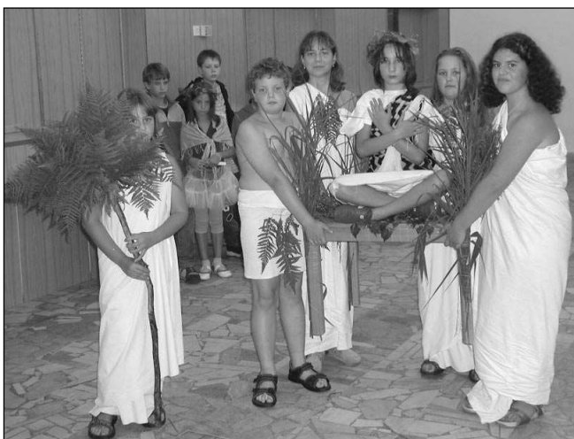
KLÍČEK U FARAONŮ. Soustředěním dětského tanečního souboru Klíček se prolínal příběh ze starého Egypta.

Děti starší pěti let, jež by Klíček také chtěly navštěvovat, mohou přijít 6. října v 16.00 do budovy ZŠ v řevnické Revoluční ulici - soubor nabírá nové členy. Věra HRUBÁ, Řevnice