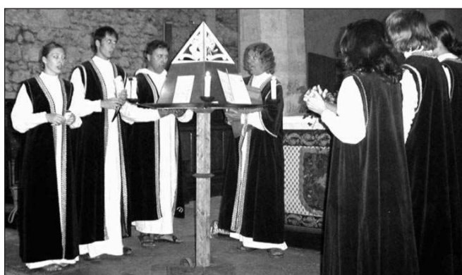
Soubor Ludus musicus sklídl ve Francii velký úspěch.

Francie, Dobřichovice - Koncem srpna se vrátil z jihu Francie soubor Ludus musicus. Byl pozván do města Dourbie na festival Hudební setkání na řece věnovaný duchovní i světské hudbě minulosti. Při festivalu, který se konal od 14. do 21. 8., vystoupilo mnoho předních evropských interpretů. Náš soubor jako jediný měl možnost uvést dva programy. Při prvním zazněl v románské bazilice Švátého Petra z 10. století cyklus zpěvů z Vyšebrodského rukopisu napsaného kolem roku 1410, jednoho z nejstarších pokladů naší hudební kultury. Cyklus byl nazván podle písně rukopisu Hle, již zlatý věk počíná rozkvétat. Pro soubor bylo velice silným zážitkem zpívat tento repertoár v místech, odkud k nám různými cestami tyto zpěvy přišly. Ačkoli šlo o speciální liturgický program, publikum jej soustředěně vyslechlo a počet