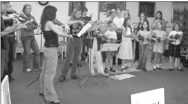
Na letním soustředění Notičky pilně nacvičovaly.

I když bylo soustředění oproti minulým letům o týden kratší, udělaly děti pořádný kus práce. Každý, kdo se přijde podívat, uslyší, že jim to hraje a zpívá náramně. Miroslav KUS