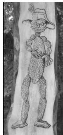
U opuštěné rozhledny hledá nakreslený Fabián – pán Brd.

Zbývalo ten náklad donést k rozhledně, opéci si klobásu, vypít pivo a odpočinout si. Rozhledna byla otevřena v letošním létě naposledy. K podzimnímu spánku jí přišli zahrát hudebníci a podívat se přišli i brdští čundráci. Skončila sezóna pro koukání z věže a začala sezóna pro sběr hub. Martin NĚMEC