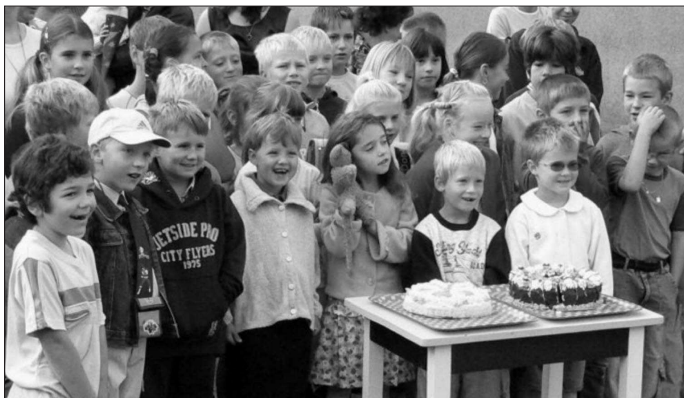
DORT ZE SVINAR. Zadnořebaňští školáci si první zářijový den pochutnali na dortu, který jim poslal majitel svinařského zámku za jejich účast ve výtvarné soutěži.