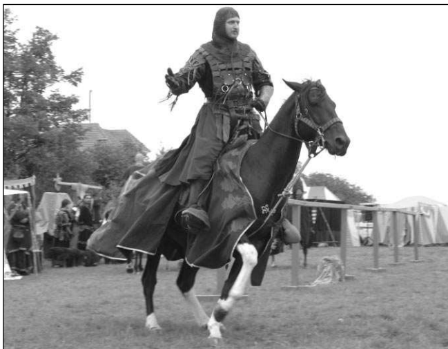
Jezdecké umění na Alotriích předvedla skupina Magentis.

Černošickými alotrii jsem byl příjemně překvapen - tato vpravdě lidová zábava měla solidní úroveň, probíhala v poklidu, prosta obvyklých nešvarů a dokonce jí přálo i počasí. Program, který sledovala bezmála tisícovka diváků, tvořila převážně vystoupení skupin historického šermu. Vrcholem byla dvě představení skupiny Burdýři z Prahy, jedné z nejstarších a nejkvalitnějších skupin v Čechách. První show Piráti je určena mladším divákům, ale bavili se i dospělí. Dynamické představení v kostýmech karibských pirátů připomínalo americké grotesky - spousta gagů, doprovodná hudba s pohybovými etudami... Šerm byl podřízen akčnímu pojetí a představení neztratilo dech od začátku až do konce. Večerní představení Burdýřů nazvané Démon bylo metaforou vítězství kříže nad půlměsícem, či chcete-li křesťanských rytířů nad svody Dáb-