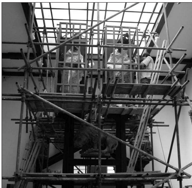
Petr Váňa připravuje sochy k transportu přes oceán.

„Takhle velké sochy se ještě nikdy tak daleko nestěhovaly,“ komentoval jedinečnost transferu Váňa, který se složitější úkolu ujal s kolegou Hynkem Schejbalem. Přeprava je o to komplikovanější, že každá socha měří 2,5 metru a váží tunu. Navíc se jedná o historické originály nedozírné ceny. „Transfer je skutečně složitý,“ přiznává Váňa. „Bylo zapotřebí