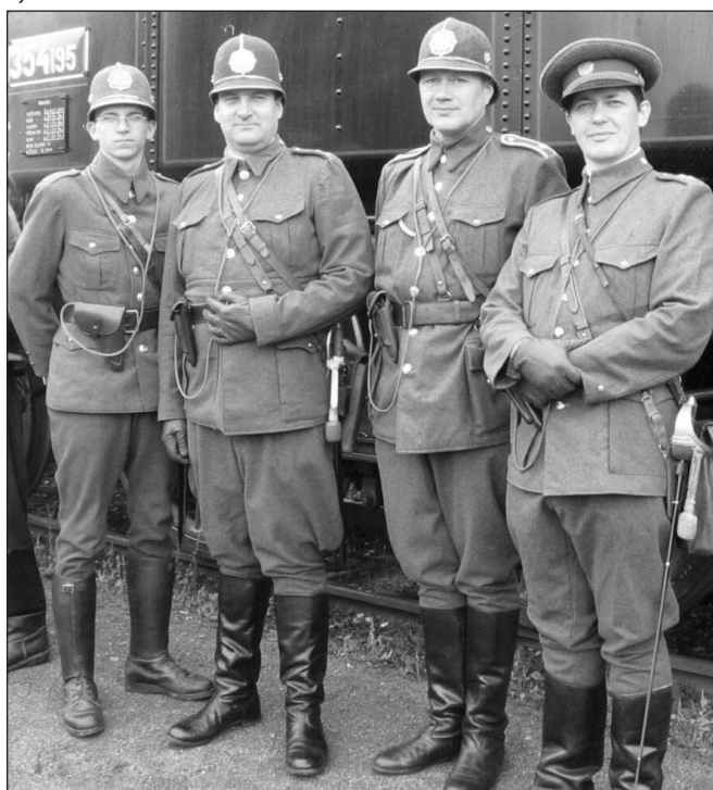
Četnická pátračka, jež asistovala jízdě parního vlaku.