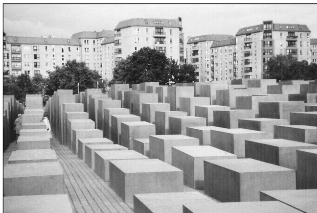
Památník holocaustu v Berlíně.

Naše dosavadní cesty vedly většinou do míst, o nichž se nám dříve ani nesnilo. Zapomněli jsme poněkud na to, že za našimi hranicemi je země našich sousedů, o které toho mnoho nevíme, protože jsme o ní v určité době ani vědět nechtěli. Starší generaci je se jménem Berlín, Hamburg, Brémy spojena vzpomínka na válečné události, na dny, kdy jsme se třáslí strachem o příbuzné a známé, když nad námi přelétaly bombardovací svazy a mířily tam na německá města, v nichž nuceně pracovali lidé nám blízcí. To vše se skončilo a my jsme o tuto zemi ztratili zájem. Konečně se nám ale podařilo překonat dávnou averzi, a tak se jednoho dne rozjel autobus směr Berlín. Znali jsme jeho východní část z éry komunismu, ale nic jsme nevěděli o zbývajících čtvrtích. Dorazili jsme na okraj Berlína a stihli ještě okružní jízdu a prohlídku vnitřního města. Naši zvědavost poutala budova zre-