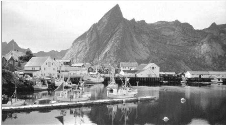
Přístav ve vnitrozemí Švédska.

Újeli jsme 1000 kilometrů a jsme ve Švédsku. Idylka pěkného počasí skončila. Na další cestě přes Stockholm, Úppsalu a dál k severu podle botnického zálivu jedeme stovky kilometrů v dešti. Polovinu dne trvalý déšť s průtrží mračen a teplotou hluboko pod 15 stupni střídá slunečný průsvit a teplota 16 až 20°C. Motocykl vybavený ochranným štítem a dobré oblečení proti chladu a dešti