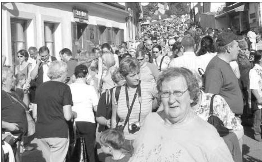
Karlštejnské vinobraní letos zřejmě navštívilo nejvíce lidí v jeho devítileté historii. Zvlášť v sobotu zde byla doslova hlava na hlavě.