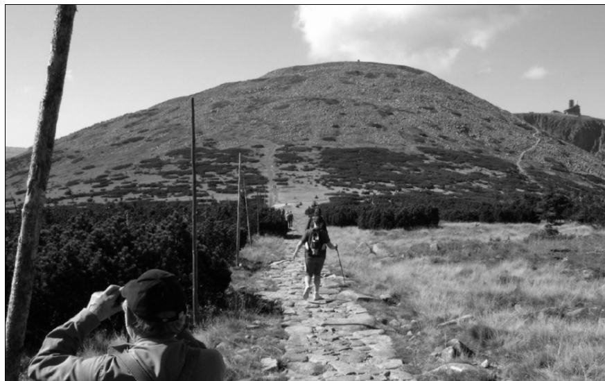
Krkonoše – Vysoké kolo.

poledne jsme vyjeli zpátky domů. Na závěr bych rád poděkoval Rostovi za precizně připravený program našeho soustředění a Krakonošovi za skvělé počasí a úžasné krkonošské výhledy. Dušan ELIÁŠEK