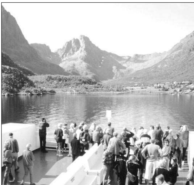
K ostrovům Lofot jsme se dostali trajektem...

Následující den nás čeká poslední 130 kilometrů k Nordkappu. Pod zataženou oblohou, která stále hrozí deštěm, projíždíme studenou sugestivní krajinou. Na ostrov Mageroya se dostáváme 7 kilometrů dlouhým podmořským tunelem, mjíme osadu Honningsvåg a posledních 13 kilometrů jedeme v husté mlze. Konečně po dvanácti dnech cestování a 4000 kilometrech stojíme na Nordkappu, 307 m vysoké skále nejsevernější výspy Evropy. Je zde 8 stupňů Celsia a pro mlhu nic nevidíme. Norové zde vystavěli velkou budovu s kruhovým kinem, několika restauracemi a velkou vyhlídkovou halou, kde najdou návštěvníci útočiště před nepoho-