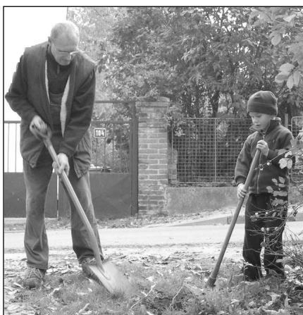
Keře a stromy sázeli Řevničtí na brigádě v parku u Nezabudického potoka, která se konala uplynulou sobotu.

* Dvě auta se srazila 11. 10. za Černošicemi ve směru na Roblín. „Řidiči obou vozů utrpěli zranění - mladou ženu jsme ošetřili na místě a muže odvezli k ošetření do nemocnice v Motole,“ řekl šéf řevnických záchranářů Bořek Bulíček. U nehody zasahovali i hasiči. (šm)