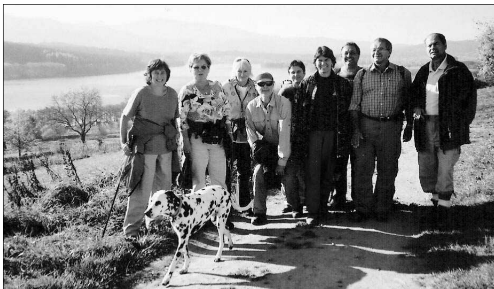
SMĚR PLECHÝ! Část zadnotřebaňské výpravy nad Lipnem. Na obzoru cíl jejího třídenního putování - nejvyšší hora Šumavy, 1378 metrů vysoký Plechý.

Kytlice je malebná obec v Lužických horách. Kromě roubených chalup či hrobu Miroslava Horníčka tu najdete i další atrakci. Pár set metrů za vískou směrem na Českou Kamenici odbočíte ze silnice vpravo do lesa a vyšplháte se k areálu divadla z roku 1931. Po válce zpusťlo; znovu se tu začalo hrát v roce 1990. Skvělou kulisu hercům tvoří skalní masiv, tajemné průchody i dřevěný ohoz. Jen o deset kilometrů jižněji se mohou pochlubit svým »Lesňákem« Sloupští. K amfiteátru z roku 1921 vede červená turistická značka. Hry v lese mezi skalami jsou napínavé zejména pro herce, již se musí prodírat spletitými schodišti a tunely vyhloubenými do skály. Na dřevěném pódiu nechybí ani pískovcová věž či gotická brána. (pš)