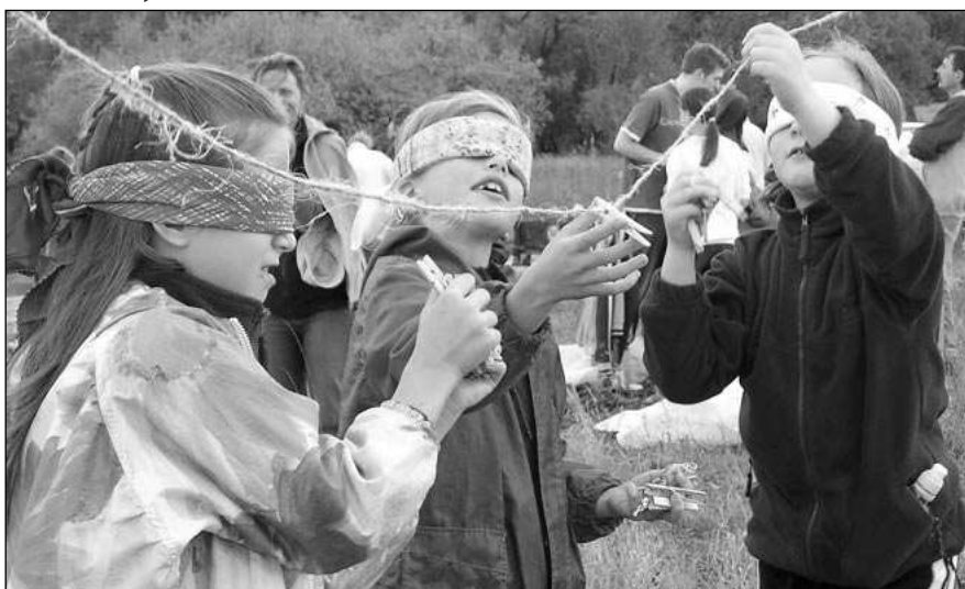
Součástí drakiády byly i různé soutěže pro děti.

Nejoriginálnějším modelem byla vyhlášena černá