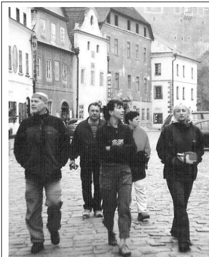
Jubilejní desátou výpravu na Šumavu podnikl v závěru října zadnotřebaňští turisté. Při zpáteční cestě si někteří ještě prohlédli Český Krumlov. (Viz strana 3)

Dobřichovice - Řevnickým policistům se podařilo výjimečný kousek. Zadrželi lupiče-narkomana, který utekl jejich pražským kolegům! Muž vykrádal sklepy dobřichovických paneláků i vozy zaparkované u mstního nádraží.