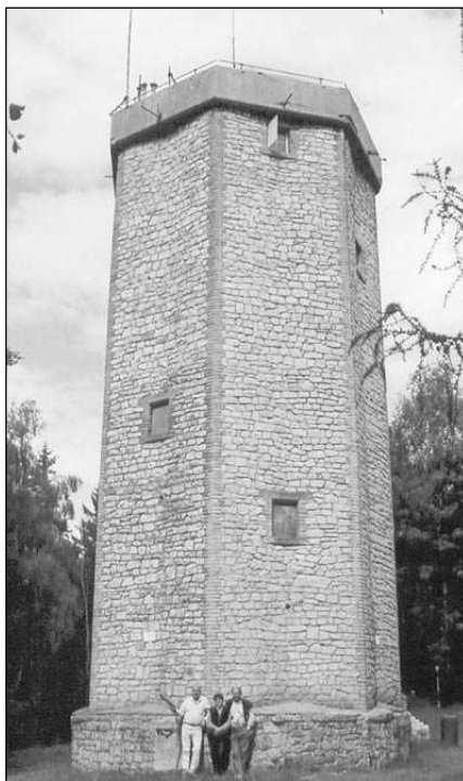
Rozhledna na Studeném vrchu v Brdech.

K rozhledně se nejlépe dostanete ze silnice vedoucí z Dobříše do Hostomic. Když přejedete nejvyšší bod silnice a budete klesat lesem do Hostomic, uvidíte vlevo odbočovat vzhůru rovnou asfaltovou cestu. Tady na rozšířeném prostranství u cesty zaparkujete auto a vydáte se pěšky nahoru. Po kilometru chůze odbočíte na vrcholu stoupání vpravo na lesní cestu, která vás zavede k rozhledně na Studeném vrchu. Nejbližší železniční stanice v Hostomicích je odtud vzdálená asi pět kilometrů. Přesto, že věž nepřevyšuje okolní stromy a není z okolí ani vidět, poskytuje překvapivě daleký výhled do kraje. Vystoupíte-li po 81 schodech na vyhlídkový ohoz, uvidíte před sebou od severozápadu k severu se rozprostírající hlubokými lesy pokrytou Křivoklátskou vrchovinu, kde vyniká kopec Velíz s kaplí a vpravo od něj Krušná hora. Bude-li dobrá viditelnost, spatříte na obzoru tímto směrem i hřeben Krušných hor, přičemž nej-