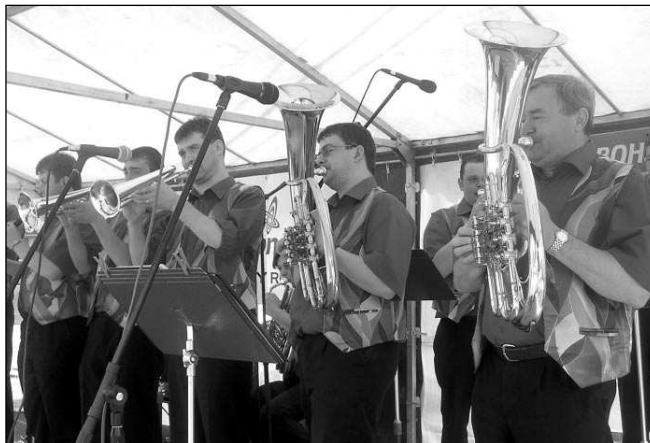
Na Martinském posvícení v Letech zahraje originální jihočeská dechovka Šumavanka z Němčic.

Večer se v místním hostinci bude konat posvicenská tancovačka, na níž zahraje kapela Optimic. „Škoda, že na stejný termín vyšla i baráž našich fotbalistů proti Norsku,“ říká Hudeček a všem fanouškům vzkazuje: Stav utkání budeme průběžně sledovat i na zábavě. Pavla ŠVÉDOVÁ