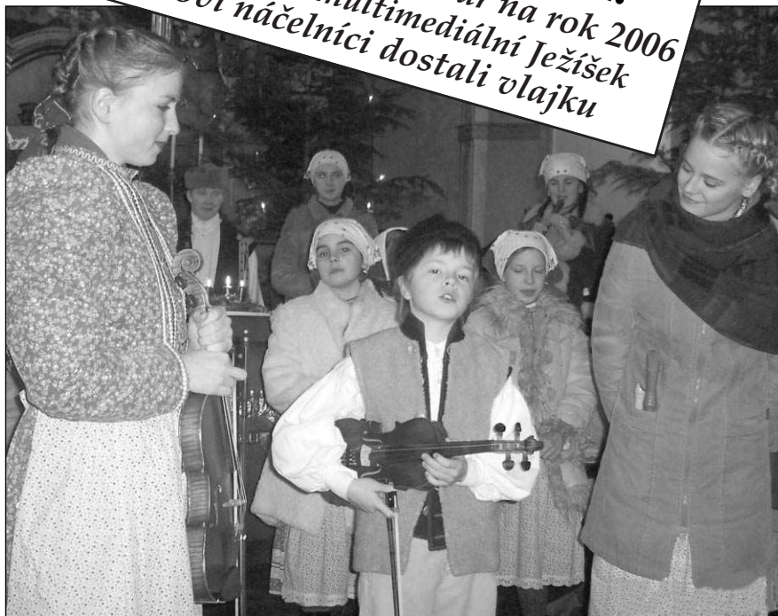
A JSOU TU VÁNOCE! Mnoho vánočních akcí se tyto dny koná v celém dolním Pobeurouní. Dětský soubor Notičky koledoval uplynulou neděli v řevnickém kostele.

Zatímco vloni se v našem kraji odehrálo na 500 zločinů, letos je podle Lazara toto číslo až o 130 nižší. „Samozřejmě je to dobře, jsme rádi. Letošní rok byl pro nás úspěšný,“ pochvaluje si Lazar. Podle něj se policistům vydařil začátek roku, kdy dopadli několik pobertů. „Tím, že jsou za mřížemi, klesl počet krádeží, vloupání a počet poškozených,“ tvrdí. V bývalém okrese Praha-západ se letos stalo pět vražd, v dolním Pobeurouní nebyla spáchána žádná. „Ovšem není vražda jako vražda. V některých případech se třeba jedná o vyřizování účtů mezi zločinci,“ dodal Lazar. (pš)