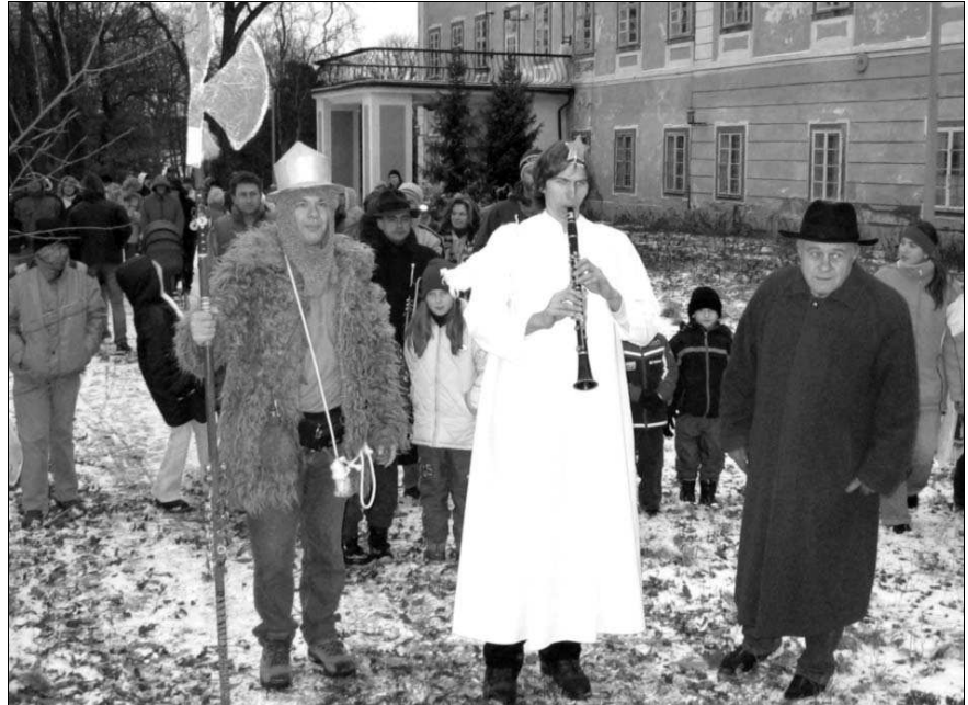
KOLEDY U ZÁMKU. Na symbolickou cestu do Betléma vyrazili Osovští po tradičním zpívání u stromečku v zámecké zahradě tuto sobotu.

Ovšem údaj v samém úvodu nebyl přesný. Číslo 205 pochází z posledního sčítání, v současnosti je o 10 vyšší, tudíž Vižina má 215 trvale žijících obyvatel. Obecní zastupitelstvo přeje všem krásné prožití Vánoc a hodně štěstí a zdraví do nového roku. Děti do 15 let se mohou těšit na vánoční ovocný balíček. (jf)