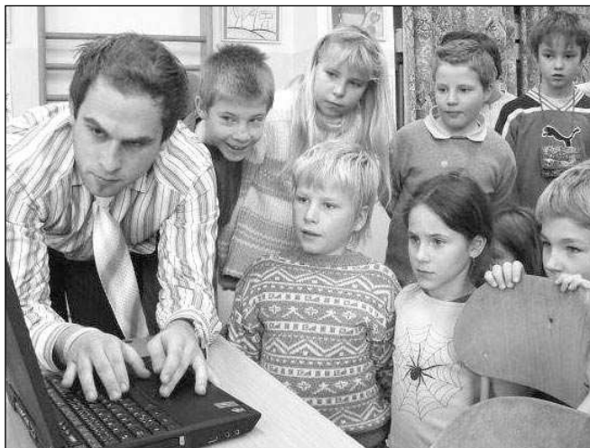
Děti sledují programy multimediálního »Ježíška«.

chom rádi měli i v naší moderní počítačové učebně. Pán měl i programy pro výuku jazyků i některé zábavné tituly. Program Einstein-junior nám ani nechťel pustit. Říkal, že to jsou dost těžké kvízové otázky pro starší žáky. Ale přemluvili jsme ho a on se divil, jak nám šly odpovědi. Podívali jsme se na paní učitelku a bylo nám jasné, že některé programy najdeme brzy ve školních počítačích. Máme z toho radost a pán s notebookem také. Jeden program věnoval škole dokonce zdarma - byl to tedy opravdový multimediální Ježíšek. Už se moc těšíme, jak se budeme strefovat do matematických terčů a soutěžit s indiány ve vyjmenovaných slovech. S využitím dětských prací Petr MUSIL