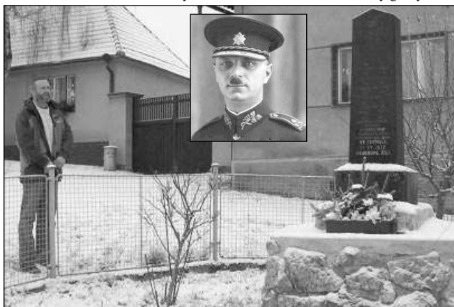
Pomník na návsi v Bělčí. Ve výřezu generál Homola.

cem 30. let byl v hodnosti divizního generála jmenován velitelem VII. armádního sboru v Banské Bystrici.