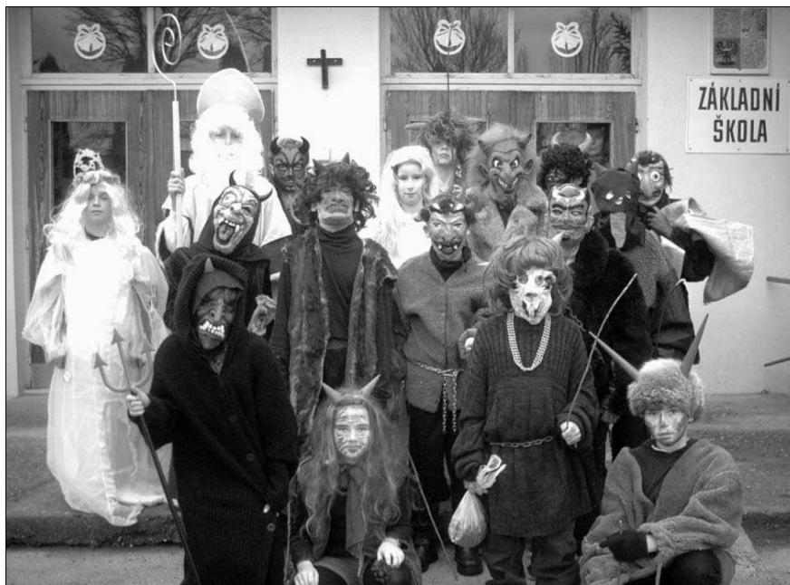
V osovské škole byla letos převaha čertů.