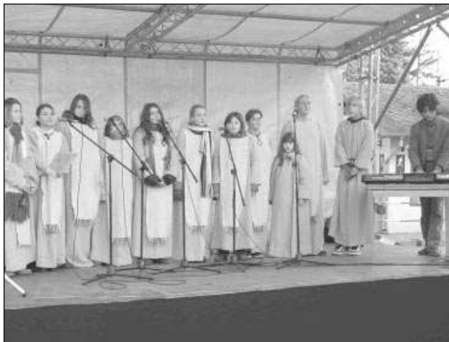
VÁNOČNÍ NÁLADA. Sváteční atmosféry si v závěru roku užívalo celé Poberouní. Na černošických adventních trzích vystoupil soubor Chorus Angelus (vlevo), v Letech na návsi děti z mateřské školy zpívaly koledy a rozdávaly si dárky.