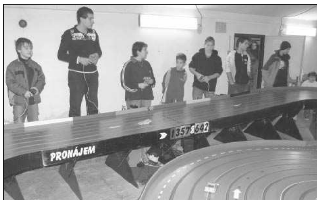
ZÁVODNÍCI. Část účastníků předsilvestrovského závodu na osmiproudé autodráze v Litni.