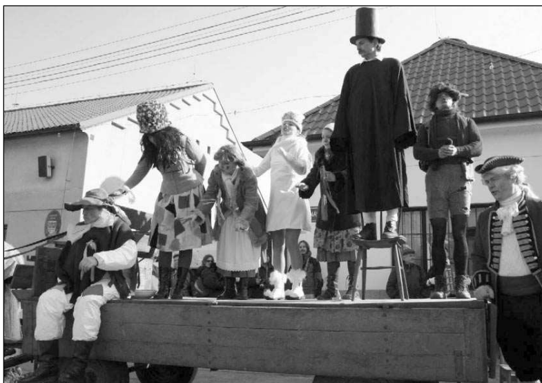
Také letos se bude na zadnotřebské návsi hrát masopustní fraška.

Zpět do Zadní Třebaně se vlak vrátí okolo 17. hodiny. Přibližně o hodinu později