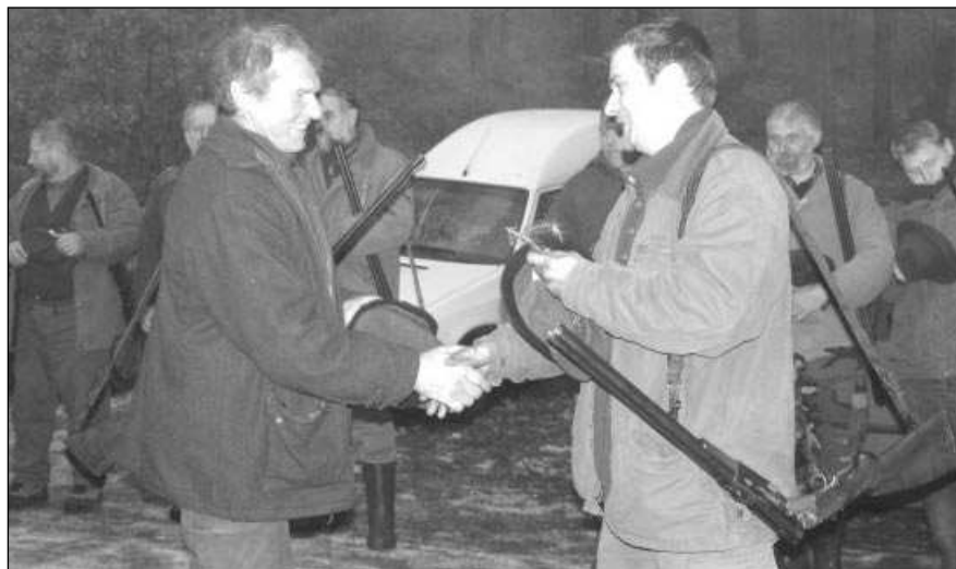
Řevničtí myslivci při předsilvestrovském honu.

* Zásoby na silvestrovské oslavy zřejmě nestačily neznámému zloději, který se poslední noc roku 2006 vloupal do restaurace v Drahlovicích. Ukradl láhev rumu i vodky a pár sušenek. „Na poškozování a odcizených věcech je škoda 3 789 Kč“, řekla mluvčí karlístejných policistů Hedvika Kaslová. (pš, šm)