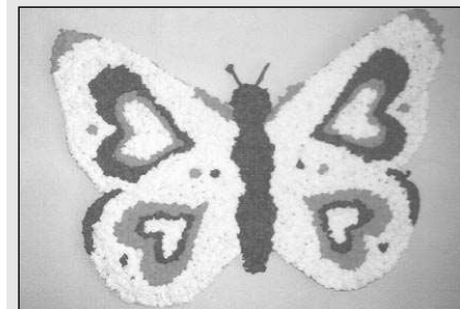
Motýl české národní hrdosti, jehož Naše noviny a Třebusk dostaly od obyvatel dobřichovického Domova důchodců.

Dobřichovice, Zadní Třeban - Nečekaného ocenění se dostalo redakci Našich novin a hudební skupině Třebusk. Od obyvatel Domova důchodců v Dobřichovicích obdržely »Motýla naší národní hrdosti«. Poděkování s fotografií uháčkovaného motýla v českých národních barvách NN a Třebusk dostaly »za dlouholetou a vytrvalou činnost v oblasti našich národních tradic«. Ocenění si velmi vážíme a upřímně za ně děkujeme.