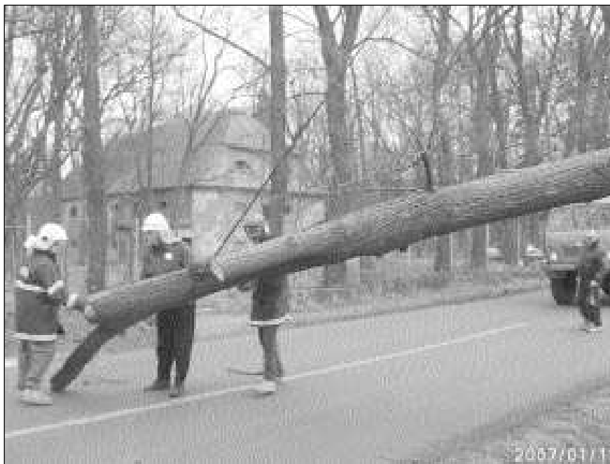
Ve čtvrtek 19. ledna museli osovští hasiči zprájezdniť silnici vedoucí kolem zámeckého parku.

Výroční valná hromada Sboru dobrovolných hasičů Vižina se pro všechny členy a příznivce uskuteční v pátek 26. ledna od 18 hodin v Europajzlu. Občerstvení zajištěno. (jf)