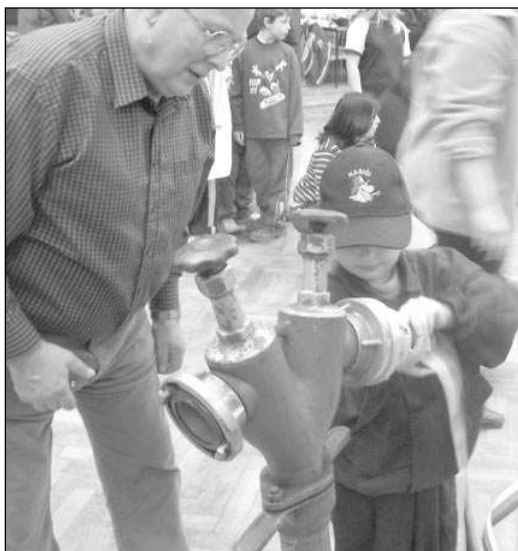
V Zadní Třebani v polovině ledna změřili síly mladí hasiči z berounského okresu.

Hodinu po poledni se uskutečnilo slavnostní vyhlášení výsledků a oceňování soutěžních družstev. Každý tým