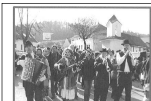
MASOPUSTNÍ VLÁČEK - 25. 2. 2006 Zadní Třebaň - Lochovice

Naše noviny a Videostudio Pátek vám nabízejí DVD i VHS