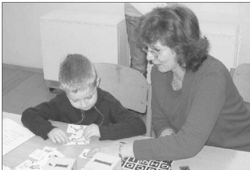
Jedno z řevnických dětí u zápisu do první třídy.

* Do chaty v Hlásné Třebaně se vloupal neznámý zloděj. Protože ho v chatě nic nezaujalo, zamířil do garáže. „Tady stálo auto, z něhož byla vyndána baterie, kterou lupič do vozu namontoval. Naložil ještě elektrickou sekačku i další nářadí a odjel,“ řekla NN mluvčí karlsštejských policistů Hedvika Kaslová. Vůz Škoda 105 S bílé barvy s SPZ ACM 62-34 je stále pohřešován. (šm)