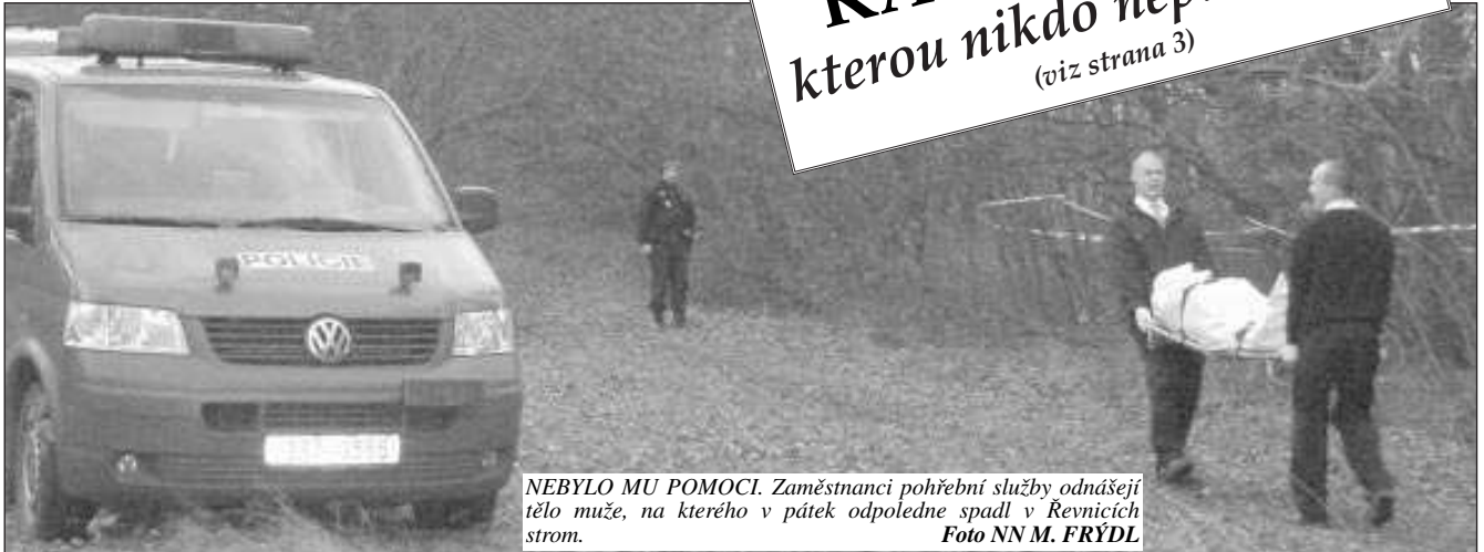
NEBYLO MU POMOCI. Zaměstnanci pohřební služby odnášejí tělo muže, na kterého v pátek odpoledne spadl v Řevnicích strom.

KATASTROFA, kterou nikdo nepamatuje! (viz strana 3)