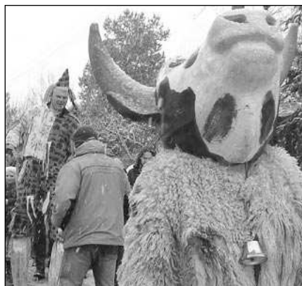
Nejroztodivnější maskary se také letos vydají do masopustních průvodů.

Druhou únorovou sobotu - 10. 2. - se masopust bude slavit ve Svinařích. Několikahodinový průvod maskar začne ve 14.00 před zdejším hospodou U lípy. Do kroku bude vyhrávat Třehusk. Ještě před tím si ovšem Svinařští jako každý rok na návsi pochutnají na zabijačkových dobrotách. V sobotu 17. února se masopusty konají hned dva