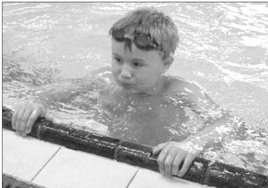
Většina zadnotřebaňských dětí se do berounského bazénu těší. Některé ovšem z plaveckého výcviku žádnou velkou radost nemají.

„Bohužel po příjezdu lékař konstatoval smrt, příčinu šetří policie,“ sdělil šéf záchranky Bořek Bulíček. Žena žila v domě sama, takže policie nyní zjišťuje, zda se jednalo o sebevraždu. (lup)