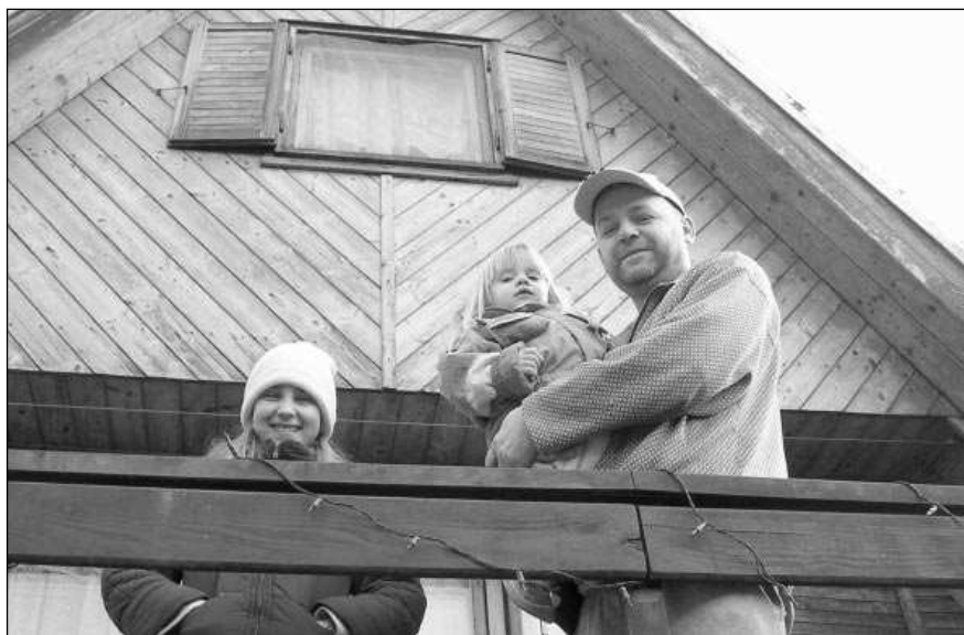
Görnerovi ze Zadní Třebaně patří k těm mladým rodinám, které si rekreační chatu přizpůsobily k trvalému bydlení.

V sousedních Dobřichovicích bylo před šesti lety 2800 lidí, k 31. 1. 2006 už 3028. I díky tomu se mohly loni na podzim Dobřichovice stát městem. Černošice, v roce 2006 město se 4675 obyvateli, loni už přesáhly 5300. Na Vráži vyrostlo šestnáct bytů, nyní se zde staví dalších patnáct nadstandardních bytů a nebytové prostory pro obchody, ordinace, kavárnu... „Za posledních 150 let je to největší soukromá investice u nás,“ uvedl vedoucí stavebního úřadu Vladimír Voldřich. Další 25 bytů buduje soukromý investor v Černošicích v bývalém objektu hotelu na břehu řeky Berounky. Naopak mezi obce, kde se počet obyvatel nezvyšuje patří Karlštejn a Řevnice. Starosta Karlštejna Miroslav Uřeš ale věří, že se situace změní, jakmile bude v obci zahájena bytová výstavba. První muž Karlštejna požádal Státní pozemkový fond o to, aby bezúplatně převédl pozemky u silnice k Litni na obec Karlštejn. „Nechceme, aby parcely získal překupník,“ uvedl Uřeš. Věří, že se podaří