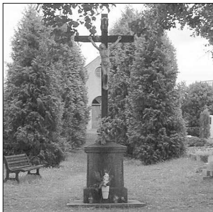
Pod tímto křížem na místním hřbitově se zraje března sejdou obyvatelé Mníšku se svými radními.