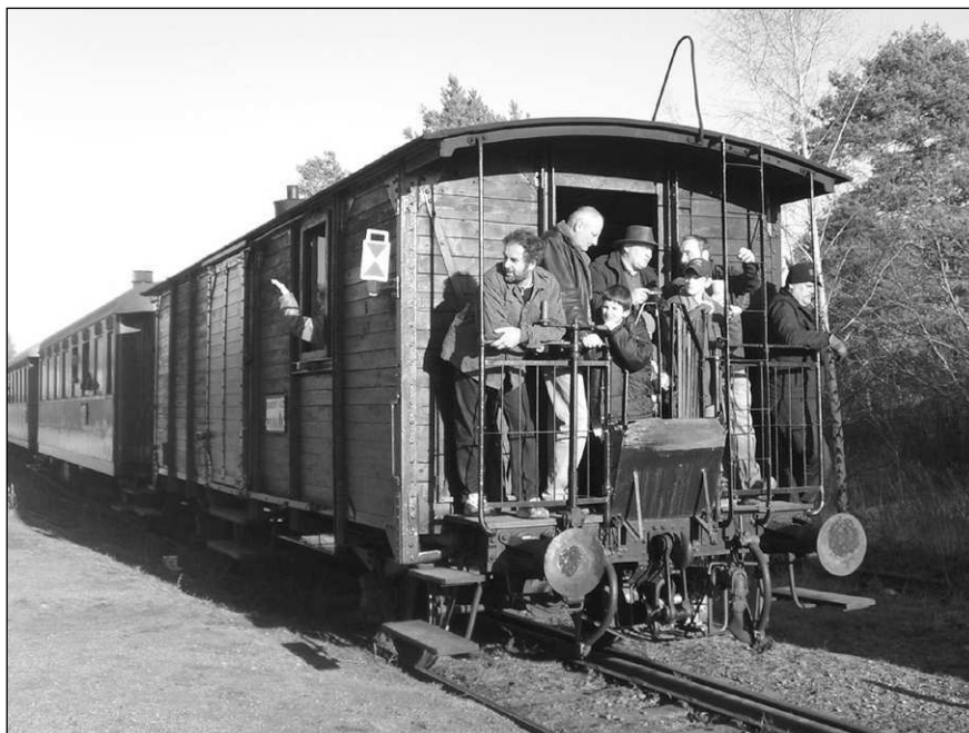
Masopustní parní vlak odváží masopust i z Osova.