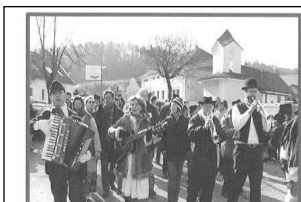
MASOPUSTNÍ VLÁČEK - 25. 2. 2006 Zadní Třebaně - Lochovice

Naše noviny a Videostudio Pátek vám nabízejí DVD i VHS