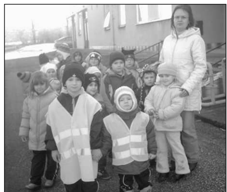
Na vycházkách s oranžovými vestami budou děti určitě lépe vidět.

"Vesty nosí děti z první řady a z té poslední. Bezpečností doplněk se dětem zalíbil natolik, že se v nošení postupně střídají. Pojišťovna vesty dodá i do naší základní škol. Než se tak stane, do nižších ročníků školy jsme dvě vesty zapůjčili," dodává Lenka Kocourová. (rk)