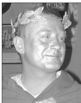
Na mníšecký bál ve spolek si přišly zařadit rozličné maškary.

Do mníšeckého sálu restaurace Sokolovna se přišly pobavit nápadité masky - odvážná školačka, ježibaba, anděl, kostlivec, komtesa, tank, indiáni, kovboj, hollywoodská hvězda či víla. Mnohé masky byly zpracovány do nejmenších detailů, některé budily i hrůzu. Tancovalo se pod taktovkou Dynamic Bandu Karla Ciháka. Rozličné masky a maškary si rádně zabláznily na parketu a dobře se bavily i při odvážných rorejsích