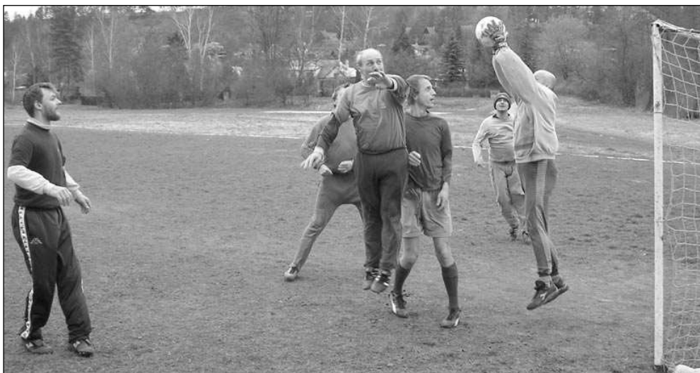
SEZONA JIM NIKDY NEKONČÍ. Registrovaným fotbalistům začíná jarní část sezony. Řevniční »pláckaři« se ke svým zápasům scházejí neděli co neděli bez ohledu na roční období.