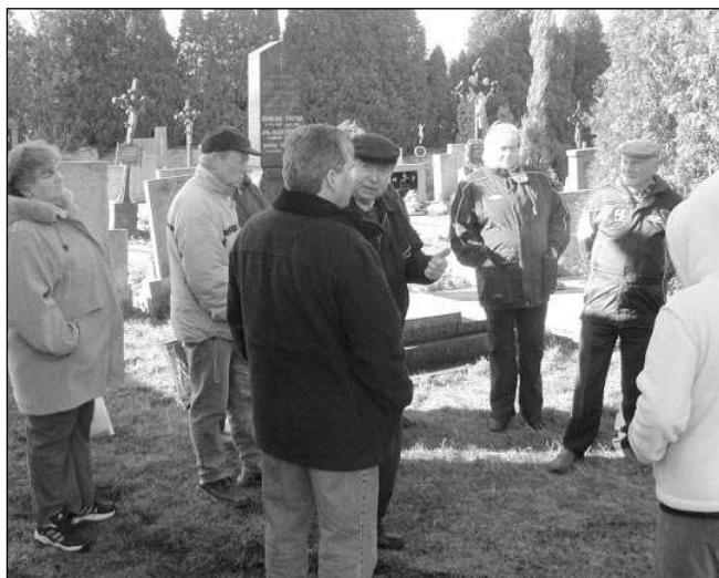
BESEDA NA HRBITOVĚ. Hned dvě setkání s občany na hrbitově uspořádala před několika dny mnišská radnice. Starosta a radní s lidmi diskutovali hlavně o kácení tují na hrbitově.