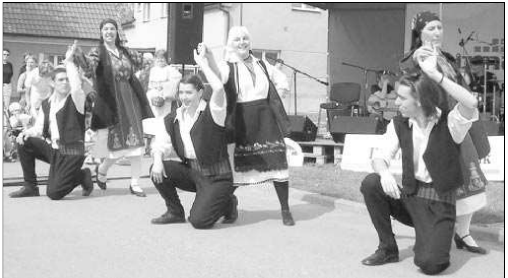
ŘEKOVÉ. Velké ovace diváků sklídl na Staročeských májích řecký soubor Akropolis. Vloni se představil v Letech, letos ho uvidí diváci na mníšeckém náměstí.

Maraton folklorních vystoupení odstartuje první květnovou sobotu na návsi v Letech. Po dopoledním koncertu originálních dechovek Seucoucká muzika ze Skutče a Křídlovanka z Čáslavi, se na prostranství před obecním úřadem vystřídají soubory Mikeš, Rokytička, Jiskra, Krušpánek, Kyčera, Malé Notičky, Domažlická dudácká muzika a Trehusk. Samozřejmě nebude chybět pobožnost,