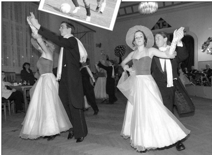
NA PLESE. Letošní plesová sezona zvolna spěje ke svému závěru. Uplynulou sobotu pořádal tradiční bál dětské folklorní soubor Klíček z Řevnice. (Viz strana 2)

Hlásná Třebaň - Škodu dva miliony korun způsobil požár domu v Hlásné Třebani, který zde vypukl v neděli 4. března večer. K ohni vyjeli řevničtí profesionální hasiči krátce po osmé hodině večer, pomáhali jim i dobrovolné jednotky z Hlásné Třebané a Karlštejna. Po příjezdu na místo byla už velká část objektu v plamenech. Majitelé doma nebyli, nikdo při zásahu nebyl zraněn. Možnou příčinou vzniku požáru mohla být podle odborníků závadná elektroinstalace, případně zkrat. (pš)