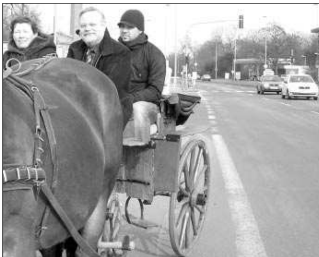
SVEZL SE I SENÁTOR. Trasu královského průvodu si před několika dny projeli pořadatelé. Posezení na kozlíku si vyzkoušel i senátor Jiří Oberfalzer, který koňské spřežení dojel na Strakonické silnici.

Průvod v čele s císařem vyrazí v pátek 1. června z Pražského hradu. Přes Malou Stranu a Karlův most se přesune na Staroměstské náměstí, kde jej pozdraví starosta Prahy 1. Další trasa povede zpět na levý břeh Vltavy, na Smíchov. Přes Chuchlí, Radošín a Černošice dorazí zhruba padesát jezdců na koních a další desítky účastníků v povozech do