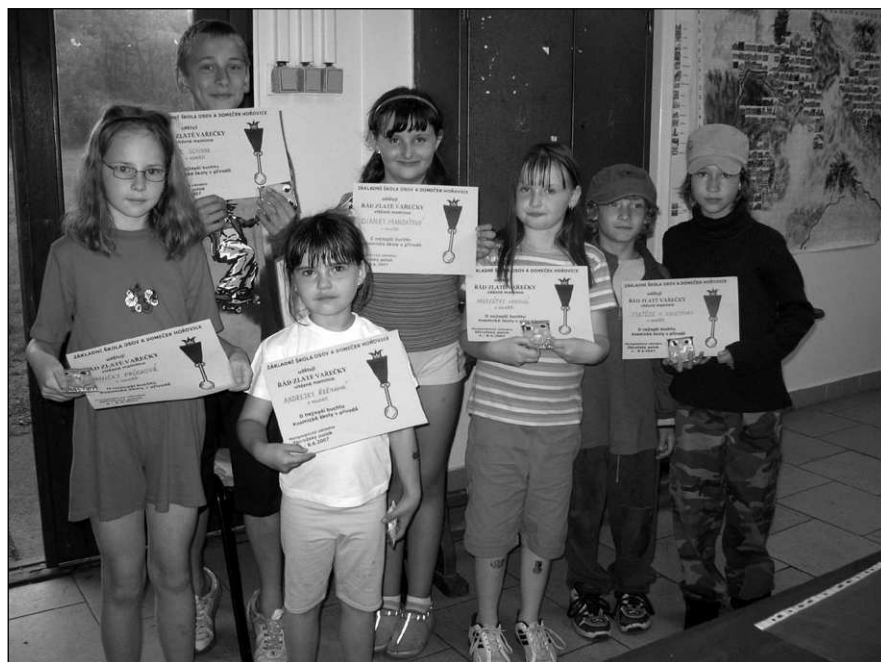
Diplom na škole v přírodě mohly získat i maminky, které sem poslaly nejuchutnější koláč.

Obec Vížina pamatuje i na nejmenší obyvatele. Vítání nových občánků se koná v sobodu 26. června. (rk)