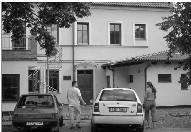
Modrý domeček v Řevnicích.

Žehlírna a kopírovací služby budou otevřeny od pondělí do pátku, kavárna i v sobotu a neděli. Přesnou pra-