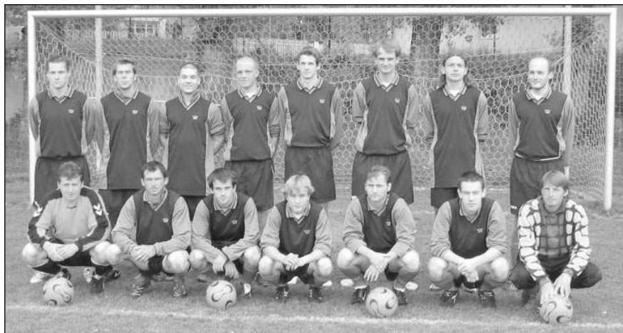
PŘEBORNÍK OKRESU. Tým FK Lety - vítěz fotbalového přeboru Praha-západ.