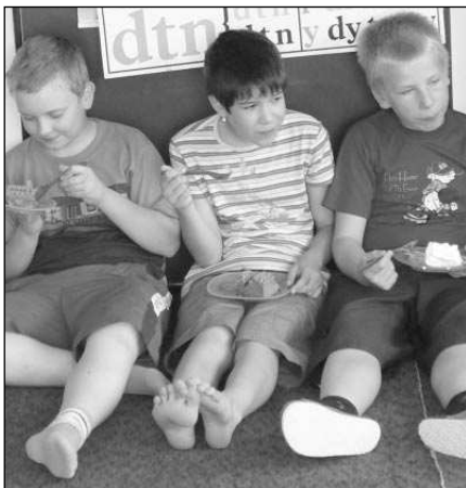
SLADKÁ ODMĚNA Za nacvičování besedy na Staročeské máje dostaly děti v zadnotřebaňské družině nanukový dort.

Zkrátka, obvyčejné plastové hřiště s jednou klouzačkou, dvěma houpačkami a pořádným pískovištěm by udělalo větší službu, než všechny zamýšlené architektonické skvosty, kterých se už naše děti stejně nedočkají. Dětské hřiště Řevnice ale opravdu potřebují. A rychle, děti totiž rostou a nové se stále rodí. Alice ZAVADILOVÁ, Řevnice