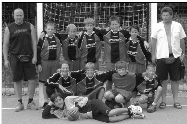
BRONZOVÍ HÁZENKÁŘI. Řevničtí mladší žáci, kteří na mistrovství republiky v Brně vybojovali bronzové medaile.

Co dodat závěrem? Děkujeme městu Řevnice i Naším novinám za upomínkové předměty, kterým jsme mohli věnovat soupeřům. Petr HOLÝ