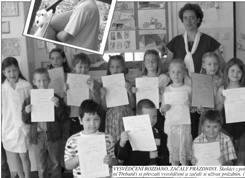
VYSVĚDČENÍ ROZDÁNO, ZAČALY PRÁZDNINY. Školáci z poberounských obcí (na snímku děti ze Zadní Třebaně) si převzali vysvědčení a začali si užívat prázdnin. (Viz strana 3)