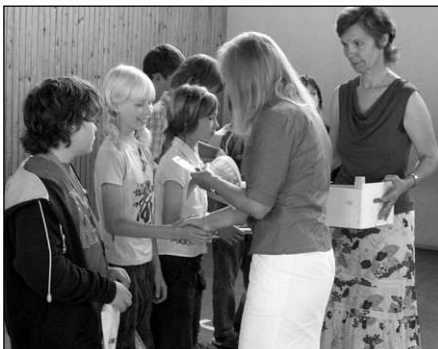
Na závěr slavnostního ukončení školního roku Základní školy Osov se všichni rozloučili s pákou třídu.

Nezbývalo už jen rozdat vysvědčení, popřát si krásné a slunečné prázdniny bez šrámů a těšit se na setkání zase v září. (sk)