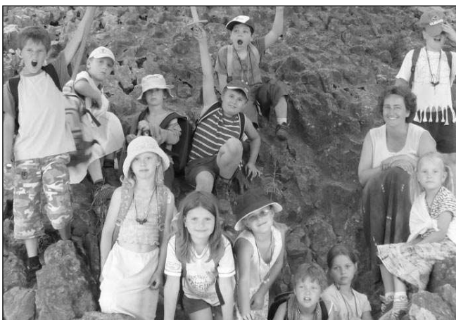
Třebaňští školáci při výletě na Karlštejn.