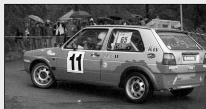
Závod rychlých aut Erzetka Cup 2007 se konal předminulou sobotu v okolí obcí Zadní Třeň a Svinaře. (Viz strana 10)