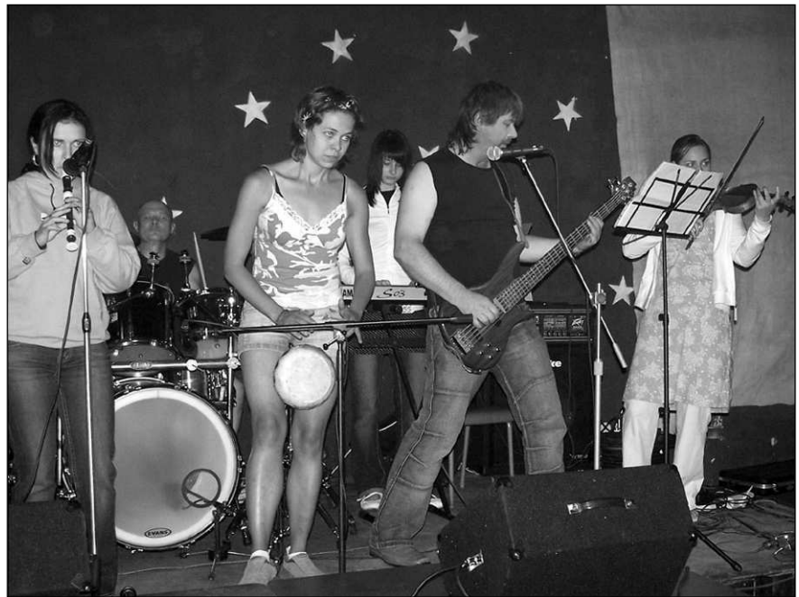
Překvapením Osovského hudebního festivalu bylo vystoupení skupiny Silencium a Scream.

KONCERT SKUPIN BRABOUX - SILENCIUM - SCREAM Se koná ve středu 24. července 2007 od 20:00 hod. V BARU "ZÁLOŽNA" HOSTOMICE