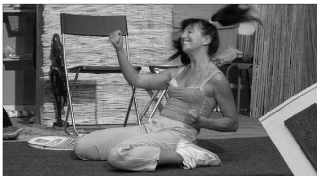
Úsměvné léto v Lesním divadle v Řevnicích.