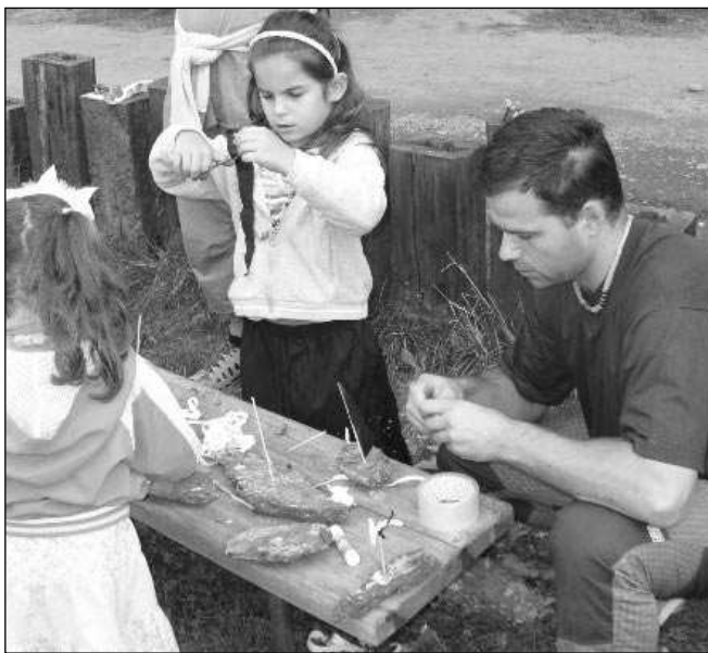
LOUČENÍ. Ještě než děti nastoupily do školy, měly v Zadní Třebani možnost rozloučit se společně s prázdninami

„Na změny, které přináší školská reforma, jsme se už těšili. Směřujeme totiž k podobnému cíli řadu let, takže máme významný náskok,“ říká Musilová. Málotřídka je mezi školami specifická, její výhodou je menší počet dětí než v klasických školách a spojení různých starých dětí, které se ve škole naučí spolupracovat. V trebské škole už řadu let funguje doplnění výuky praktickým poznáním, děti často chodí do přírody, navštěvují muzea, galerie nebo keramické