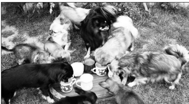
Čivový čaj o páté v chovatelské stanici Z Třebaňského údolí.

Nejen na burčák a víno z místních vinic se mohou těšit návštěvníci Karlštejnského vinobraní. V sobotu i v neděli na ně po celé Zlaté stezce k hradu i na nádvoří čekají vystoupení šermířů, tanečníků, stylových kapel, kejklířů či fakířů. Oba dny se ve 13.30 vydá od vinařské stanice historický průvod v čele s Karlem IV., který projde městysem. (mif)