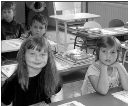
Osovská škola slavnostně přivítala sedmnáct prvňáčků.

To se jim nepodařilo. Do restaurace se nakonec dostali oknem po vypáčení mříže a rozbití skla. Pachatele zajímaly pouze cigarety a alkohol. Někdo je asi vyrušil, protože elektronika nebyla odcizena. (hoš)