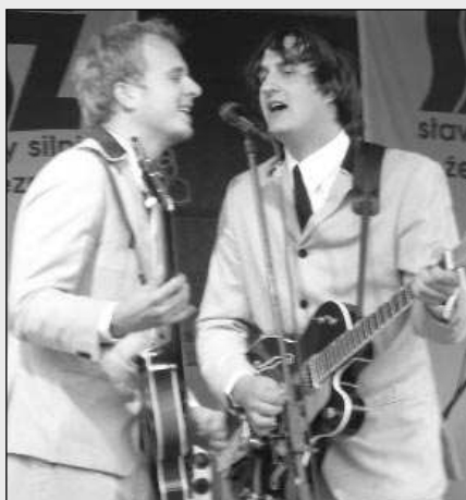
BROUCI. Festival Cesty se na závěr prázdnin konal v Řevnicích. Zahrála na něm také kapela Brouci band. (Viz str. 4)