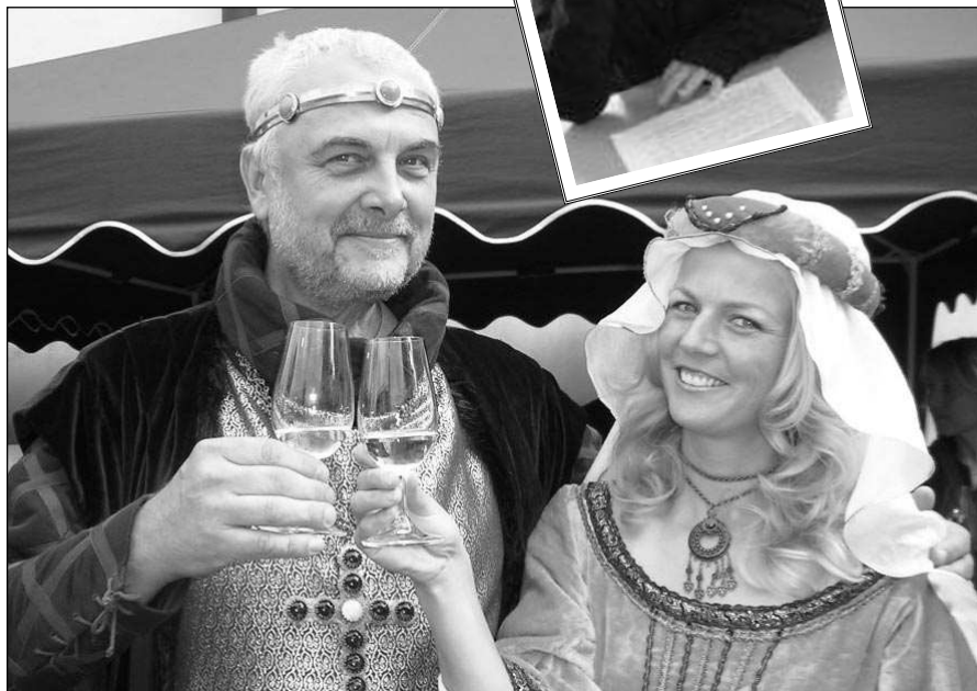
CÍSAŘSKÝ PÁR. Dobříchovické Vinařské slavnosti, které se konaly první zářijovou sobotu v areálu místního zámku, navštívil také císař Karel IV. s chotí Eliškou. (Viz strana 3)