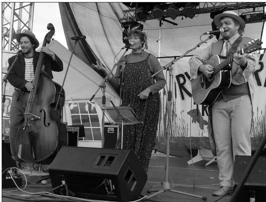
Jihočeská kapela Rybníkáři zahrála na Všeradování pásmo veselých vodnických písniček.

Výstava bude doplněna sbírkou starých žehliček a od 20 hodin bude slavností den pokračovat taneční zábavou s hudební skupinou Úžas. (rak)