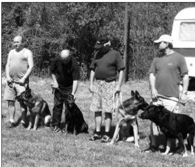
OSM STATEČNÝCH. Jen čtyři psovodi se svými čtyřnohými šampiony se letos v Řevnicích zúčastnili závodu přes Berounku.

Jak jsem zmiňovala již vloni, tradici závodu přerušila velká voda v roce 2002. Podle pořadatelů nebylo jeho obnovení jednoduché - mnoho pozemků na břehu řeky změnilo majitele, a tak bylo nutné hledat místo jiné. Nakonec se to vloni podařilo a my jsme se těšili, že si zazávodíme tak, jako před povodní, v konkurenci minimálně dvaceti závodníků. Bohužel jsme byli jen tři, kteří chtěli poměřit síly s Berounkou. Všichni jsme čekali, že letošní závod bude mít hojnější účast. Mýlili jsme se. Na startu se sešli jen čtyři odvážlivci. Závod začínal jako vždy na pravém břehu řeky, zhruba naproti řevnickému cvičáku. Řeka je v tomto místě minimálně 80 metrů široká. Po průtržích mračen byl uprostřed docela slušný proud. Závodníci absolvovali první část obrany a postupně překo-