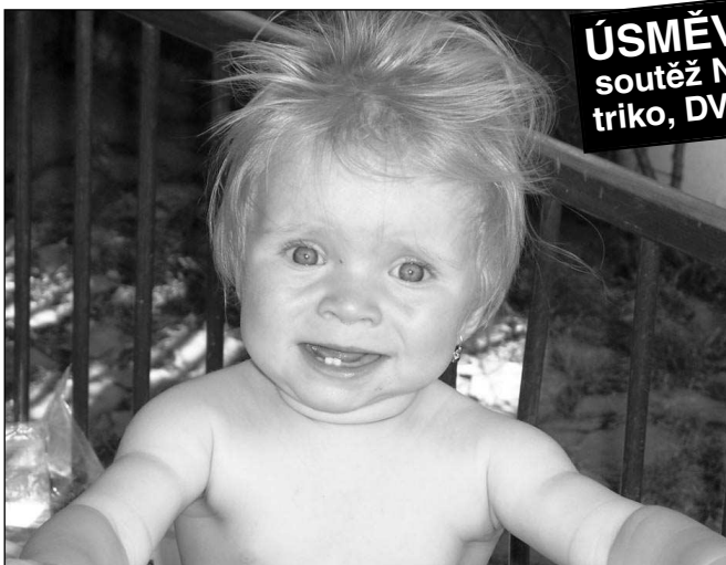
Tak jsem vyzkoušela 220 V...