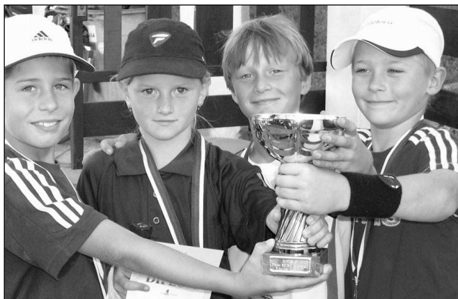
Malí řevničtí tenisté s pohárem, který vybojovali na krajském přeboru přípravek.