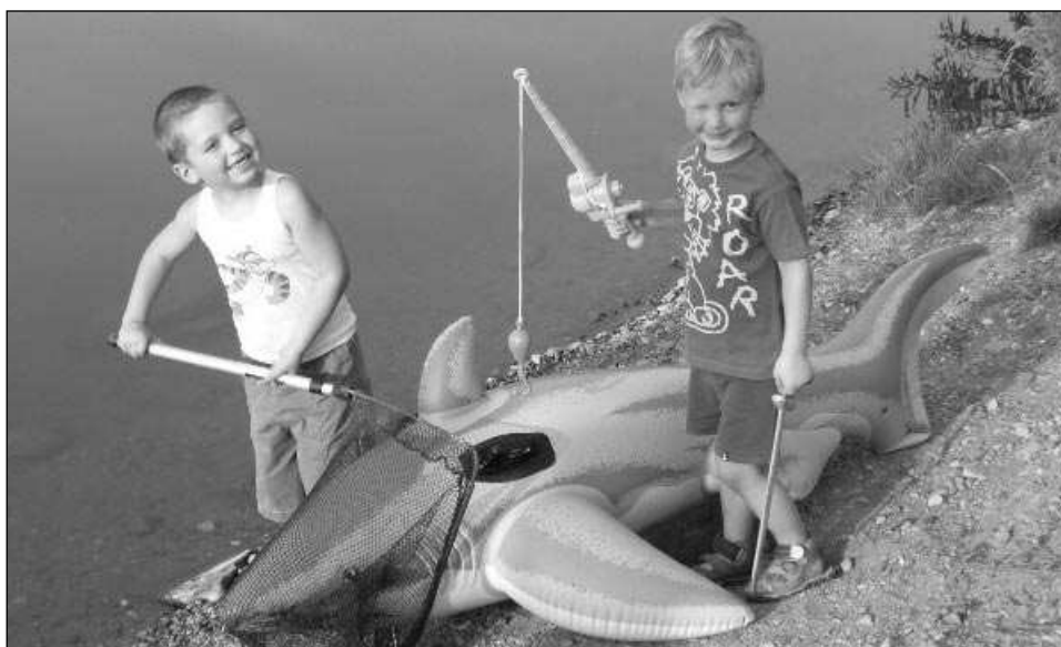
I v Berounce jsou žraloci...