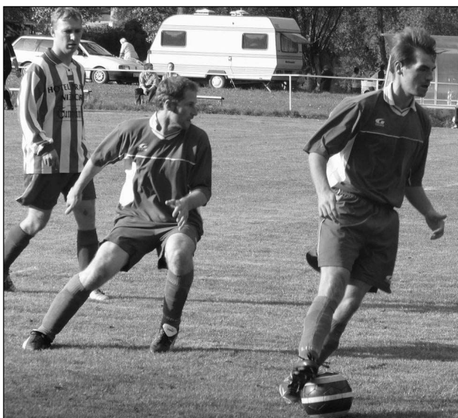
JASNÁ VÝHRA. Zadnotřebská fotbalisté (v tmavém) si doma s celkem Nižbora poradili přesvědčivě, vyhráli 6:2.

Třetí utkání na hřišti soupeře konečně přineslo bodový zisk. Domácí se od prvních minut tlačili před branku hostů. Převaha ale nepřinesla kýžený