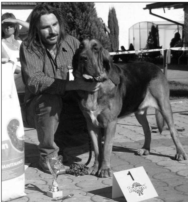
PSÍ KRASAVEC. Několik desítek psů rasy bloodhound se v Zadní Třebani zúčastnilo dvou speciálních výstav.