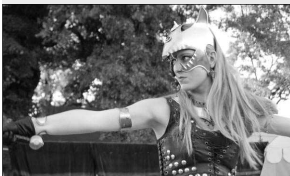
Setkání šermířských skupin nazvané Černošická Alotria se konalo 15. září u zámku v Dobřichovicích. Kromě bojovníků z celých Čech i Slovenska se akce zúčastnily také taneční skupiny Mericia a Gwi-nevra. Text a foto Andrea KUDRNOVÁ