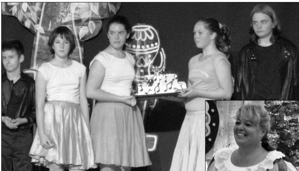
Děti ze souboru s narozeninovým dortem.