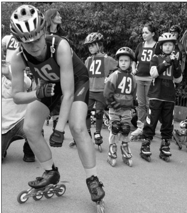
Do Černošic se sjeli vyznavači kolečkových bruslí.