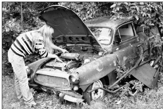
Kontrola před jízdou.