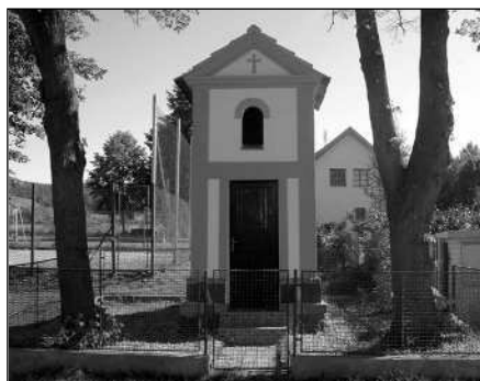
Výstava v Podbrdech představí historii obce a nabídne zábavu pro celou rodinu. Dominantou Podbrd je místní kaplička.

Na tomto nebezpečném úseku, kde došlo k dopravní nehodě již poněkolkáté, se zastupcům Osova podařilo před třemi lety prosadit změnu přednosti v jízdě. (rak, peš)