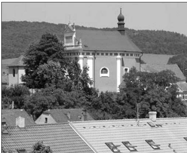
TETÍN. Starobylý Tetín je spjat se životem svatého Václava.

V drsném prostředí bojových družin se ocitá skutečná křesťanka Ludmila i její věřící vnuk. Václav má obdivuhodné vzdělání. Zná jak Cyrillo-Metodějskou staroslověninu, tak řečtinu i latinu. To bylo srovnatelné snad až s Karlem IV. Nemí to jednoduché žít jinak než okolní svět s jeho »zabavou« a politikou. V kronikách jsou zaznamenány výtky jeho okolí typu »je zkažen od kněží a učiněn jako mnich«. Vytýkali mu neúčast na pítkách družiny... Odcizení svým vrs-