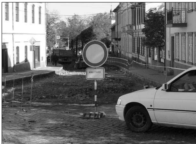
ZÁKAZ VJEZDU. Až do 10. listopadu bude uzavřen průjezd hlavním řevnickým náměstím.

na část Pražské ulice v centru kostky vrátit. Kdy se tak stane, nedokáže Cvcanciger odhadnout.