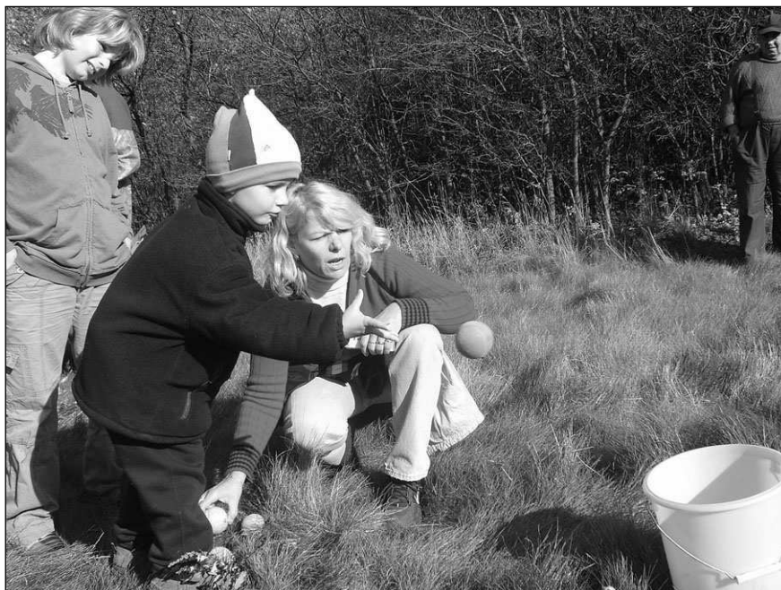
První osovská dětská olympiáda byla v říjnu spojena s drakiádou.