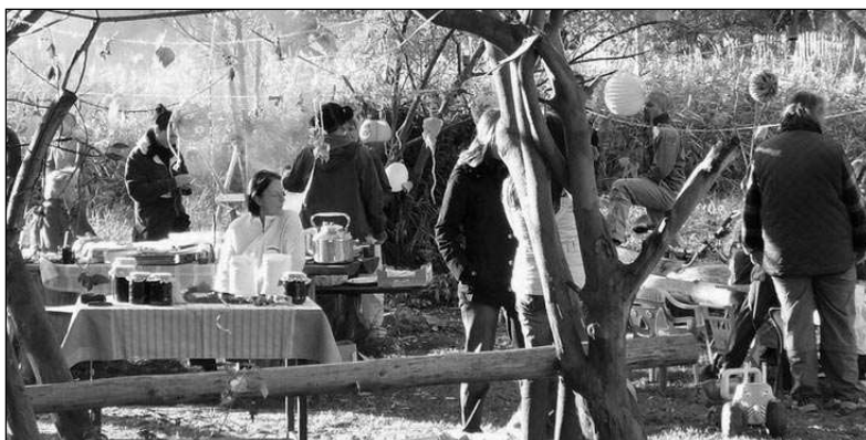
KOZÍ LOUKA. Vyzdobená louka, kde se konala dýňová slavnost.

Dýněmi a přírodninami vyzdobená louka v osadě Vatině se během chladnějšího, ale slunečného odpoledne zaplnila dětmi i jejich rodiči. Každý si zde našel nějakou zábavu. Dospělí hlavně povíдали, nejmenší děti si hrály na písku a v týpí, větší pak vyráběly s pomocí maminek lodičky z ponožek a klacků, lodičky ze skořápek nebo pruty na lovení ryb v potoce.