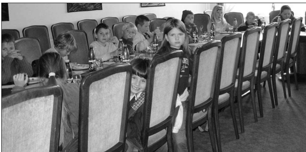
V PARLAMENTU. Třeboňským dětem se v Poslanecké sněmovně líbilo.

Podobné pocity měla i průvodkyně, která je provázela budovami sněmovny. Tolik se skamarádili, že ji děti nechtěly pustit. Jakmile však záčci byli vtaženi do připravené hry na hlasování, plně se vžili do nových rolí. Po vysvětlení procedury hlasování se volil ze tří kandidátů (tři začku čtvrté třídy) v tajném hlasování »předseda školy«. Všichni tři kandidáti k tomu přistoupili se vši vážností, se zájmem a nápaditostí se před-