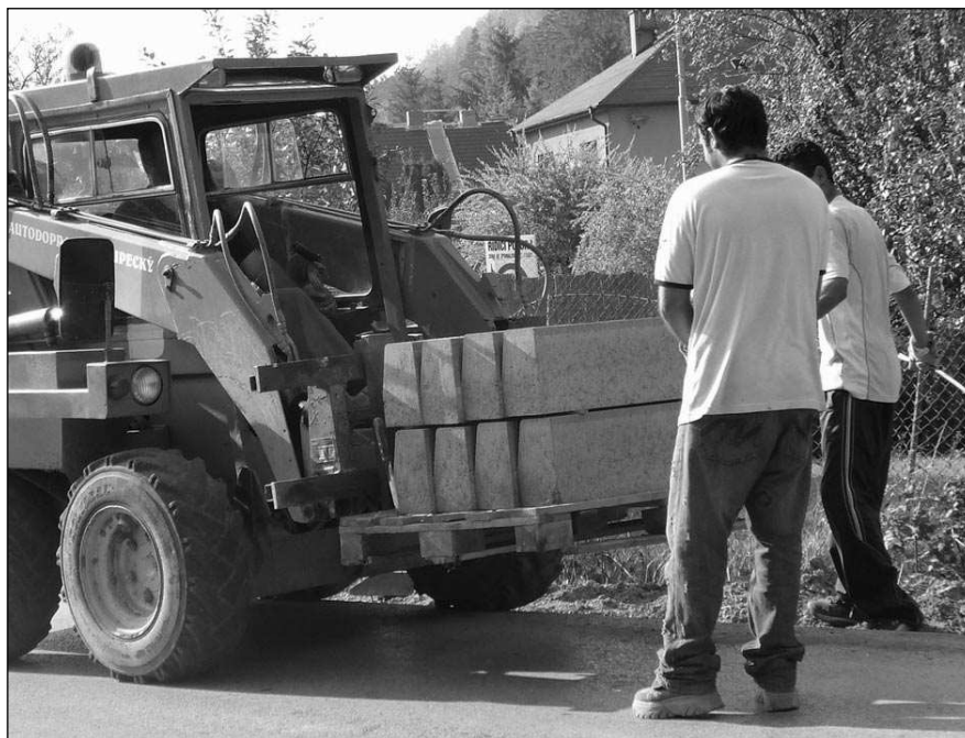
CHODNÍK UŽ ROSTE. Nový chodník do místní zadnotřebské části Vatina budují dělníci v těchto dnech. Kolaudace je naplánována na 26. října.

Současná nájemkyně restaurace Renata Novotná se již se svými »štamgasty« rozloučila a vyzvala je, aby zaplatili případné dluhy. (lup)