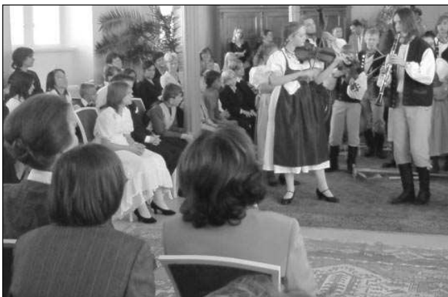
V LÁNECH. Dětská muzika Notičky při vstoupení pro britskou princeznu Annu a manželku presidenta Livii Klausovou.