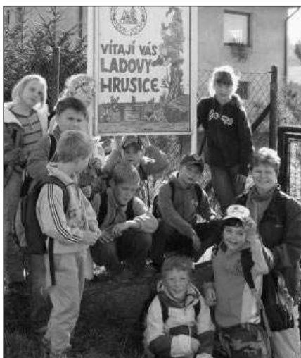
VITAJÍ VÁS HRUSICE. Zadnotřeboňští školáci v »Ladových« Hrusicích.

Děti si pak ještě prohlédly Muzeum Josefa Lady.