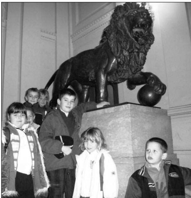
POD LVEM. Liteňští školáci v budově Akademie věd.

Druhá část koncertu patřila nám, Liteňákům, a našim hostům. Vystoupení navštívila dvojice učitelů, kteří