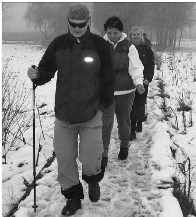
Turistická výprava na cestě k Chalupské slati.

Po krátkém občerstvení jsme se vrátili zpět na trasu a pokračovali do Strážného. Cesta byla docela dlou-