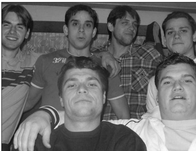
Ukončení podzimní fotbalové sezony oslavili fotbalisté Ostrovanu Zadní Třebaně předminulou sobotu. Na závěrečné se sešla většina A i B-týmů, mezi nimi i posily z Prahy (na snímku). Během večera bylo veselo, tančilo se i pilo, poslední skupinka vydržela dlouho přes půlnoc. (Iup)

Góly: Pitauer 2, Chaloupka, Tláček Revnické béčko má za sebou úspěšný podzim. V posledním utkání nemělo velké potíže s Klínkem, i když se po poločase, který skončil 2:1, mohlo zdát, že to po změně stran bude drama. Tým figuruje v první polo-