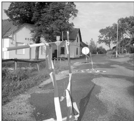
Opravu lážovické silnice zajistí kraj. Kdo bude mít na starost rekonstrukci přilehlé hráze určí místní šetření.

Příjemnou atmosféru jsme doladili malým občerstvením a dobrou kávou. (jk)