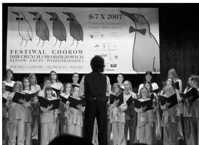
ZPÍVALI V POLSKU. Malí zpěváci z poberounského kraje na přehlídce pěveckých sborů v Polsku.