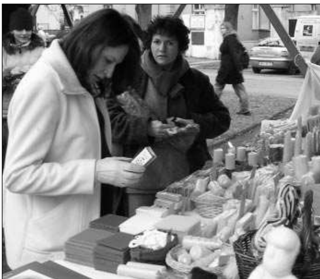
BOHATÝ ADVENT. Bohatý adventní program se koná celý prosinec. Leckde pořádají adventní trhy.

Při zahájení berounského adventu, které bude spojeno s rozsvícením vánočního stromu, vystoupí známý chlapecký sbor Boni Pueri, který zpíval i s Lucií Bílou. Na Husově náměstí se představí 2. prosince od 16 hodin. Už od 15.00 se v Berouně ko-