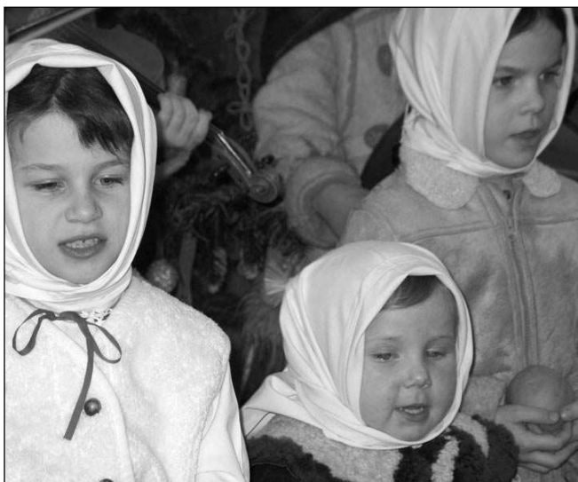
Několik vánočních koncertů chystá muzika Notičky.

Sérii vánočních koncertů ovšem zahájí mladí muzikanti z Notiček už 5. 12. tradičním Mikulášským koncertem v řevnickém kině. Od 17 hodin zde čeká na děti a rodiče krátké vys-