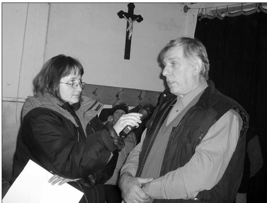
Starosta hasičů z Osova odpovídal na dotazy radia Region.

"V knihovně nám paní knihovnice představila knížku Boříkovy lapálie, ze které nám četla různé veselé příběhy. Jméno jejího autora jsme vyloučili v tajence a při tom si zasoutěžili kluci proti holkám. Kluci vyhráli. Pak jsme si mohli v knihovně prohlédnout různé knihy. Do školy jsme se vrátili pěšky," sdělili po výletě žáci čtvrtého ročníku osovské školy. (jf)