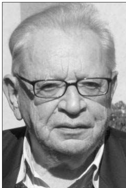
Známý cestovatel Miloslav Stingl, svého času obyvatel Černošic.