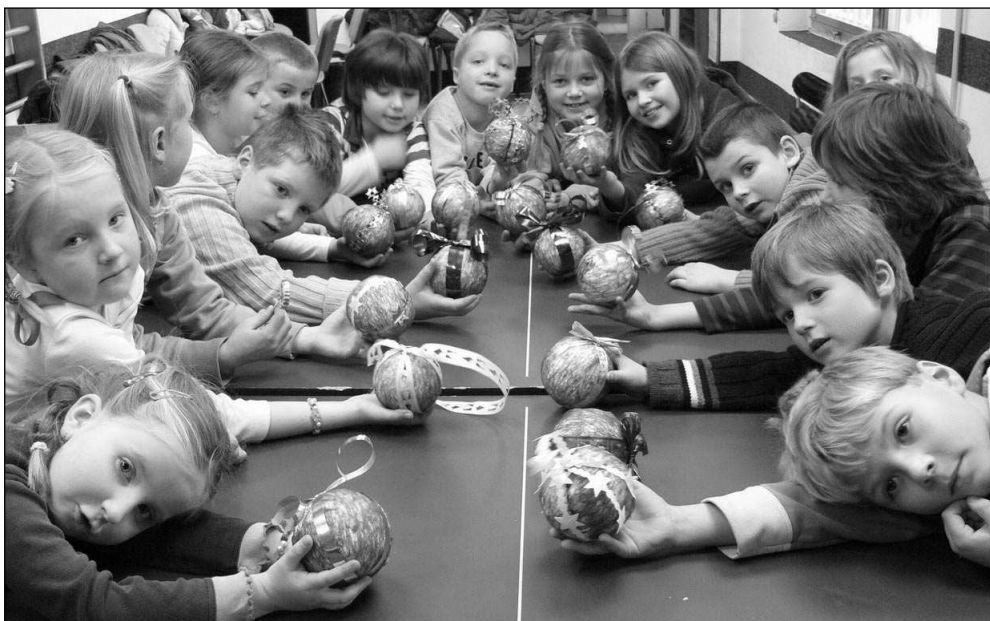
Zadnotřebaňští školáci s vánočními koulemi, které sami vyrobili.