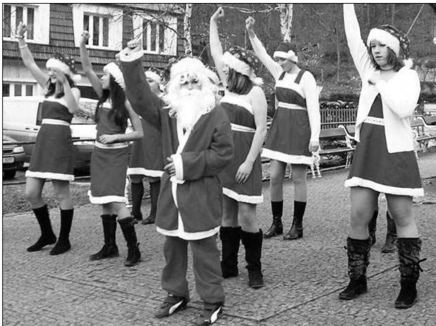
TANEČNÍCI Z LITNĚ. Na oslavách adventu pod hradem Karlštejnem vystoupili také žáci liteňské školy. Některé jejich taneční kreace byly velmi originální.

Uplynulou sobotu mohli příchozí slyšet Vánoční koledování i provedení divadelní společnosti