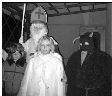
I Osovem prošli začátkem prosince čerti s Mikulášem a andělem.

Výcviku se účastnilo patnáct předškoláků i mladších dětí. Všechny děti prošly výcvikem úspěšně a obdržely mokrá vysvědčení. Naučily se nebát vody a zároveň být ostražití a nezapomínat na své bezpečí. Vyzkoušely si splývání, potápění a také plavání z různými pomůckami. Při každé lekci měli možnost volné hry ve vodě, což bylo pro většinu z nich to nejzábavnější. (jik)