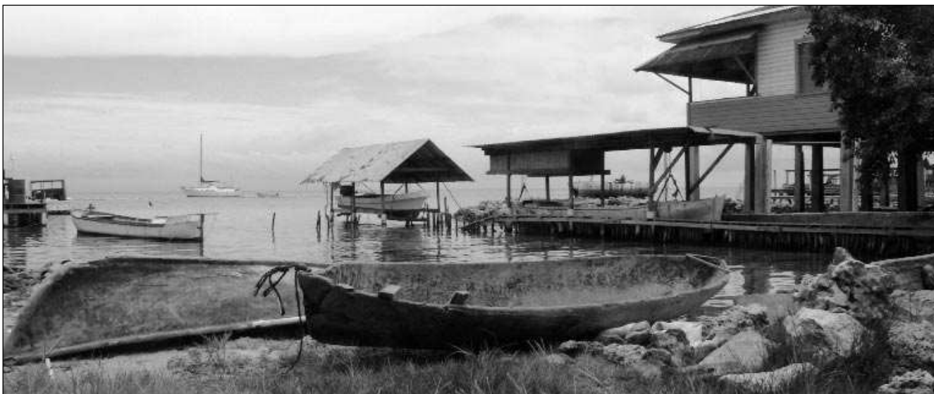
Ostrov Utila v Karibiku, na kterém autorka prožila dva týdny a naučila se potápět.

NOVÝ SERIÁL NN: PUTOVÁNÍ LATINSKOU AMERIKOU, ANEB ŠESTNÁCT MĚSÍCŮ NA CESTĚ - 5)