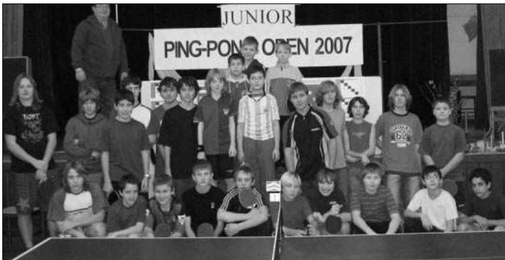
U STOLU. Účastníci zadnotřebského turnaje ve stolním tenise.