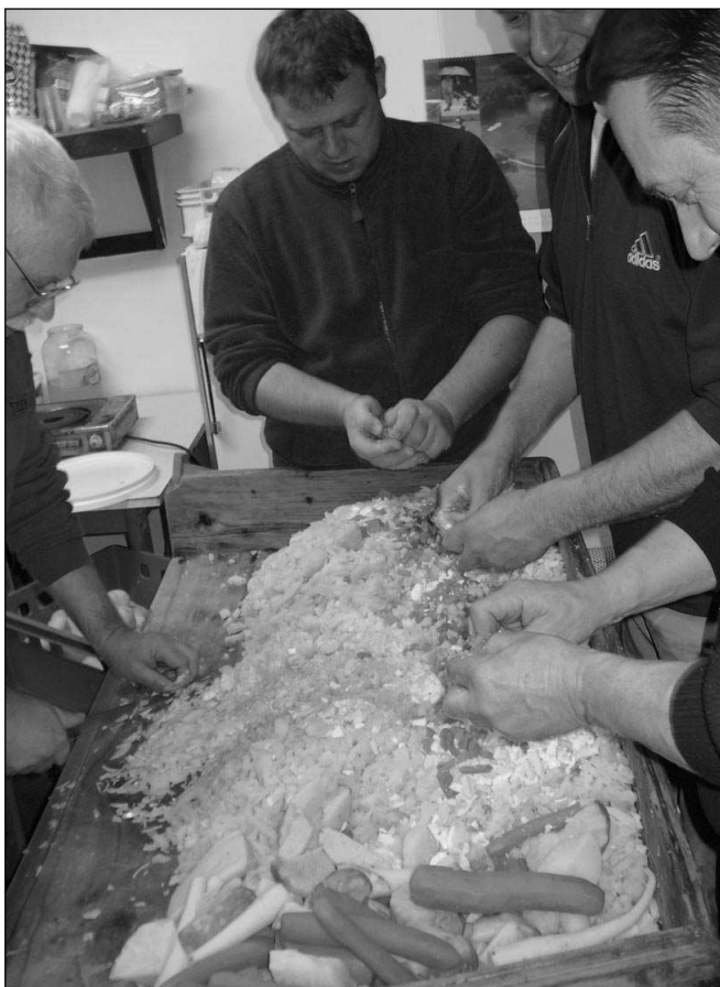
KUCHTÍCI. Svinařští muži při přípravě svého bramborového salátu, se kterým zabodovali na »salátině« v Mníšku.