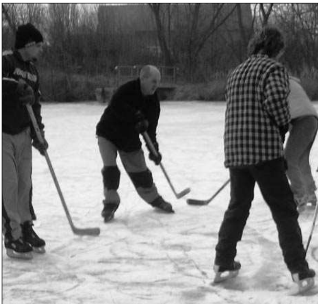
HOKEJISTI VE SVINĀŘÍCH. Led pokrýl na začátku nového roku hladiny rybníků v Poberouni i na Podbrdsku. Bruslilo se v Leči, Korně i ve Svinářích. Na zdejší rybníku Žába (na snímku) se odehrálo několik litých hokejových zápasů.