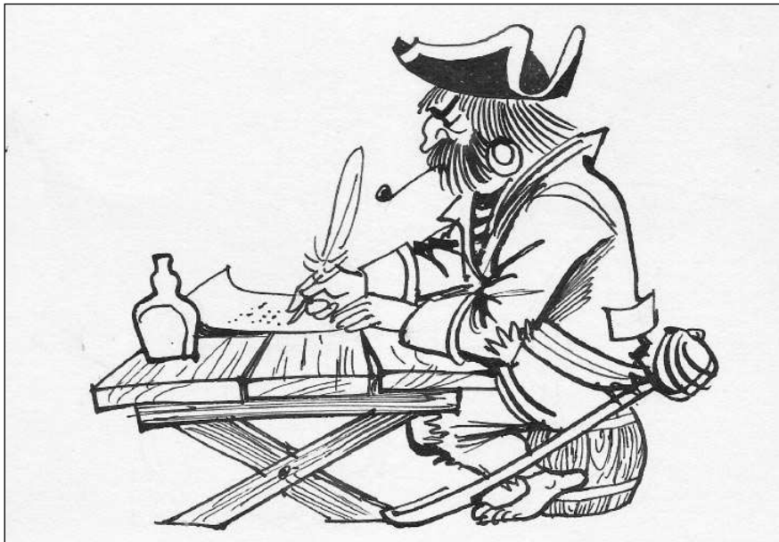
Tajné či neviditelné písmo využívali piráti i jiní dobrodruzi.

»Tajný« inkoust s písmem červeným vyrobíme ze dvou gramů fenolftaleinu a 50 gramů lihu. Text se »vyvolává« roztokem sody.