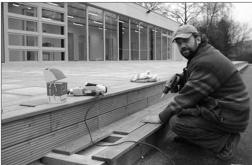
PŘED OTEVŘENÍM. Dělníci v těchto dnech dokončují práce na nové školce v Letech. Provoz zahájí v pondělí 14. ledna.

rychle,“ dodává s tím, že v červnu by se v areálu mateřinky měla konat tradiční divadelní pouť. Miloslav FRÝDL