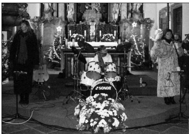
SCHOVANKY V KOSTELE. Koncert duchovní hudby, konaný již tradičně 25. prosince odpoledne, poskytl obecnstvu ve zcela zaplněném kostele sv. Václava v Mníšku pod Brdy pohodu a radost ze společného zpěvu. S pořadem Den přelstivý složeným z českých i zahraničních vánočních písní navštívila Mníšek dámská kapela Schovanky. Text a foto Jarmila BALKOVÁ