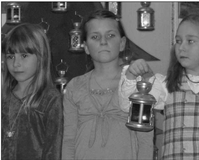
DĚTSKÝ SBOR. Závěrečné vystoupení dětí při předvánočním koncertě, který se konal v řevnickém Zámečku.