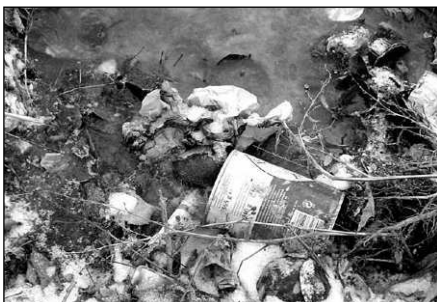
Do rybníku v Osovcích odváží odpad prozatím neodhalený pachatel.

Country skupina Špory vystoupí v sobotu 19. ledna 2008 od 20 hodin v sále Kulturního domu Neumětely