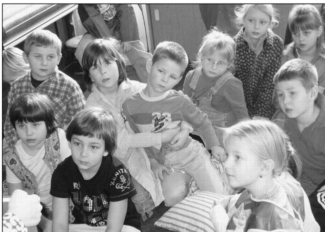
NA NÁVŠTĚVĚ. Zadnotřebaňští předškoláci při návštěvě místní málotřídky, kam budou chodit po prázdninách.

„Tady si všichni hrajeme na počítači. Máme různé výukové programy, třeba malování, český jazyk, matematiku s Alíkem a tak. Musíme tu být tičoučko jako myšičky a pracovat,“