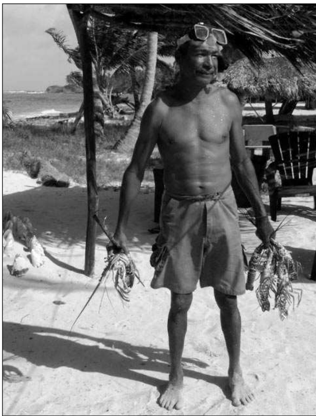
PAN DOMÁČÍ. »Pan domáci« českých cestovatelů na ostrově Pequena del Maíz, po lovu humrů.

Pequena del Maíz je krásným místem, kde po chvíli hledání narazíme na starší domorodou paní, pronajímající pár dřevěných bungalovů. Vybráme si ten s pohledem na moře, asi 50 metrů od pláže, kde je k dispozici jedna postel a stolek se svíčkou. Víc není třeba. Tekoucí vody nemajíce, elektřinu jen 2 hodiny