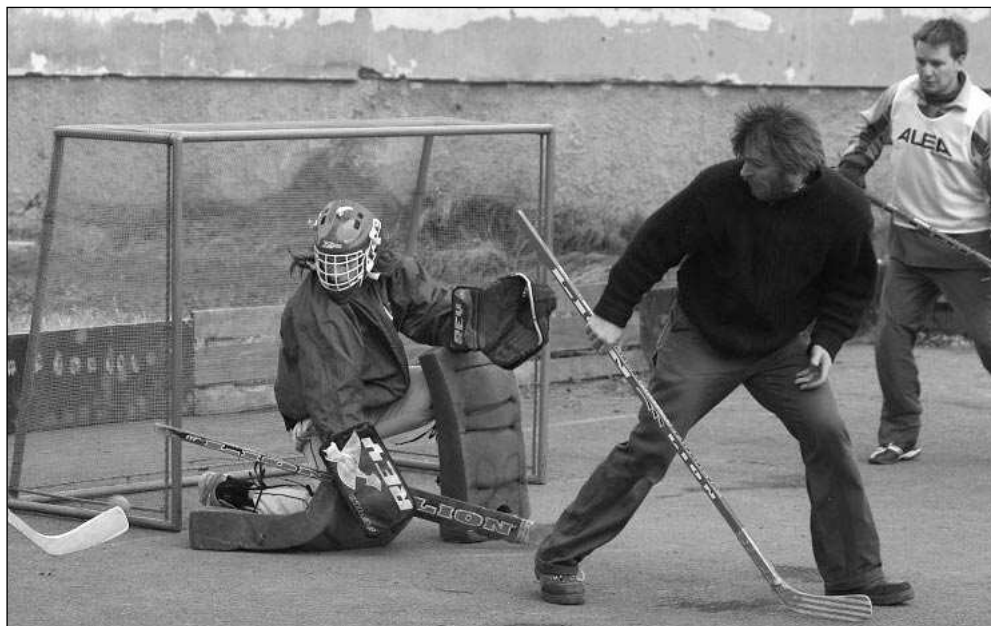
Boje řevnického turnaje v pozemním hokeji Bandy cup jsou v plném proudu.

Po čtyřech odehraných sobotách se v tabulce oddělili favorité od těch, kterým se zatím v základní části moc nedaří. Vedení Samotářů, finalistů dvou předešlých ročníků, moc nepřekvapí a pro znalé není překvapením ani druhé místo nově vytvořeného družstva Bája Pic, které se rekrutovalo z generace mladších hráčů Bostonu. Předpokládám jistě neod-