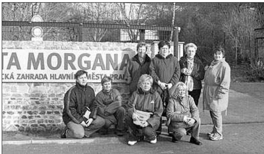
Holky v rozpuku před tropickým skleníkem Fata Morgana.