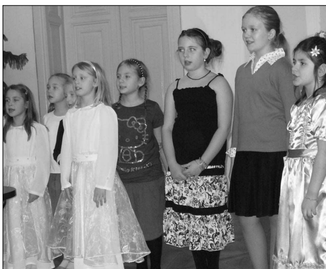
Malí řevníčtí zpěváci při svém prvním koncertu.