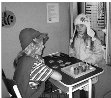
Při zápisu do první třídy osovské školy zkoušel vodník z počtů.

Do příběhu vstoupil Kapsoprásk a jeho pán, kteří začali v lese kácet stromy, stavět pyramidy z pet lahví a skla. Kvůli tomu uletěly Lesíčkovi včelky. Jeho bratranec Vítr ho však přenášel po kraji. Pomáhaly mu i víly Voněnka, Jasněnka a Voděnka, aby společně les zachránili. S pomocí přišly i děti - diváci. Vše dobře dopadlo a včelky se vrátily zpět k Lesíčkovi. Jana FIALOVÁ a žáci 5. třídy