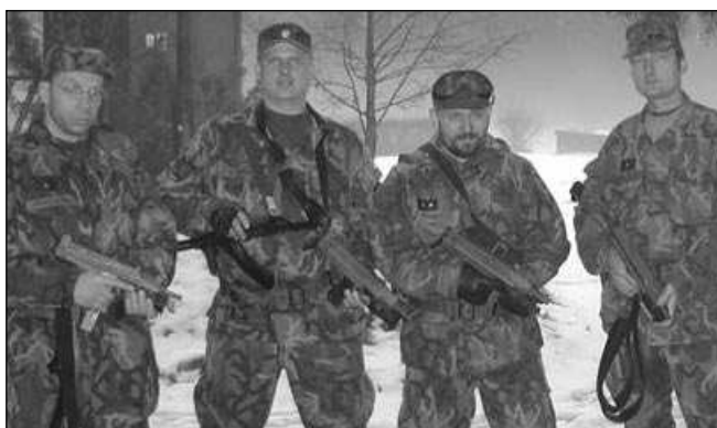
Mníšečtí policisté na střelecké soutěži v Polsku.

České družstvo střílelo ze starých vypůjčených zbraní, přesto mezi týmy, jež se účastnily soutěže poprvé, zvítězilo. „Podařilo se nám udělat z