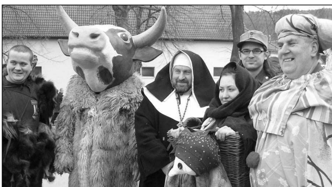
PO TERMÍNU. I když masopustní čas skončil Popeleční středou 6. února, Letovštit (na snímku) i Všeradičtí si slavnou »šafaňku« naplánovali na sobotu 16. února. (Viz strana 8)