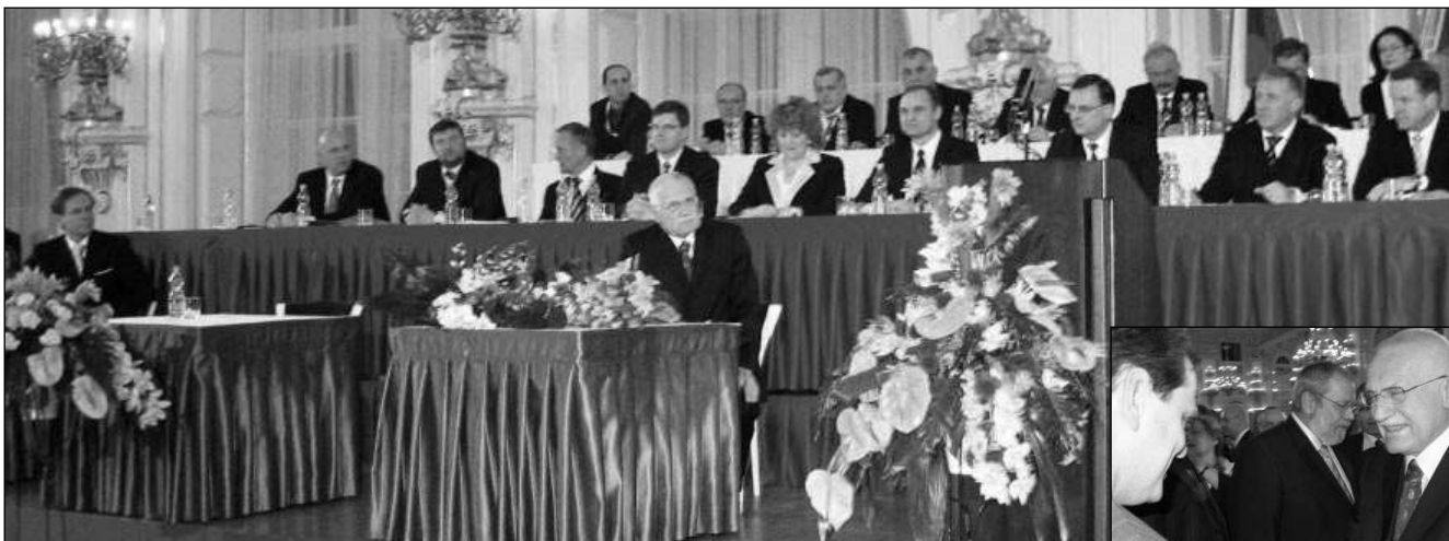
PŘÍ VOLBĚ. Kandidáti Václav Klaus a Jan Švejnar při volbě hlavy státu. Na malém snímku blahopřeje Jan Schwippel staronovému prezidentovi ke zvolení.