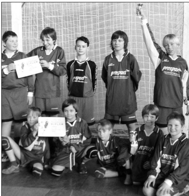
Malí házenkáři s pohárem z dobříšského turnaje.

Starších žáci obsadili druhé místo za Bakovem, mladší skončili třetí. Sice