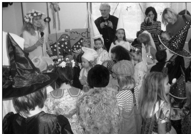
Caparti na dětském karnevalu v Mníšku pod Brdy.