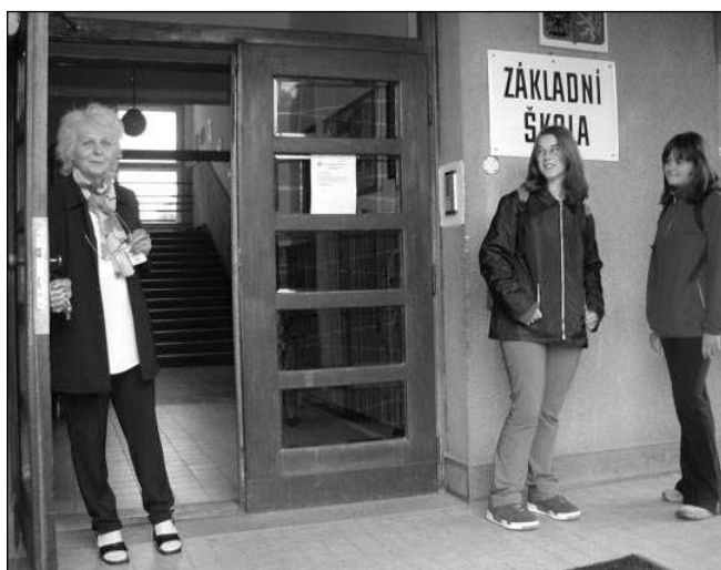
Řevnická škola přišla o ředitele. Ne všem se to líbí.