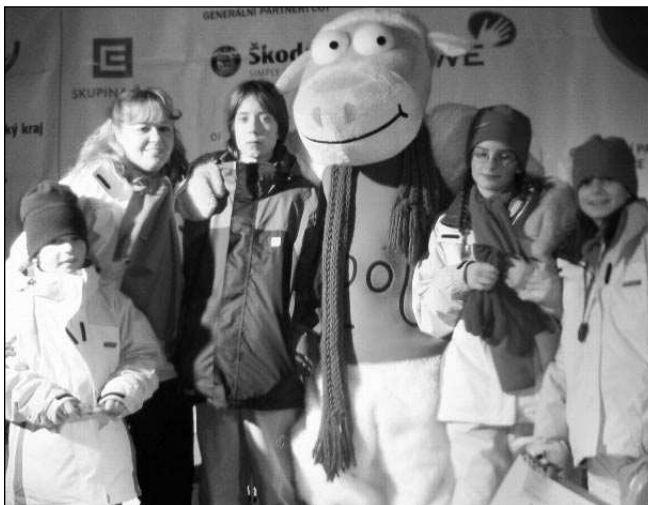
ŘEVNIČTÍ S MASKOTEM. Řevničtí výprava s maskotem her III. Zimní olympiády dětí a mládeže v Rožnově pod Radhoštěm.

Účastníci Her si z Rožnova odvezli mnoho pěkných zážitků. Během za-