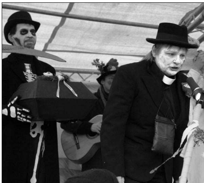
Masopust z kraje února oslavili také obyvatelé Černošic. Maskary na Masopustním náměstí předvedly vtipný program.

Nejlepší maskou byl vyhlášen Templářský rytíř. Průvod se vřel, medovina i víno tekly proudem.