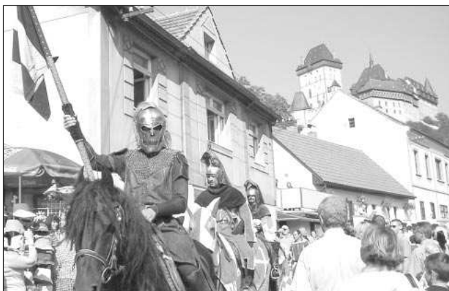
Uspěje Karlštejn v soutěži O nejpohádkovější hrad?

Druhý ročník ankety O nejpohádkovější hrad nebo zámek vyhlásil stejně jako loni Národní památkový ústav. Je do ní zařazeno zhruba devět desítek historicky cenných objektů spravovaných touto státní institucí. Svá želízky v ohni má i poberounský, respektive podbrdský kraj – o vítězství v anketě bojují hrady Karlštejn, Křivoklát, Žebrák s Točnickem i zámky Hořovice a Mníšek. Na konci února zatím první tři přičky patřily moravským zámkům - Hradci nad Moravicí, který vedl s velkým odstu-