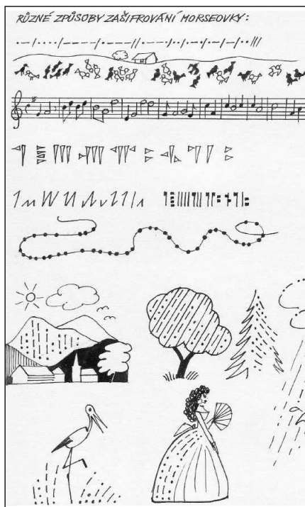
Zakulčená morseovka. Kresba Jiří PETRÁČEK

Jednoduchou šifru získáte i přehozením určitých písmen v abecedě nebo převodem písmen do libovolně zvolených číslic (např. A=18, B=1, Z=5). Určitým číslem můžeme pak i naznačit, že vý-