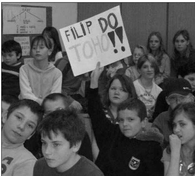
Děti fandí spolužákům při recitační soutěži.