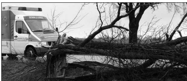
DÁL SE NEJEDE. Vichř, který se o víkend přehnal nad Českou republikou, napáchal mnoho škod i v našem kraji. U hřiště poblíž zadnotřebaňské školy například spadl moutný smrk. Provoz mezi Lety a Mořinou přerušil starý strom, který vítr shodil přímo na silnici.