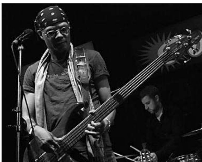
Muzikantská extratřída, newyorský basista Fernando Saunders.

Saunders, který kromě toho, že skvěle ovládá basovou kytaru, také zpívá, skládá a produkuje koncerty, patří mezi absolutní světovou muzikantskou elitu. Od 80. let spolupracuje s uznávaným představitelem městské-