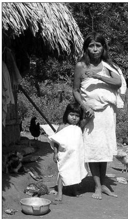
V Kolumbii se řevnická cestovatelka potkala s indiány.

Návrat do civilizace je na jednu stranu příjemný, ale nakonec se všichni shodujeme, že poněkud