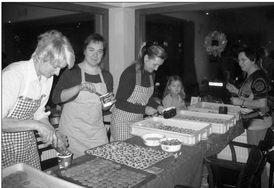
KDYŽ MAMINKY ZDOBÍ. Maminky klientů z denního stacionáře Náruč při zdobení svátečního cukroví.