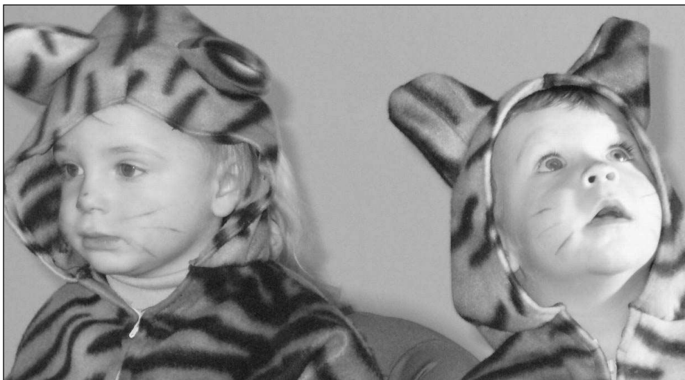
MALÉ ŠELMY. Na hlásnotřebském dětském karnevalu si užívali také dva malí tygřiči.