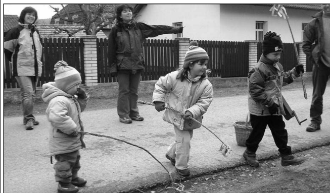
HODY HODY DOPROVODY... Malí i velcí koledníci vyrazili o velikonočním pondělí na pomlázku. (Viz strana 3)