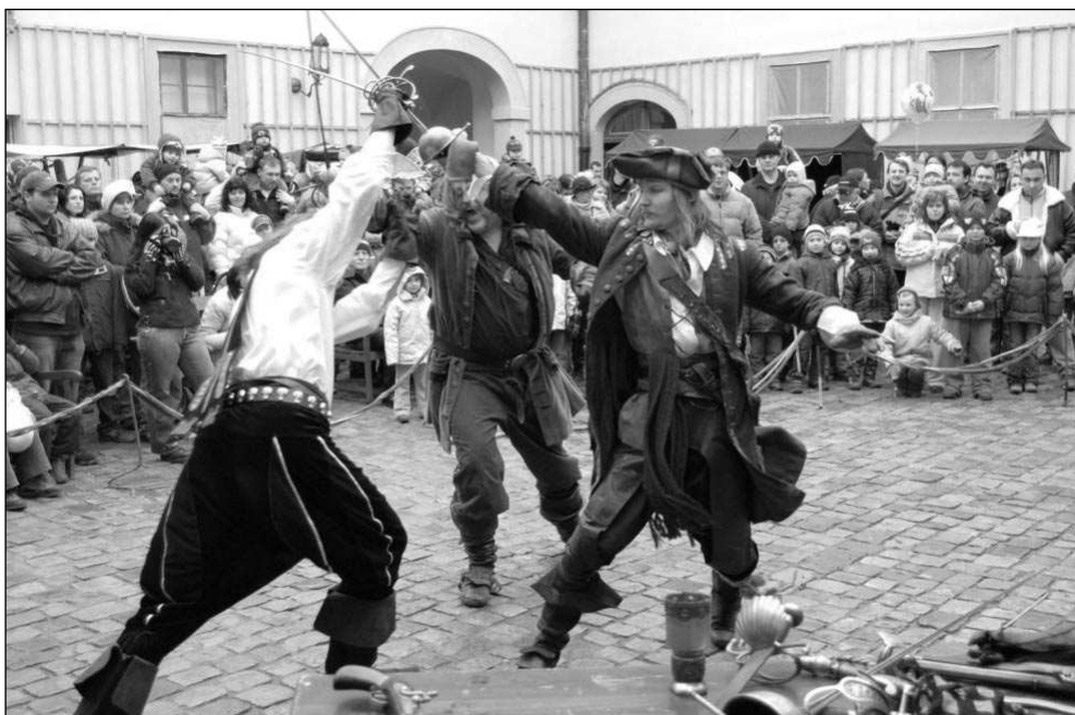
VELIKONOČNÍ SOUBOJ. V Mníšku zkržili zbraně šermíři ze skupiny Alotrium.

„Pohádku jsme zahráli dvakrát a děti dostaly ještě dárek - sladké marcipánové kuřátko,“ uvedla jedna z pohádkových postav. Nechyběl veselý a poučný příběh O slepci a kulhavém, na motivy Pašijových her, který připomněl, že Velikonoce jsou křesťanské svátky. K dobré pohodě celý den vyhrávala kapela Nešlapeto. S dětmi si nakonec zatancovalo a zazpívalo i Kuře, maskot sbírky Pomozte dětem. Rozdováděné Kuře celý den žádalo o příspěvek do celostátní sbírky a nakonec díky darům návštěvníků na konto sbírky přibýlo přes 11 000 Kč. Zámeckou expozici během velikonočního víkendu vidělo 500 návštěvníků. Na Velikonoční Pondělí byl zámek otevřen letos poprvé a dorazili i kotevníci. Jana DIGRINOVÁ