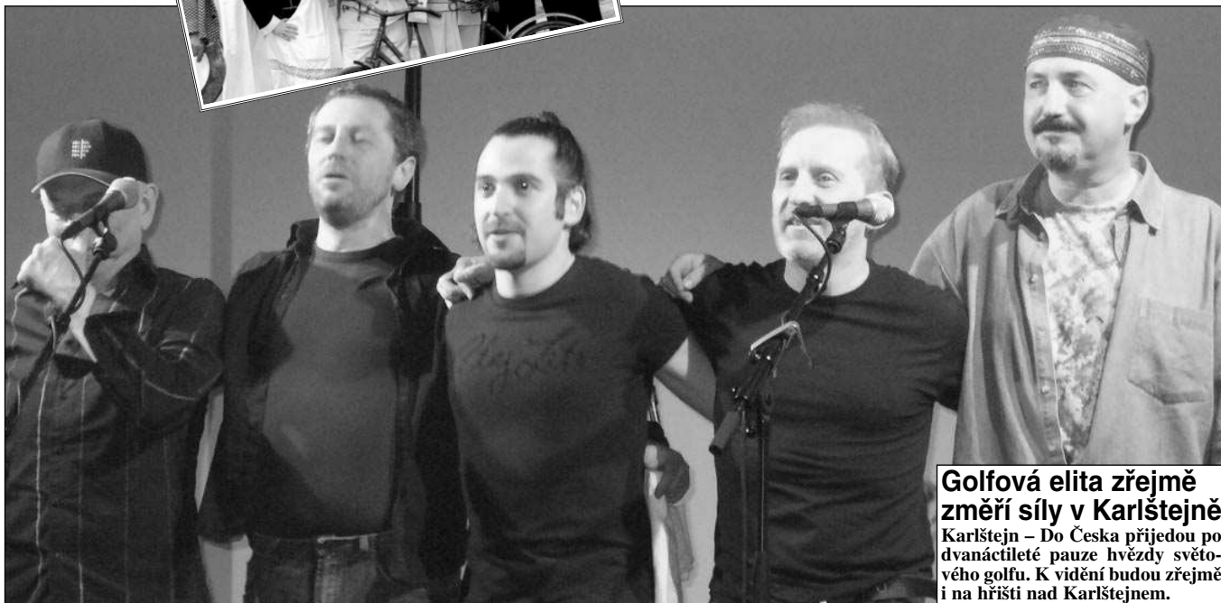
ČECHOMOR. Skvělý zážitek představoval koncert kapely Čechomor v Hlásné Třebani.