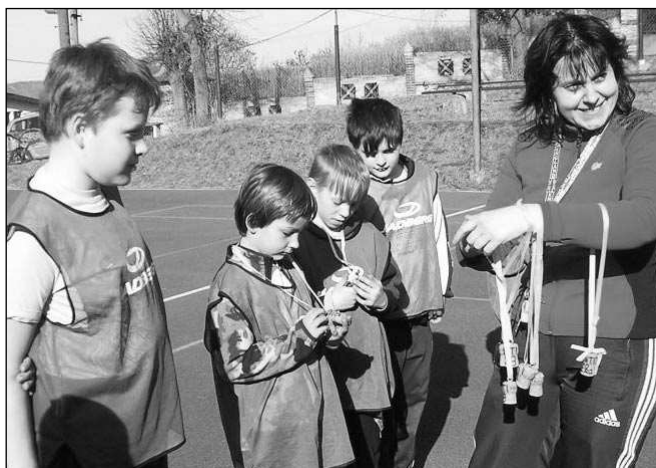
Třídenní soustředění nejmenších řevnických házenkářů se konalo poslední březnový víkend na hřišti v Tyršově stromořadí. Na závěr špuntů dostali stylové pamětní »medaile« ve tvaru špuntů.

dětmi, mládež a začínající turisty. Startuje se z jídelny Kovohtu Mníšek pod Brdy od 6,00 do 13,00. Jedním z občerstvovacích míst a zároveň průchozím bodem je rozhledna na Studeném vrchu nad Malým Chlumcem. Po prezentaci zde účastníci obdrží diplom i upomínku a budou moci rozhlednu navštívit. Martin NĚMEC