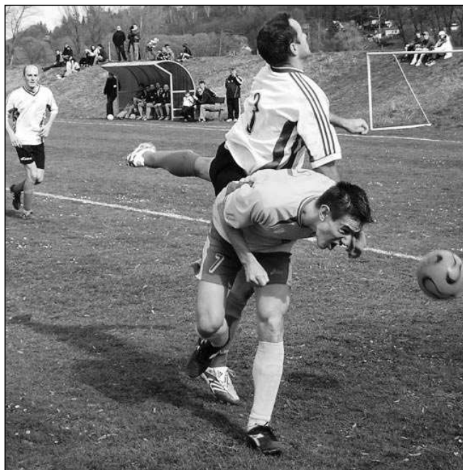
ZAČALI VÝHROU. Domácím vítězstvím 2:0 nad Vonoklasy zahájili letoviští fotbalisté jarní část mistrovské soutěže.

Hosté vstoupili aktivně do utkání a prvních 10 minut měli mírnou převahu. Domácí se postupně vymanili z tlaku a postupně zahodili několik šancí. Jediný gól dal po dlouhém