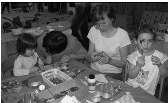
V liteňské školce malí i velcí barvili kraslice.

Letos se šlo hodně rodičů, všichni si vyzkoušeli barvení kraslic různými