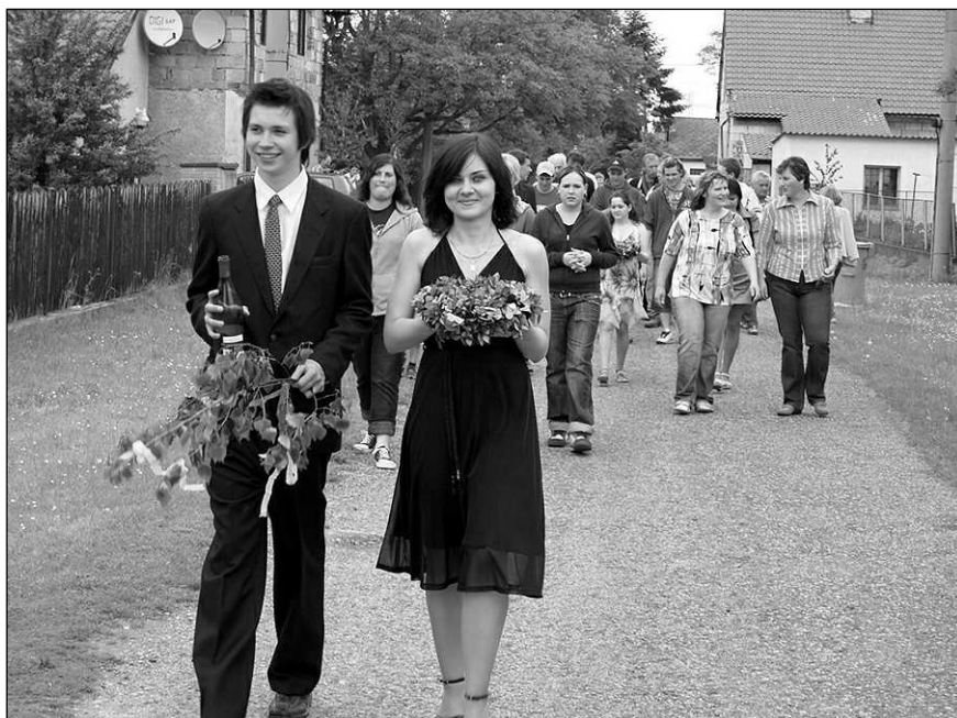
Májovníci z Vižiny zvali dům od domu na večerní májovou veselici.

se uskuteční v neděli 8. června 2008 od 14 hodin na hřišti TJ Vižina. MOŽNÁ PŘIJDE I KOUZELNÍK.