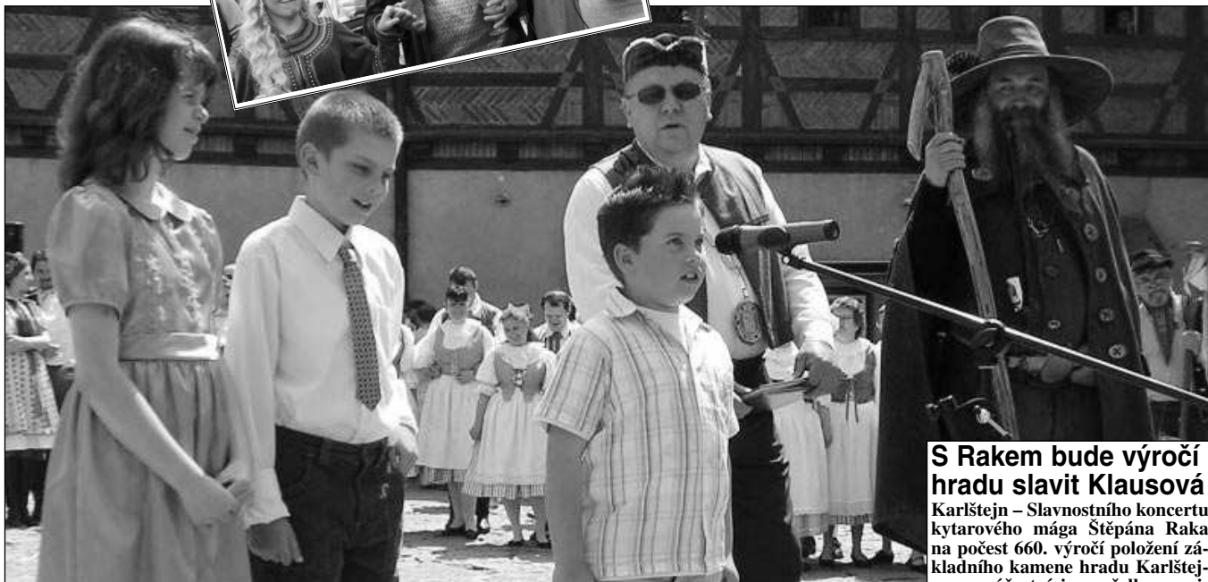
POPRVÉ NA HRADĚ. Folklorní festival Staročeské máje vyvrcholil uplynulou sobotou na Karlštejně. Bylo to poprvé ve staleté historii hradu, kdy se zde odbyval folklorní program. (Viz strana 3)

Císař opět poveze klenoty Dvanáct stran informací z našeho kraje