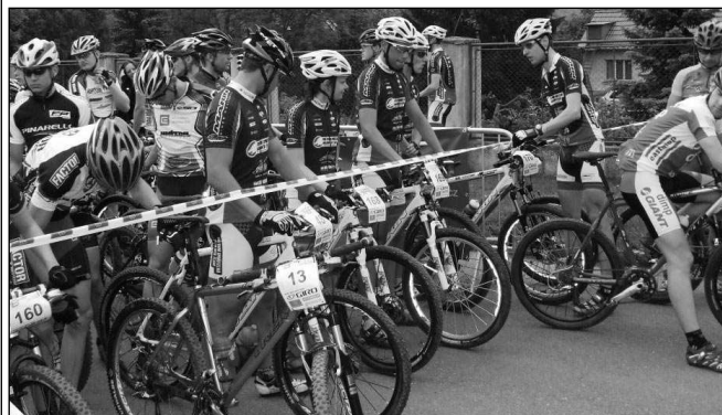
NA STARTU. Cyklistický závod GIRO Trans Brdy 2008 se startem v Letech se jel 17. května. (Viz strana 12)