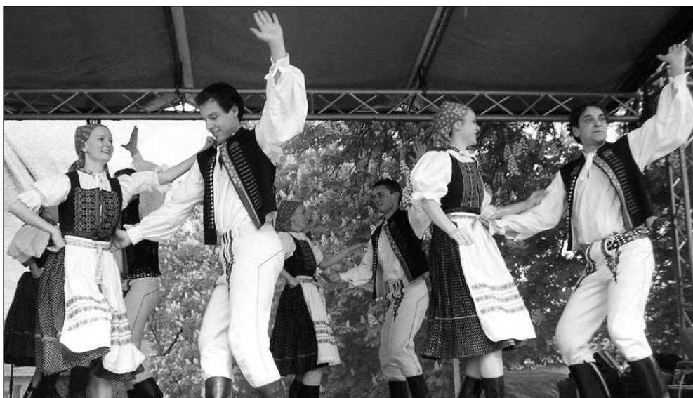
Temperamentní vystoupení v Mníšku pod Brdy na májích předvedl slovenský soubor Šarvanci.

Týden před Karlštejnem se poberounský folklorní festival Staročeské máje konal na náměstí v Mníšku pod Brdy. Po třinácté hodině vyšel průvod krojů v čele s kapelou Třehusk z