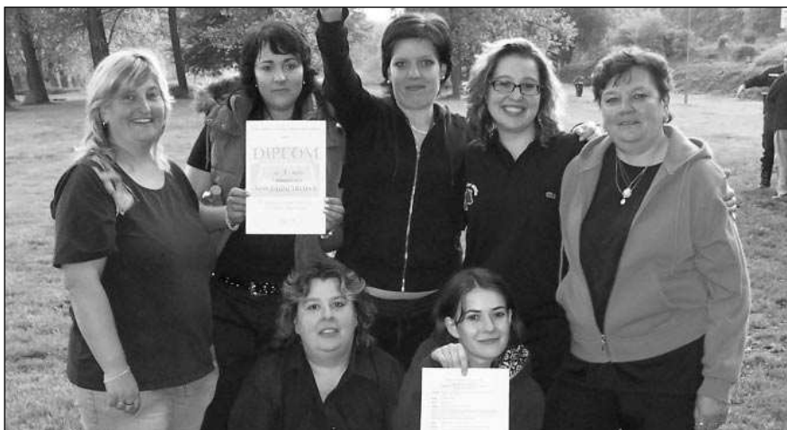
POSTUP! Zadnotřebeňské hasičky po vítězné soutěži v Karlštejně.

Kromě žen ze Třebeň si přijely zasoutěžit ženy z Drahlovic, které loňský ročník neměly s kým změ-