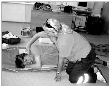
Hostomické děti si na figuríně vyzkoušely dýchání z plic do plic i nepřímou masáž srdce. Kurz záchranářů si žáci zakončili testem.

Děti byly vtaženy do děje a radily králi a královně, jak se mají rozhodovat. Pokoušely se rozesmát smutnou princeznu a pomohly odhalit zlomyslné a hloupé rádce. A jak to v pohádkách bývá, vše dobře dopadlo a konala se slavná svatba. Eva NÁDVORNÍKOVÁ