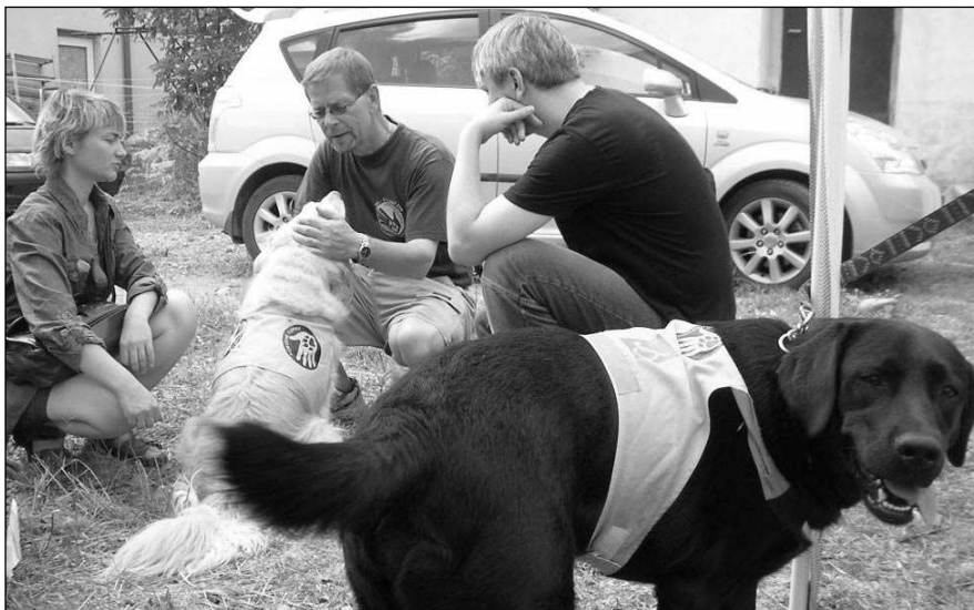
NA POMOC TLAPKÁM. Výtěžek z charitativního koncertu dostalo sdružení Pomocné tlapky zabývající se výchovou asistenčních psů.

Pomocné tlapky jsou nezisková společnost, zabývající se výchovou asistenčních psů. Ti jsou velkou oporou pro těžce tělesně postižené lidi. Psi jsou cvičeni například pro podávání na zem spadlých předmětů, umí vyndat prádlo z pračky atd., ale jsou to také především kamarádi svých pánů. Ti je dostávají po dokončení výchovy do užívání zdarma.