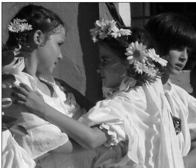
Děti z řevnického souboru Klíček.

* Vojáci Berounka. Výstavu s tímto názvem můžete v berounském Muzeu Českého krasu navštívit do 24. srpna. (mif)