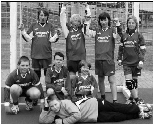
Mladší žáci řevnických házenkářů.

V podvečer proti nám nastoupili Západočeši, Příchovice, dosud neporažený celek. Taky jsme se ho zalekli - začátek se nám moc nepovedl a z 0:4 jsme se nedokázali odpoutat. Hru