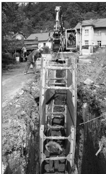
Kanalizace se v Srbsku pokládá až do šestimetrové hloubky.