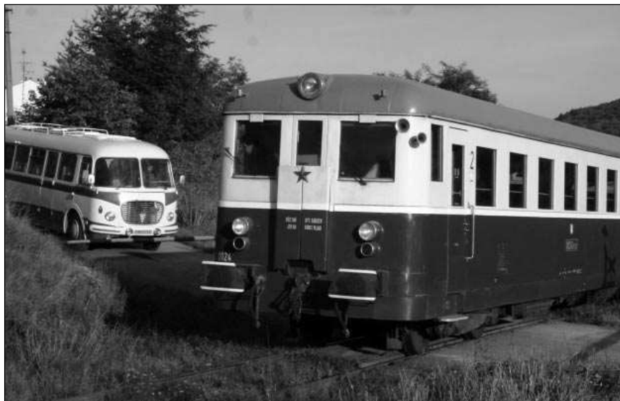
MOTORÁKEM PO KRASU. Na okružní jízdu po tratích Českého krasu vyrazí 14. září historický motorový vlak.

Poberouní - Nechte se pozvat na vyhlídkovou jízdu historickým motorovým vlakem po Českém krasu. Zvláštní vlak, složený z motorového vozu řady M 262.0 a přívěsného vozu řady Bix, vyjede na okružní jízdu v neděli 14. září. Součástí trasy je projetí dlouhých vleček do velkolomu Čertovy schody a do lomů Mořina, dále se pojede po trati Zadní Třebaň - Lochovice, po známé »hrbaté« přes Loděnice a dvakrát srdcem