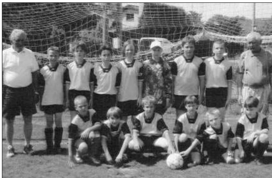
NEJMENŠÍ FOTBALISTÉ. Malí fotbalisté z letovské přípravy.

Po získání titulu přeborník okresu naše přípravek bojovala o krajský titul. Za účasti dvanácti družstev se letos hrálo ve Vlašimi. Kluci se předvedli a nádherným výkonem bezpečně vyhráli základní skupinu se skóre 9:2. Předvedenou hrou překvapili