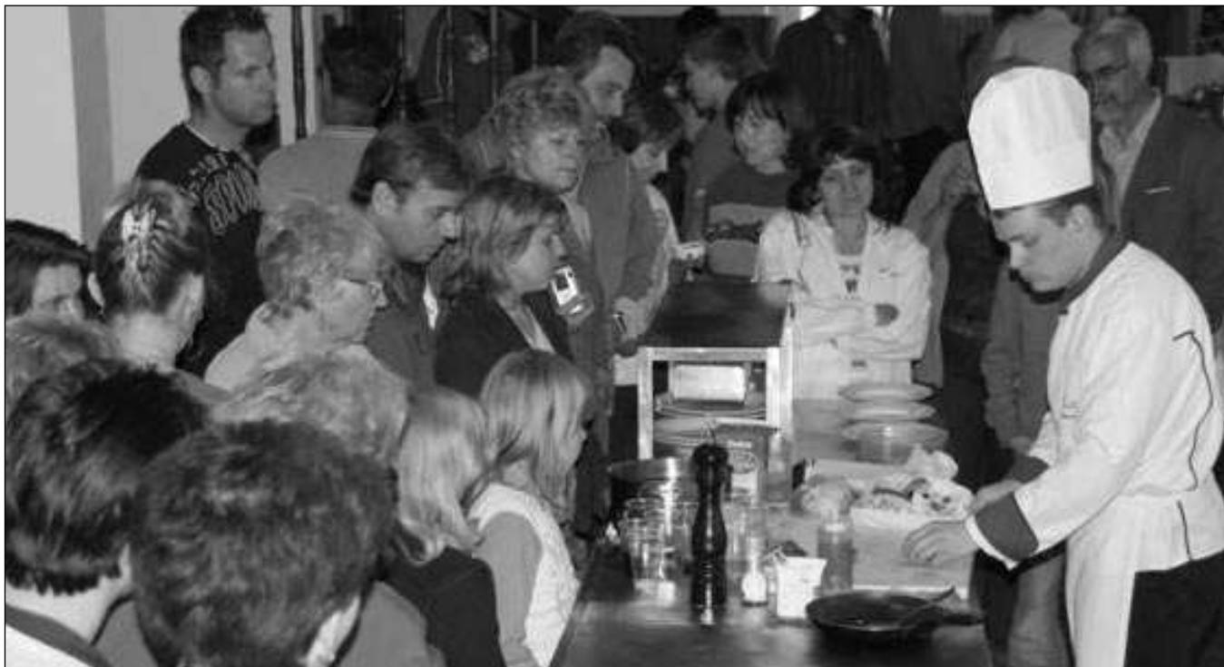
ZÁJEM O KUČAŘE. První ročník kuchařské soutěže o putovní pohár M. D. Rettigové se loni těšil velkému zájmu diváků.

Aktuální informace ze Všetradic a okolí, číslo 2/2008