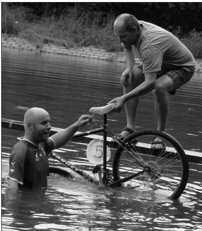
NEDOJEL. Přejet úzkou lávkou na kole není jednoduché. Většina závodníků skončila i s kolem v rybníku Žába.

Sbor dobrovolných hasičů, který v Hlásné Třebani funguje už od roku 1904, »rozjel« nově i webové stránky, kde se o jejich činnosti lze dozvědět nejvíce. Třeba to, že hledají další kolegy a - sponzory! Finance potřebují především ke zvýšení akceschopnosti, tedy k obnově zásahového vybavení, na které nemá obec dost peněz. Hasiči ovšem nestojí jen s nataženou dlaní, ale snaží si vydělat sami na nejrůznějších akcích, které pořádají. K nim patří sběr železného šrotu, úklid obce, zajištění Hasofestu aj. Z těchto peněz už zakoupili benzínový agregát, osvětlovací reflektory a svépomocí zrekonstruovali Tatrú 148. (šm)