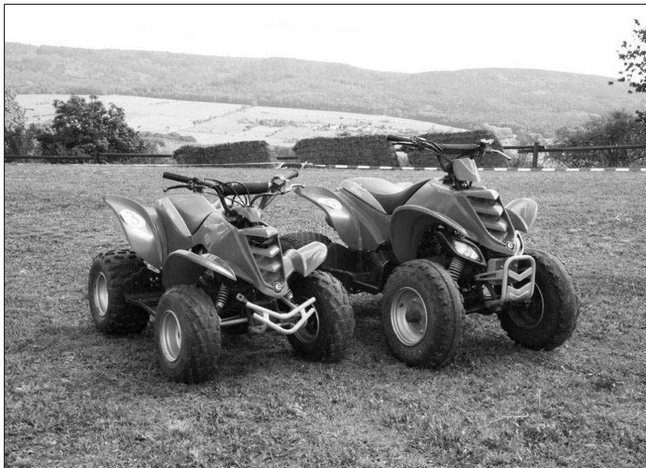
Takovéto stroje jsou pro vás připraveny na čtyřkolkové dráze U Bobeše.