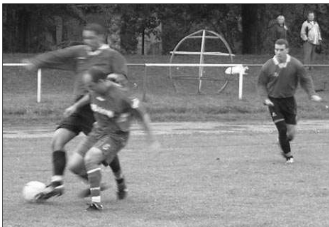
Nad Libiší Řevničtí na svém hřišti vedli už 4:2. Přesto se z vítězství nakonec radovali hosté.

Bod ze hřiště Neumětěl, které loni bojovaly o první příčku je určité cen-