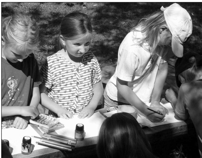
Děti se na »Kozí« louce ve Vatině vyřádily.

Díky patří nejen jí, ale též panu Placákovi a obecnímu úřadu za finanční příspěvek. Lucie PALÍČKOVÁ