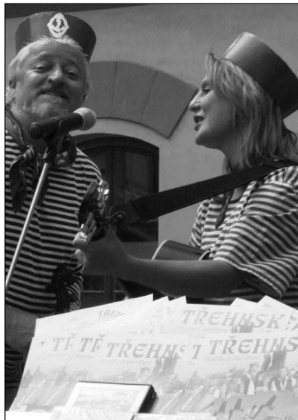
NA CHODSKÝCH SLAVNOSTECH. Několika stovkám diváků zahrála druhý srpnový víkend v Domažlicích na vyhlášených Chodských slavnostech pobořoušská kapela Třehusk. Muzikanty od Berounky na konci prázdnin čeká zájezd do Itálie a v polovině září pak živá nahrávka Českého rozhlasu Plzeň.