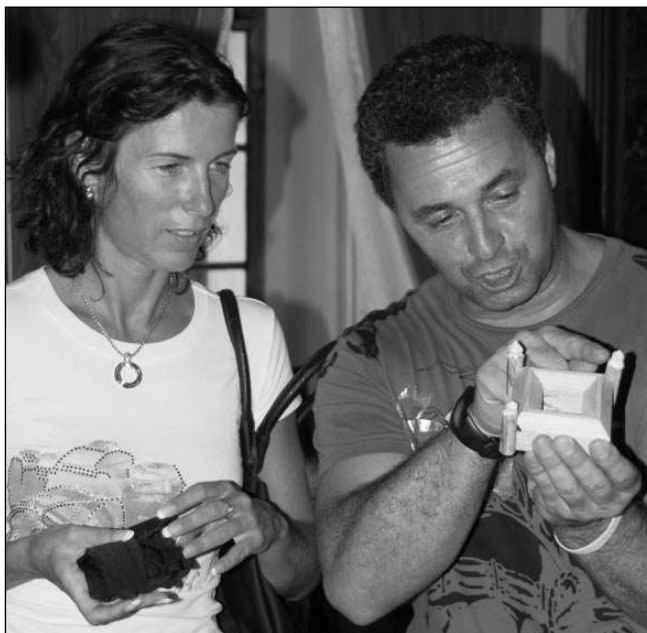
Martin Dejdar při prohlídce mníšického zámku.