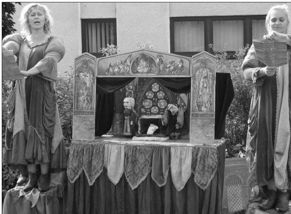
NA CESTÁCH. Loutkové divadlo pro děti na řevnickém festivalu Cesty.

„Jsem moc spokojený, jak s úrovní vystupujících, tak s diváky, kteří se, myslím, bavili. Mám radost, že nás