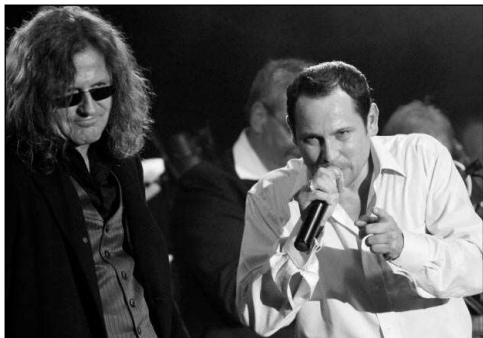
Velkolepý koncert pořádal na nádvoří Karlštejna známý zpěvák Pavel Vítek. Spolu s ním vystoupili i Kateřina Brožová či Josef Vojtek.