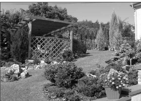
NEJHEZČÍ ZAHŘÁDKA. Nejhezčí zahrádku ve Všetradicích má podle poroty Rudolf Brož.

Ostatní pořadí nebyla hodnocena. Děkujeme všem přihlášeným za jejich účast a zároveň jim přeje mnoho zdaru při zvelebování jejich zahrádek. Věříme, že příští rok se naší soutěže zúčastní ještě větší počet soutěžících. Ti, kteří nezáskali ocenění letos, doufám nezanevrou a zapojí se npřesrok znovu. Bohumil STIBÁL