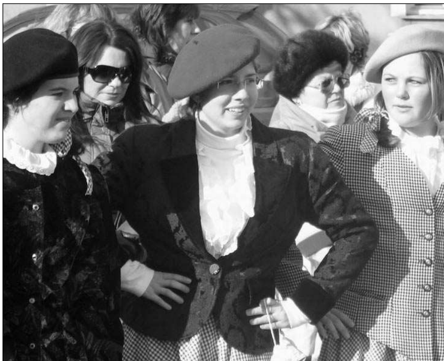
PROMĚNY NA MASOPUSTU. Část řevnické taneční skupiny Proměny na letošním masopustu v Zadní Třebani.

Naše práce obsahuje široké taneční spektrum, které nás baví a přináší nám radost, například country, street dance, moderní balet, historický tanec a tak dále. Do svého programu nezařazujeme folklor, neboť respektujeme skutečnost, že v Řevni-